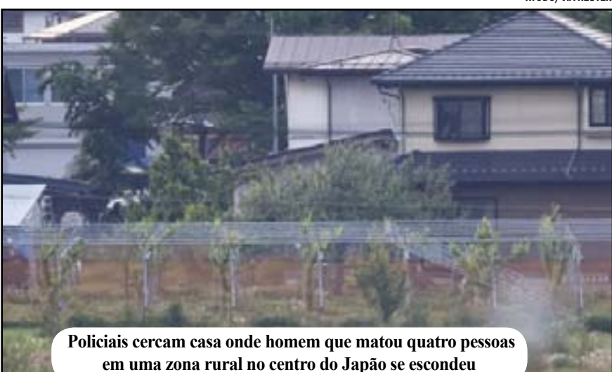
Polícia cercou casa onde homem que matou quatro pessoas em uma zona rural no centro do Japão se escondeu