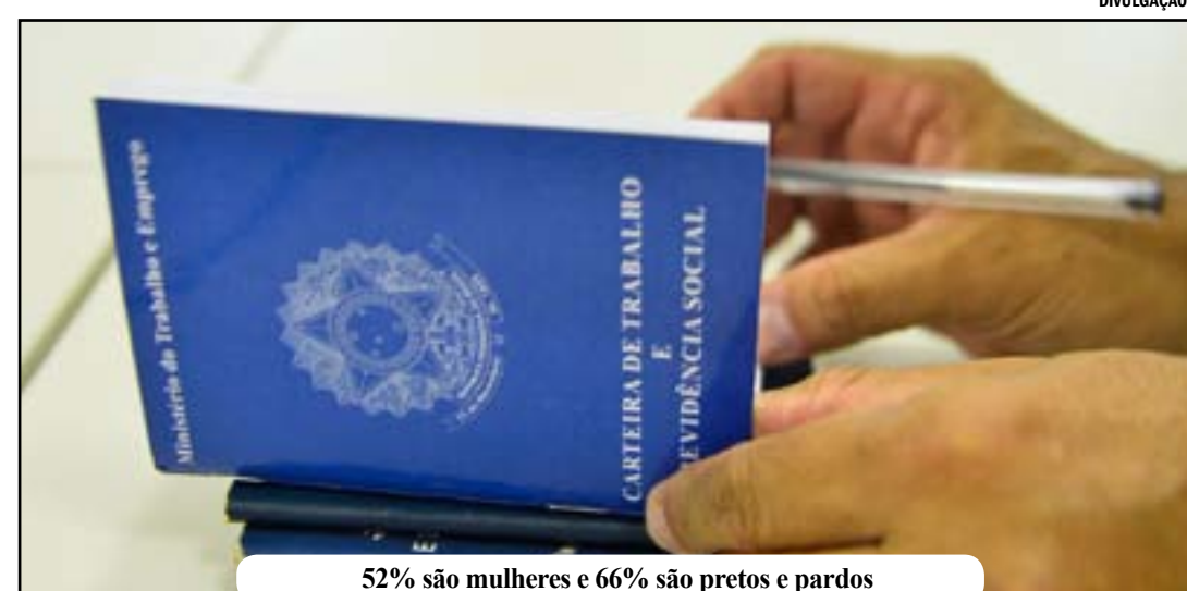
52% são mulheres e 66% são pretos e pardos

Um diagnóstico inédito sobre dados específicos da empregabilidade de jovens no Brasil - feito pela Subsecretaria de Estatísticas e Estudos do Trabalho, do Ministério do Trabalho e Emprego - revela que, dos 207 milhões de habitantes do Brasil, 17% são jovens de 14 a 24 anos, e desses, 5,2 milhões estão desempregados, o que corresponde a 55% das pessoas nessa situação no país, que, no total, chegam a 9,4 milhões.