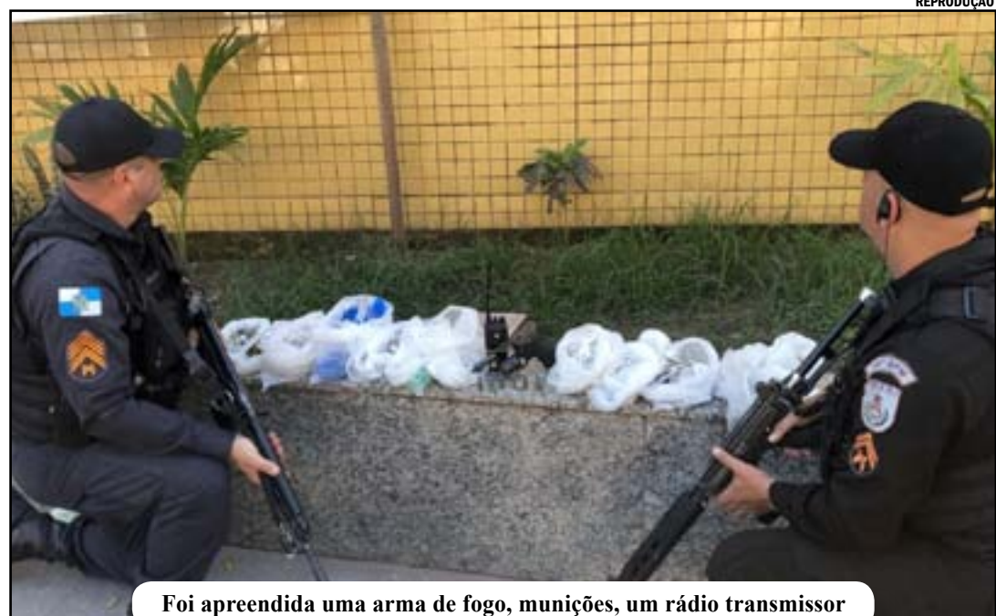
Foi apreendida uma arma de fogo, munições, um rádio transmissor

Segundo o 14º BPM (Bangu), com o suspeito, foram apreendidos uma arma de fogo, munições, um rádio transmissor e fardo material entorpecente.