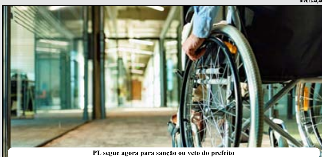
PL segue agora para sanção ou veto do prefeito

Os valores dos ingressos cobrados de pessoas com deficiência em teatros, casas de espetáculos e de shows do Rio deverão sempre corresponder ao dos lugares de menor preço, mesmo que as áreas com acessibilidade se localizem em espaços de maior custo para o público.