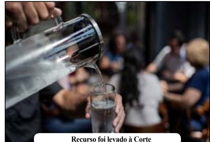
Recurso foi levado à Corte

O recurso foi apresentado à Corte na última semana pela Associação Nacional de Restaurantes contra uma decisão do Tribunal de Justiça do RJ que considerou válida a lei local. Para a associação, a legislação viola princípios