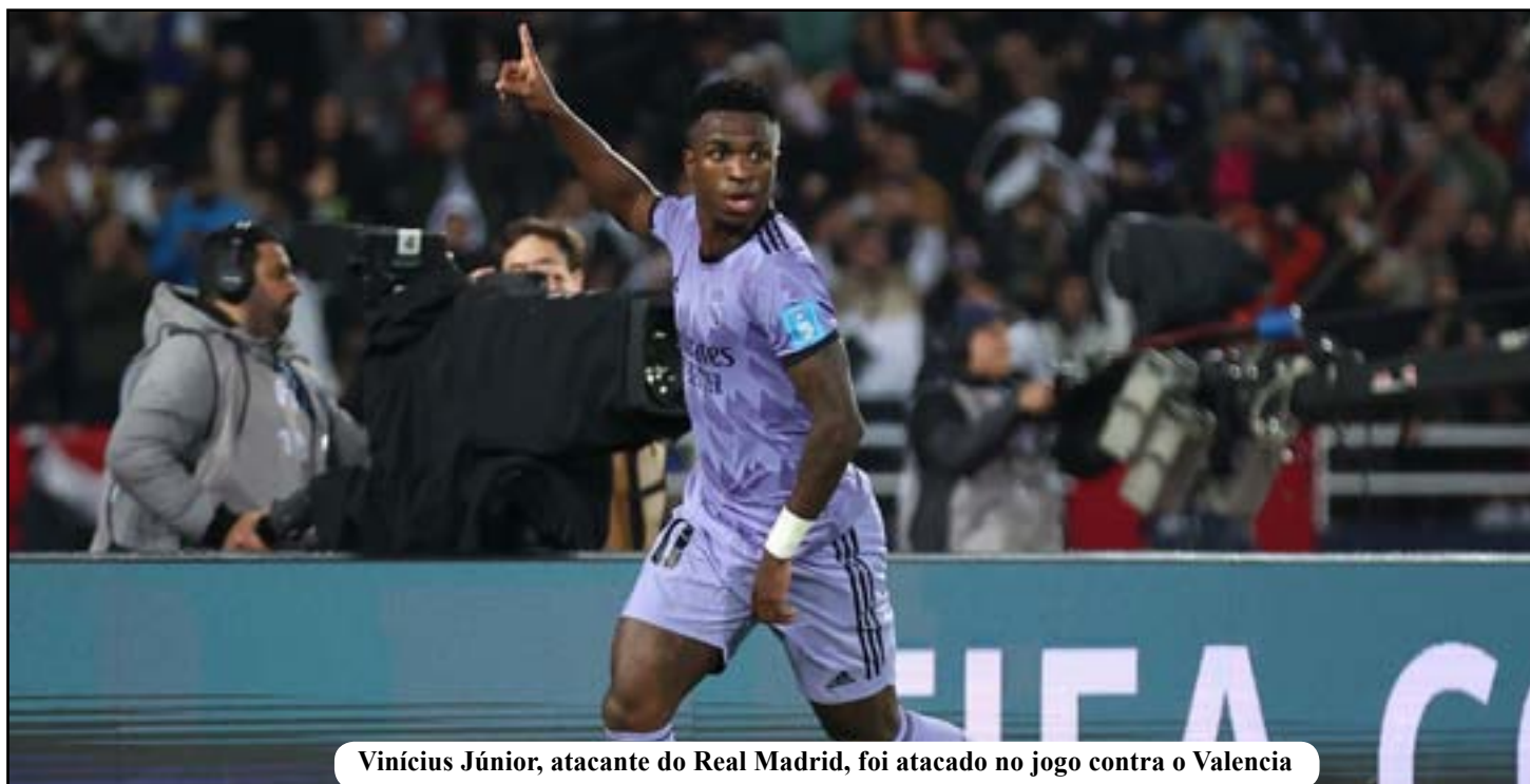
Vinícius Júnior, atacante do Real Madrid, foi atacado no jogo contra o Valencia