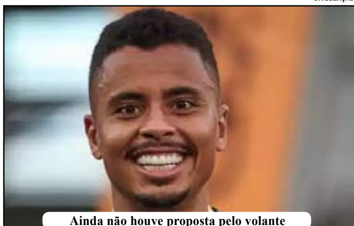
Ainda não houve proposta pelo volante