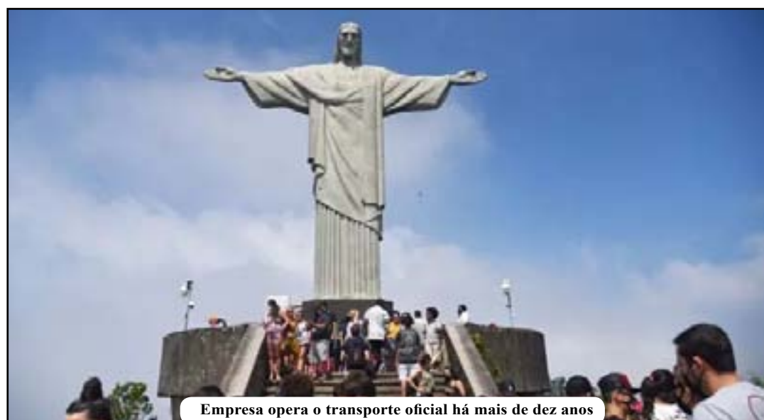
Empresa opera o transporte oficial há mais de dez anos