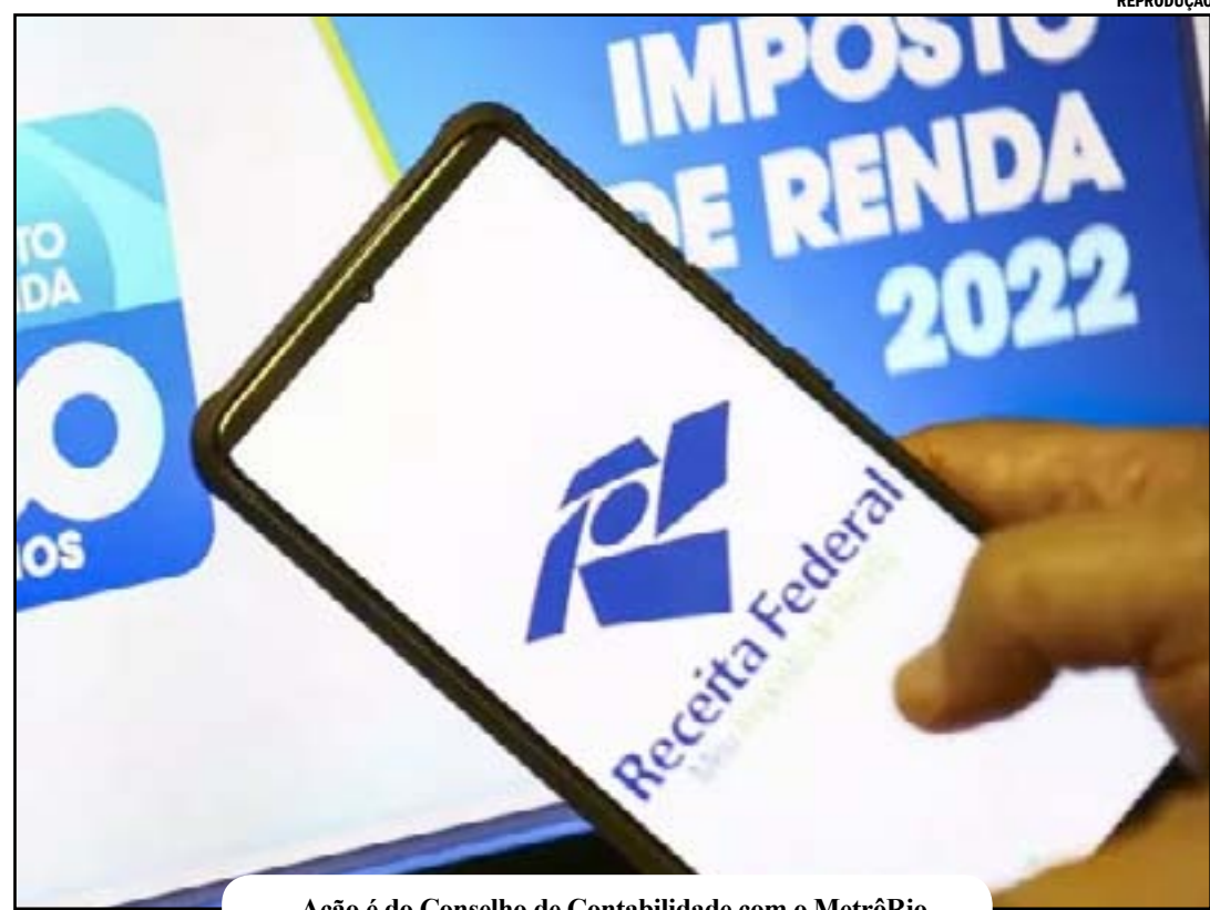
Ação é do Conselho de Contabilidade com o MetrôRio

O CRC-RJ também preparou uma cartilha com as principais informações e dúvidas mais frequentes sobre o assunto. O material será distribuído nos pontos de atendimento e a íntegra está disponível no site ou pelo link: https://bit.ly/cartilhafacilitairpf_2023