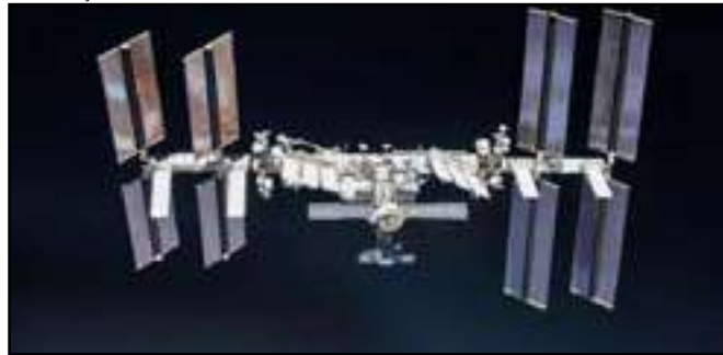
Arma ainda não estaria em fase operacional

O governo dos Estados Unidos afirmou que a Rússia conseguiu desenvolver uma arma anti satélite "preocupante", mas disse que ela não pode causar "destruição física" direta na Terra.