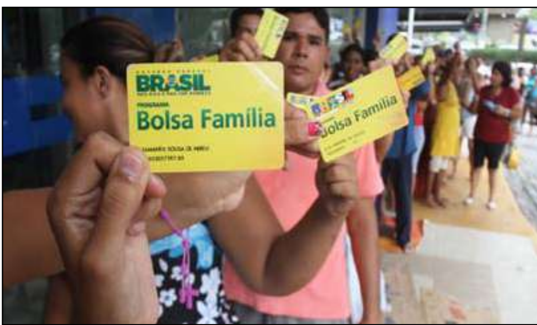
Pagamento unificado será feito nesta sexta-feira

Os recursos chegarão a lares de todos os 92 municípios fluminenses, fruto de um investimento de mais de R$ 1,174 bilhão por parte do Governo Federal. Fevereiro também será marcado pelo pagamento do Auxílio Gás, no valor de R$ 102, que atenderá 522.758 famílias no estado, por meio de repasses federais de R$ 53,321 milhões.