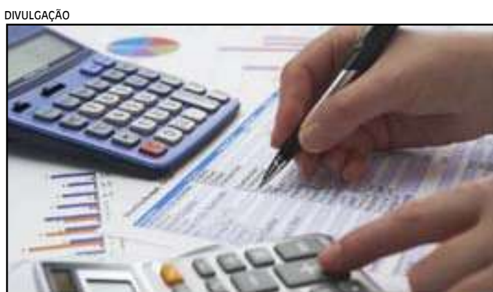
O programa do governo federal já renegociou R$ 35 bilhões em dívidas

Na contramão, os estados de Bahia e Pernambuco dividiram a última posição do ranking com as menores taxas de demissões voluntárias do país, 20,7% cada.