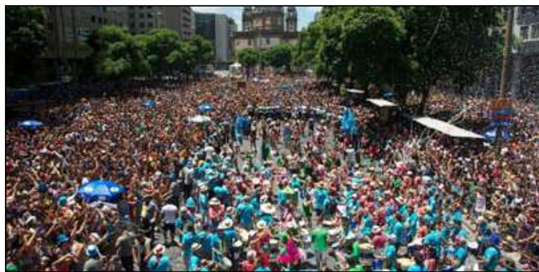
Ideia era preservar patrimônio histórico