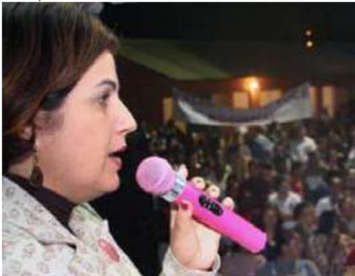
Rosinha Garotinho disse que ainda avalia a possibilidade da candidatura