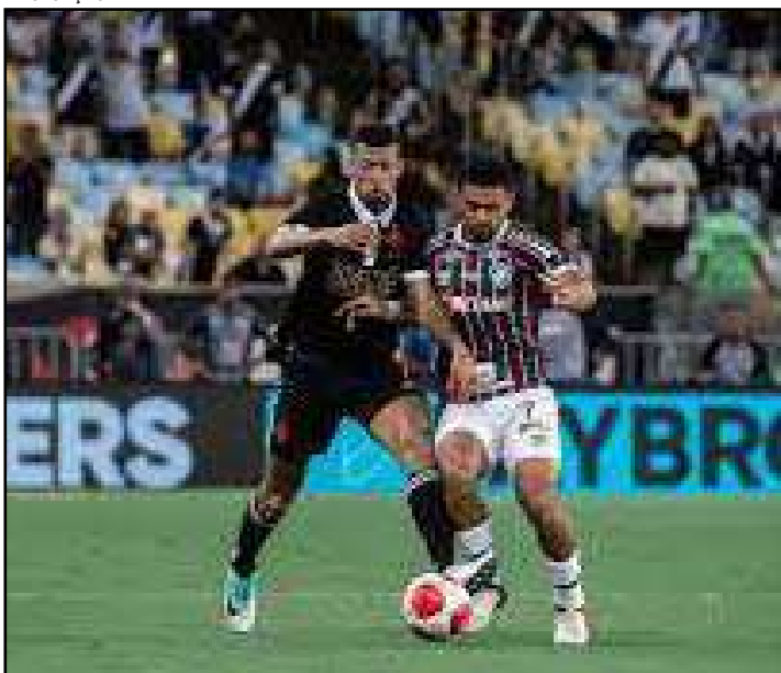
Foram quatro derrotas e cinco empates