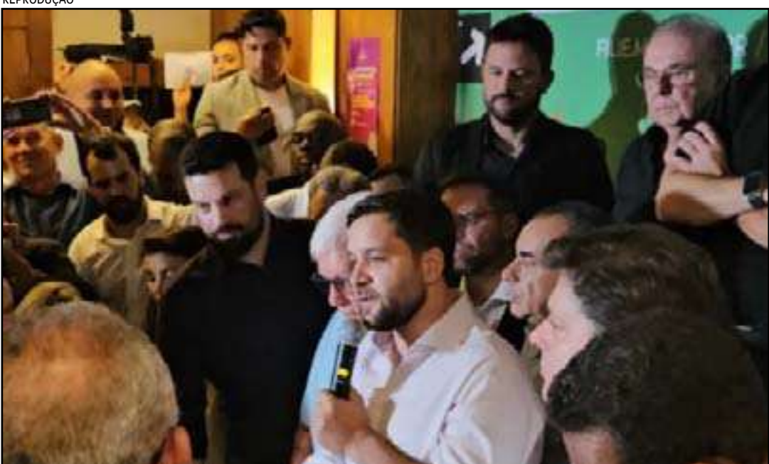
O vice-governador Thiago Pampolha teve calorosa recepção

Ao discursar, Pampolha foi ovacionado pelos novos companheiros de legenda.