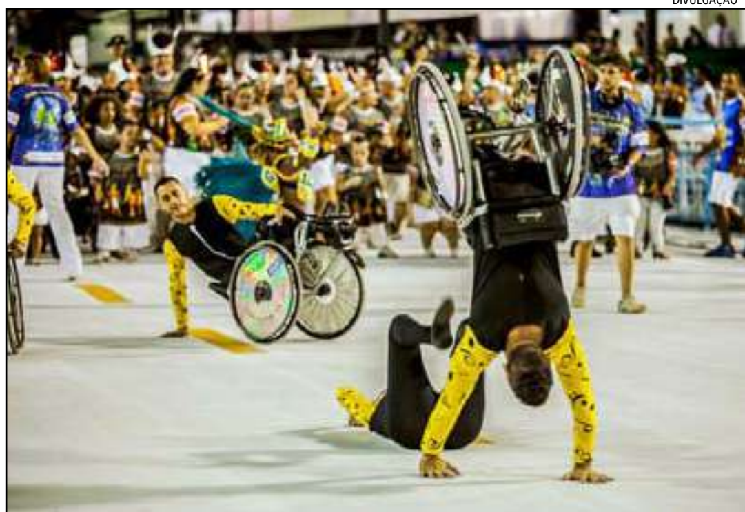
Agremiação abre o Desfile das Campeãs

A escola reúne entre 1,2 mil a 1,4 mil componentes de diferentes instituições do Rio de Janeiro e de outras cidades, como São Paulo, Belo Horizonte e Brasília, que são separados por alas, misturando pessoas com e sem deficiência.