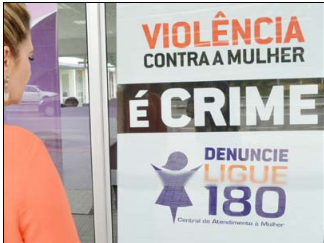
Região Sudeste lidera com 288 mil chamadas

2023 foi marcado pela reestruturação e maior divulgação do Ligue 180 em campanhas de utilidade pública. Outro destaque é que, a partir do mês de abril, o serviço também passou a ter um canal de atendimento exclusivo no WhatsApp. Até dezembro, a opção recebeu 6.689 mensagens com pedidos de informações ou apresentação de denúncias.