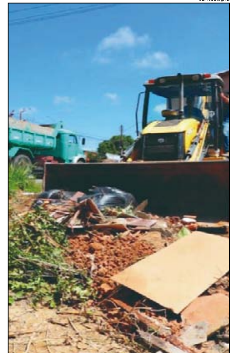
A ação envolveu também máquinas da Prefeitura

O prefeito Irineu Nogueira reforçou que a luta contra a dengue deve ser uma responsabilidade de todos. “A população pode contribuir mantendo em dia a limpeza de calhas, as lixeiras bem tampadas, deixando as garrafas sempre viradas com a boca para baixo, tampar tonéis e caixas d'água, mantendo a limpeza de ralos, não deixando água acumulada e parada em nenhuma ocasião, além de encher os pratos de plantas com areia”, disse.