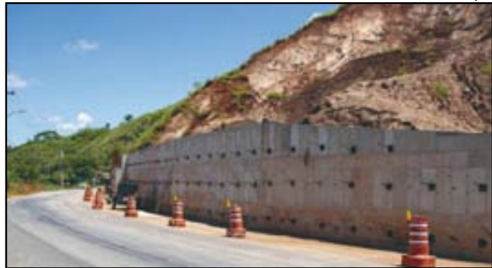
Obra foi motivada por deslizamentos de terra na RJ-145