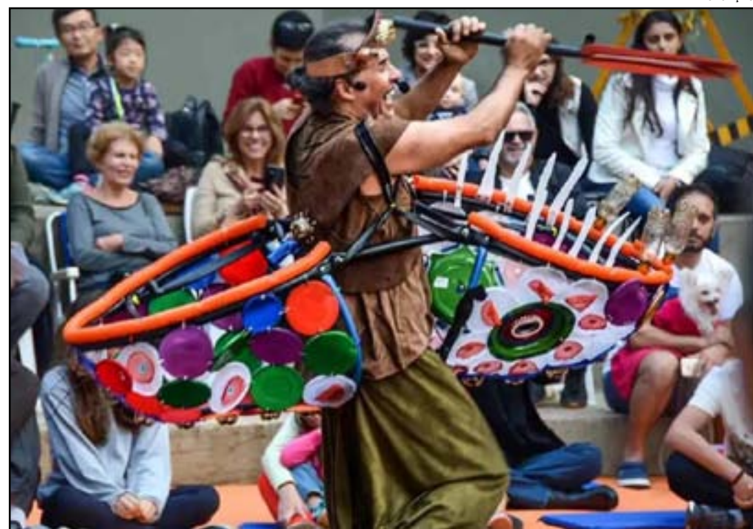
Projeto foi lançado em cerimônia no MAM-RJ

O patrocínio da Petrobras sempre foi um dos mais fortes do setor. A volta dos patrocínios da empresa era aguardada por produtores desde 2019, quando o governo Bolsonaro cortou vários de seus investimentos na área. Projetos com apoios históricos da Petrobras, como o Festival do Rio, a Mostra de Cinema de São Paulo, o Festival de