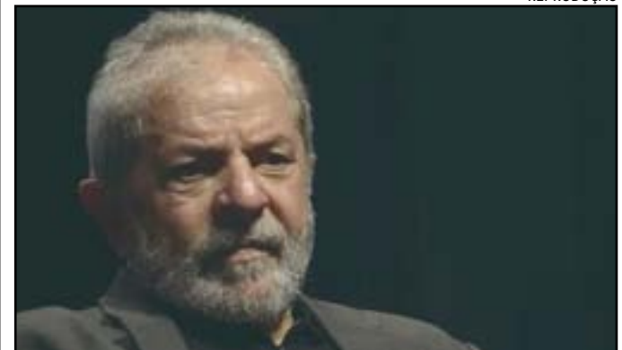
O governo Lula também anunciou que os deputados vão perder verbas de emendas

BRASÍLIA - Integrantes do governo federal informaram aos líderes da Câmara dos Deputados que aqueles que assinaram o pedido de impeachment contra o presidente Lula (PT), devido à sua comparação entre as mortes na Faixa de Gaza e o Holocausto, enfrentarão consequências por parte do Executivo. A notícia foi transmitida pelo líder do governo na Câmara, José Guimarães (PT-CE), durante uma reunião com líderes da base go-