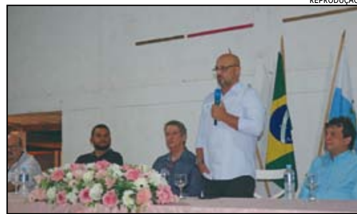
O prefeito Aluísio d'Elías discursou na cerimônia

se. Os cursos foram oferecidos pela Prefeitura, por meio de uma parceria com o SENAI/Firjan de Resende. As aulas tiveram início ainda no ano passado e foram totalmente gratuitas. A cerimônia contou com a participação de 128 alunos formandos entre 9 cursos de qualificação, são