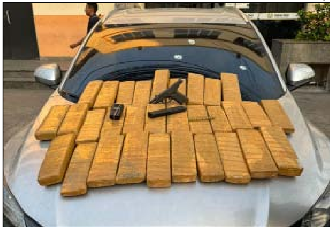
Três pistolas e cerca de R$ 300 mil em drogas foram apreendidos