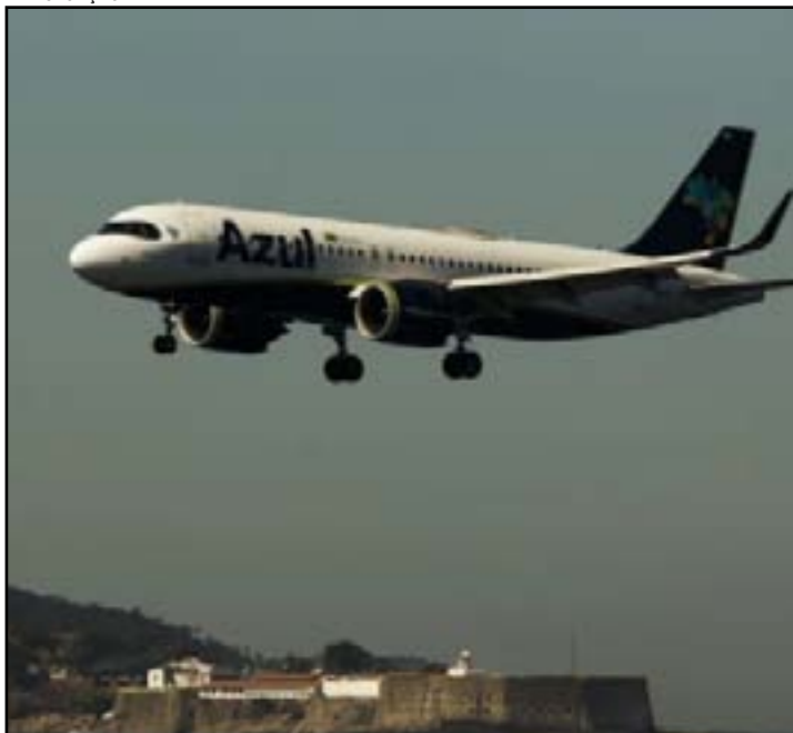
A redução foi maior nas passagens entre Rio e São Paulo

Um levantamento da Agência Nacional de Aviação Civil (Anac) sobre o preço das passagens aéreas em 2023 revela que a tarifa média cobrada pelas aéreas durante o ano passado foi de R$ 636, um valor 3,9% menor que o registrado em 2022.