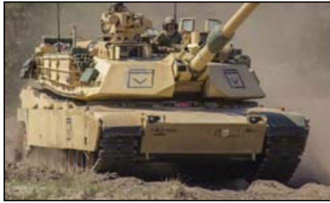
Governo se opõe a qualquer destacamento na Ucrânia

Os Estados Unidos não enviarão tropas para lutar na Ucrânia, afirmou a Casa Branca, depois de o presidente francês, Emmanuel Macron, não descartar essa ideia.