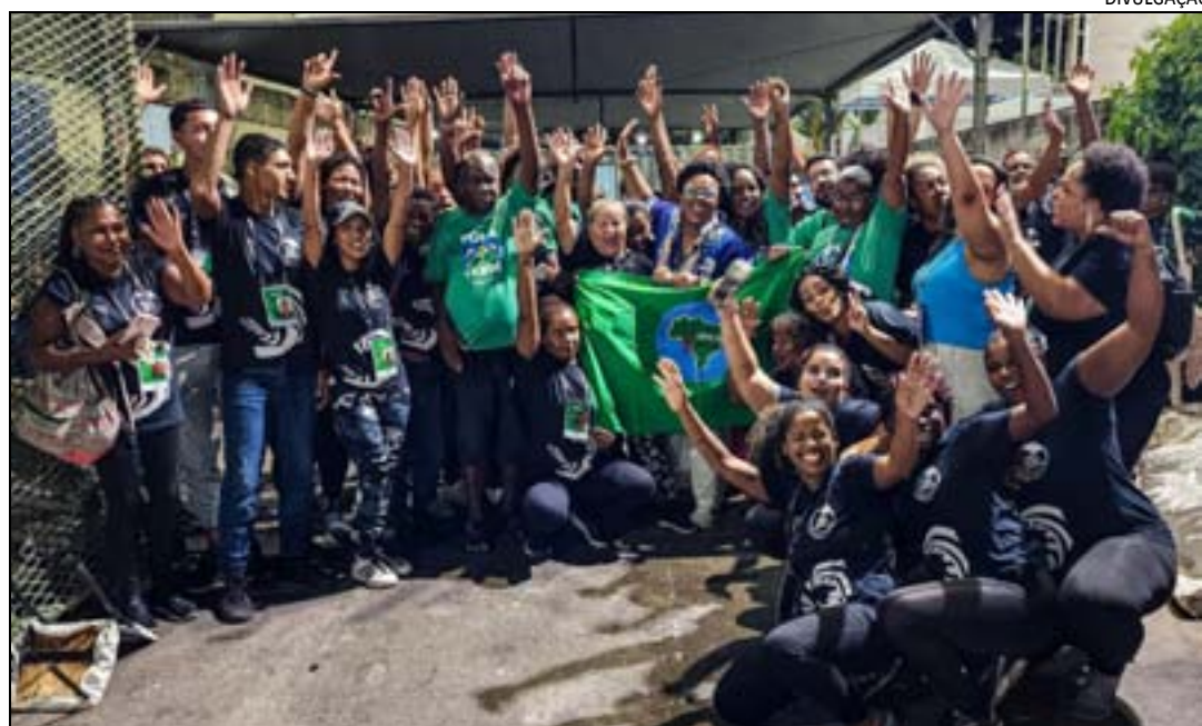
Ações foram realizadas em datas específicas

Já na Intendente Magalhães, as ações ocorreram durante os dias 11, 12 e 13 de fevereiro, durante as apresentações do Grupo de avaliação e na 1ª noite da Série Prata e Bronze. Nos blocos de rua, os catadores do programa trabalharam de 09 a 13 de fevereiro, em 18 dos 35 blocos planejados.