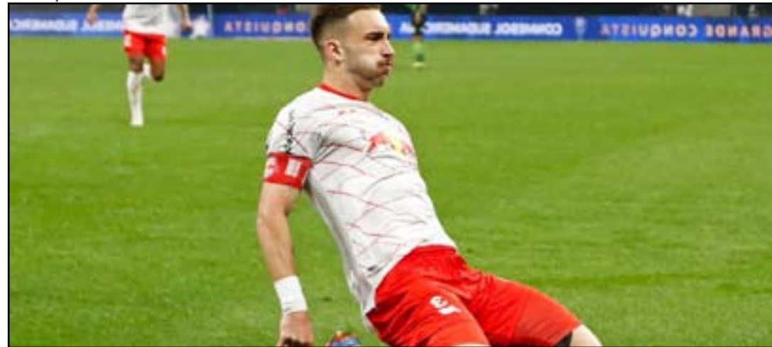
Clube concordou em negociar o jogador por 8,5 milhões