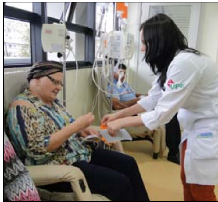
São esperados 704 mil novos casos anuais

Um dos destaques apresentados foi o Código Latino-Americano e Caribeño contra o Câncer (LAC Code), que elenca medidas de prevenção que devem ser acompanhadas pelas pessoas e orientações a ser seguidas por autoridades, como políticas de rastreio da doença e aplicação de vacinas, como no caso do HPV (vírus do papiloma humano, causador do câncer de colo de útero).