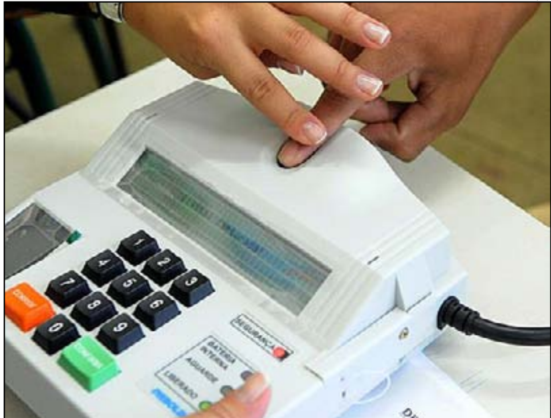
Ação faz parte da campanha “Vem Pra Biometria”

Para efetuar o cadastro biométrico, é necessário apresentar um documento oficial com foto e um comprovante de residência durante o atendimento. Além disso, os eleitores têm a opção de realizar o procedimento em uma das 165 zonas eleitorais ou nas 18 Centrais de Atendimento ao Eleitor (CAEs), que operam de segunda