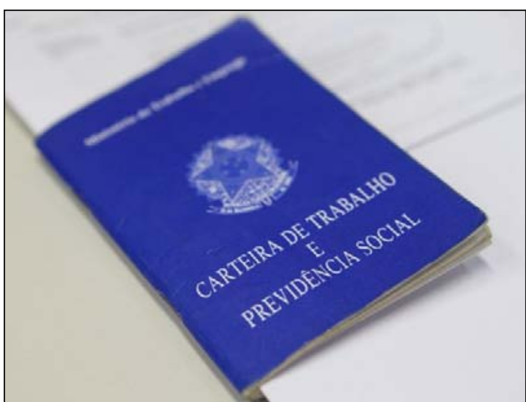
Serão oferecidas cerca de 4 mil vagas

Os candidatos podem se inscrever de forma online. Basta se habilitar às oportunidades disponíveis, no seguinte link: bit.ly/Cadastro_Curriculo_SMTE . Importante destacar que não é mais necessário o uso de código para o preenchimento do formulário.