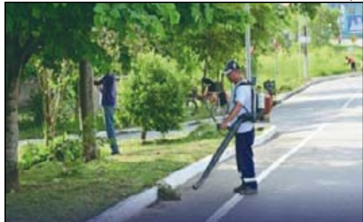
As equipes realizaram os serviços de limpeza, roçada e retirada de entulhos