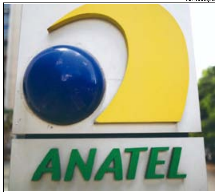
A agência está se preparando para cumprir as decisões da Justiça Eleitoral

de sites que divulguem fake news durante as eleições.