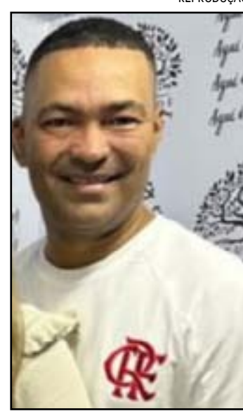
Homem atuava na Operação Segurança Presente

O PM estava na corporação havia 24 anos. Ele atuava na Operação Segurança Presente Laranjeiras. Deixa esposa e filha. O caso foi registrado inicialmente na 27ª DP (Vicente de Carvalho), apenas na calçada.