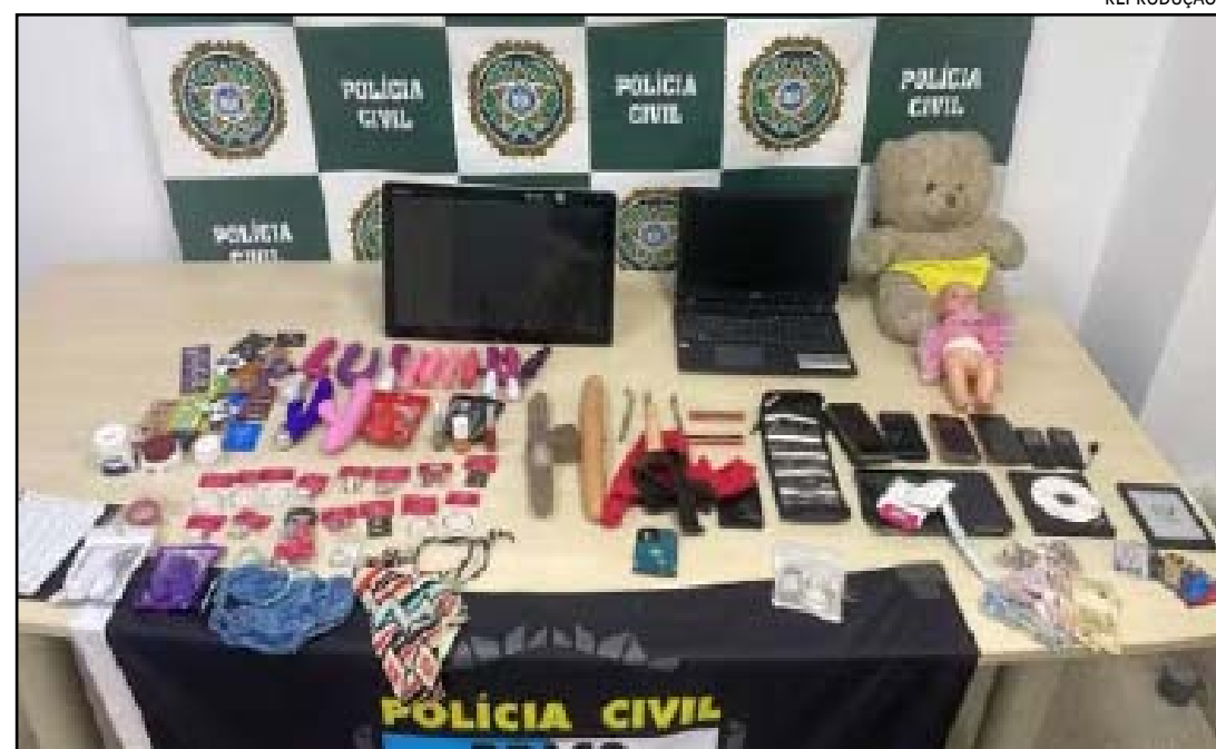
Material encontrado na casa de Rainer

Ainda segundo Amin, apenas a hipótese de latrocínio foi descartada até o momento. Ele destacou ainda que, caso fique comprovado que a motivação da execução tem relação com a advocacia, o crime será investigado como sendo um ataque ao estado democrático de direito.