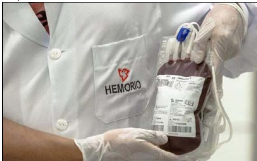
Ação acontece na próxima sexta-feira

O Hospital Municipal Miguel Couto (HMMC) promove na sexta-feira (1), das 9h às 15h, uma campanha de doação de sangue. A ação, que vai acontecer no hall de entrada, é uma parceria entre a unidade e o Hemorio, responsável por fornecer hemoderivados para mais de 200 hospitais da rede pública do Rio de Janeiro, principalmente para emergências.