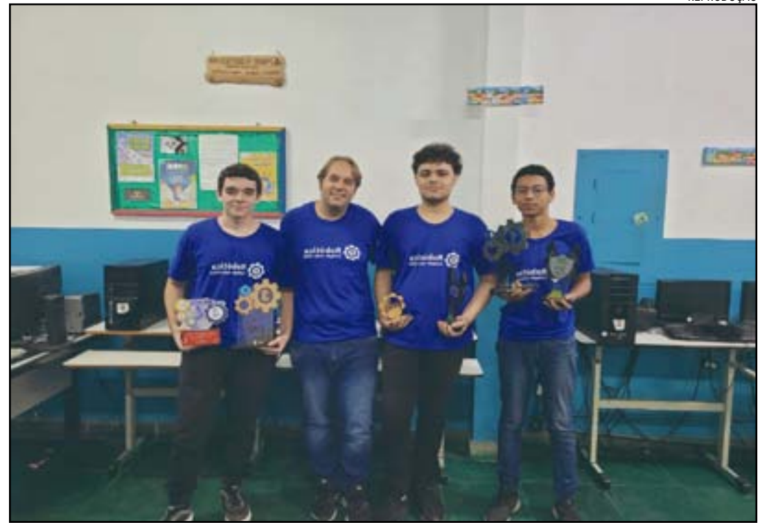
Alunos são integrantes da equipe de Robótica do Colégio João XXIII

“Nossas expectativas são aprimorar ainda mais o