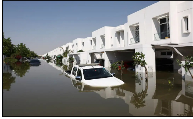
Tempestade atingiu Omã no fim de semana

As mortes causadas pelas fortes chuvas desta semana nos Emirados Árabes Unidos subiram para quatro, informaram as autoridades, além de inundar estradas e congestionar o Aeroporto Internacional de Dubai.