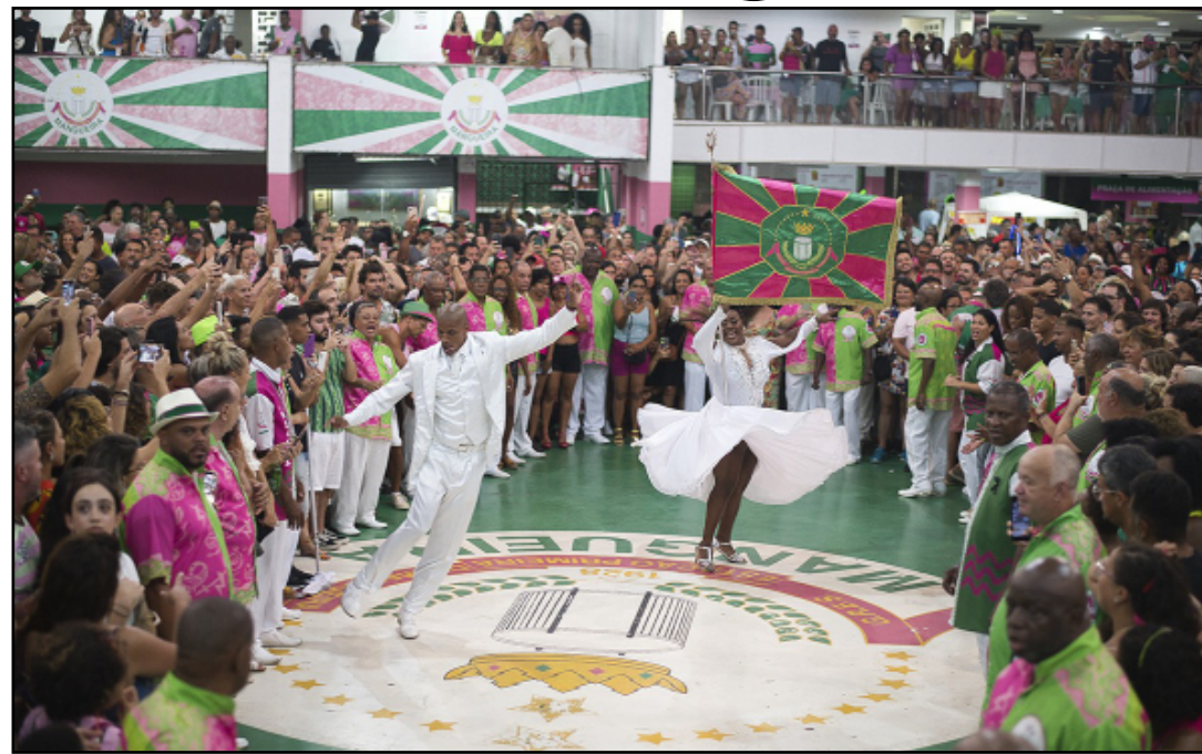
Diversas atividades estão no calendário da festa

E a festa continua durante todo o final de semana. No sábado (27) o Samba de Volta chega pela primeira vez à quadra da Estação Primeira para homenagear a dona da casa a partir das 18h. Tocan-