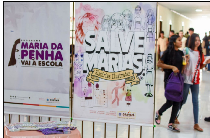
Lei determina inclusão de noções sobre proteção à mulher

É o que estabelece a Lei 10.344/24, que foi aprovada pela Assembleia Legislativa do Estado do Rio de Janeiro (Alerj), sancionada pelo governador Cláudio Castro e publicada no Diário Oficial. A