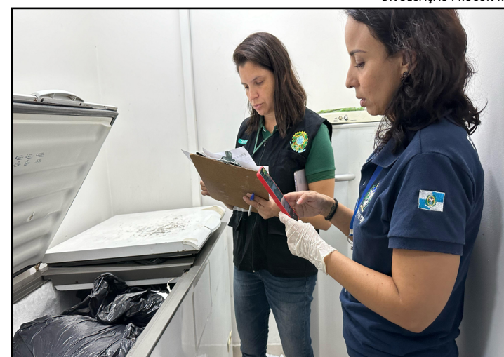
Cinco cl nicas veterin rias s o autuadas pelo Procon-RJ