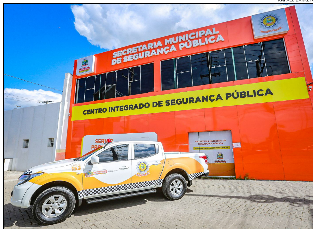
A nova viatura (modelo L200 Triton) ir  refor ar a frota utilizada pela GM