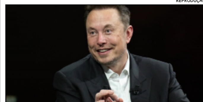
Elon Musk teria cometido sérias violações contra o Estado

BRÁSILIA - A Defensoria Pública da União (DPU) iniciou um processo na Justiça Federal da 1ª Região exigindo que a rede social X (antigo Twitter) pague uma indenização no valor de R$ 1 bilhão por danos morais coletivos e sociais infligidos ao Brasil, informa Mônica Bergamo, na Folha de S.Paulo.