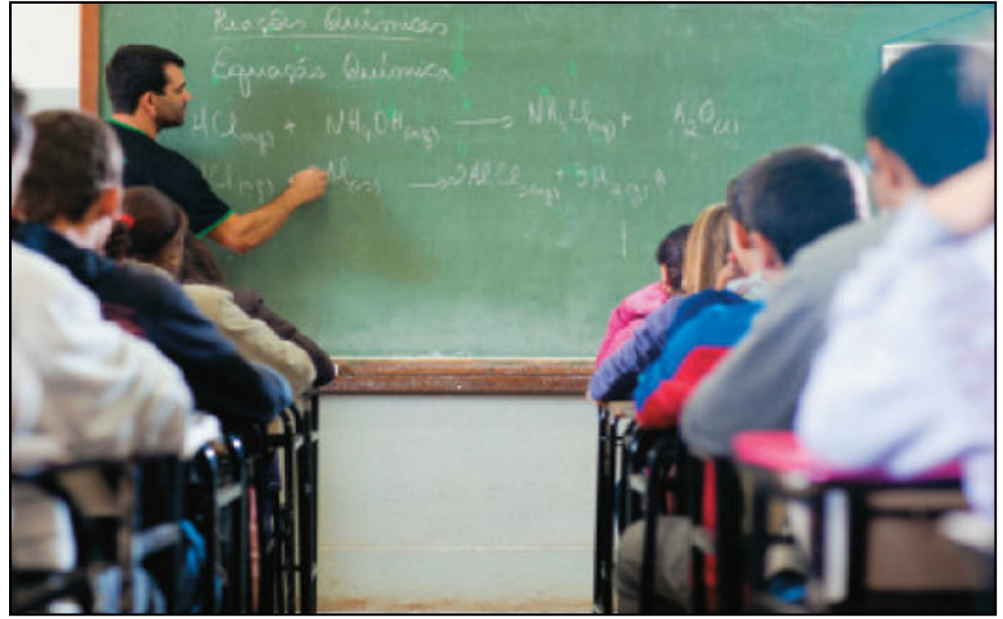
Categorias estão em greve em boa parte do país

Para 2024, o Governo já havia formalizado, para todos os servidores fede-