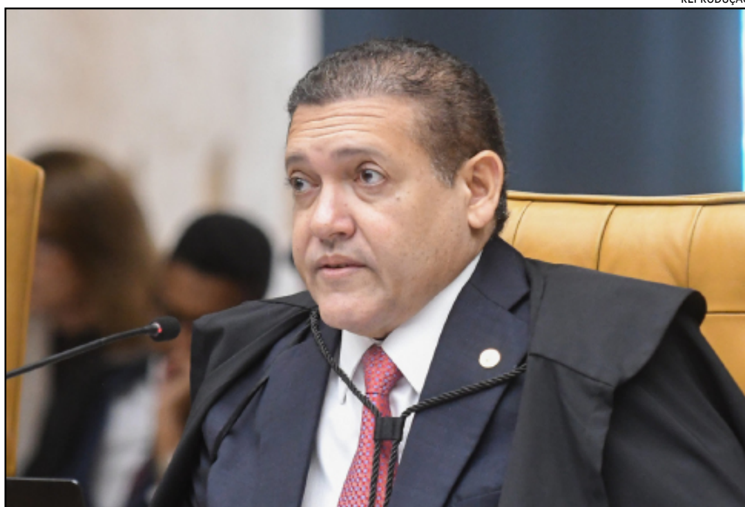
Decisão do ministro Kassio Nunes Marques será analisado pela Corte

Na Polícia Federal, responsável por um relatório utilizado na Operação Calígula, a revogação da tornozeleira também foi recebida com perplexidade. Um membro da corporação comentou: “Perderam a vergonha”.