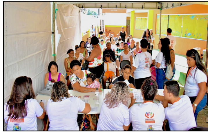
O Cidadania em Ao ofereceu diversos servios como iseno para a segunda via de documentos

A  ltima sexta-feira (19) foi produtiva para os moradores do Bairro Jardim Gl ucia, em Belford Roxo. Atrav s do Programa Cidadania em Ao da Secretaria Municipal de Assist ncia Social, Cidadania e Combate   Fome (Semascf), a prefeitura levou uma s rie de servios para perto das fam lias daquela regi o. O evento, que tem a parceria da Fundao de Desenvolvimento Social de Belford Roxo (Funbel), aconteceu das 9h  s 13h, nas depend ncias da Creche  lvoro Cardoso (Alvinho), localizada na Rua Dem stenes, 138. Cerca de 750 pessoas passaram por l  e foram atendidas.