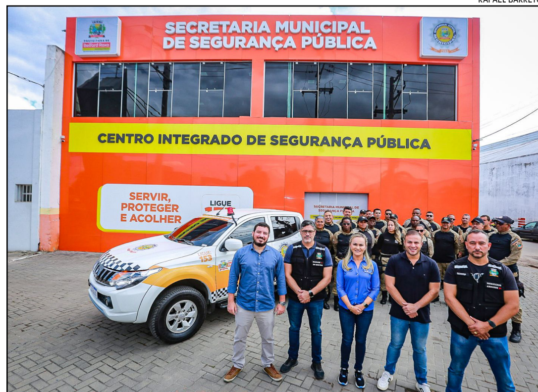
A deputada federal com integrantes da Secretaria Municipal de Segurana e dos secret rios