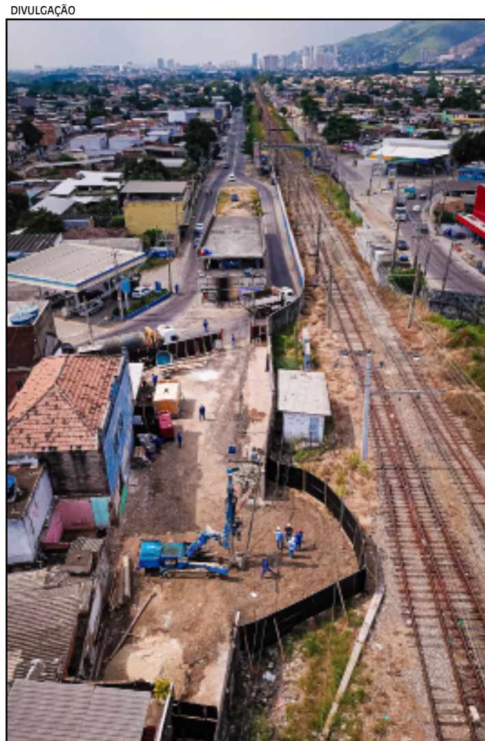
Viaduto vai receber cerca de 3,5 mil veículos por dia

Após ficar quatro anos paradas, as obras do Viaduto de Comendador Soares foram retomadas pela Prefeitura de Nova Iguaçu. O retorno foi possível após acordo administrativo com famílias de 13 residências e com a decisão judicial com outros dois proprietários.