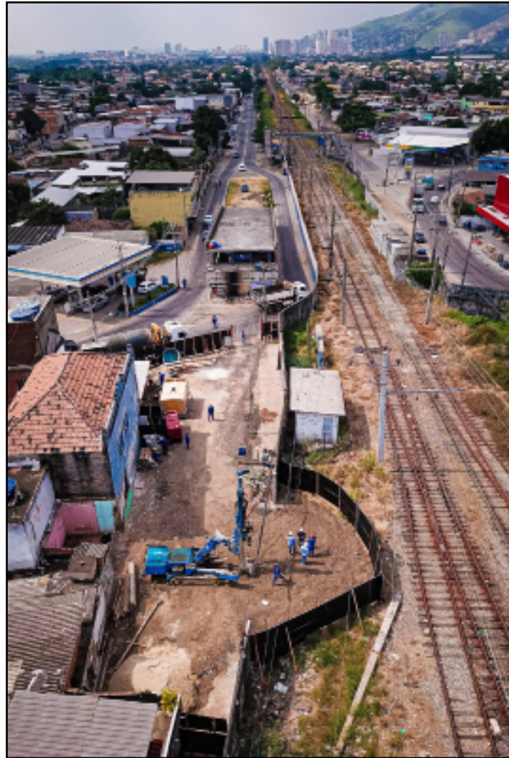
Viaduto vai receber cerca de 3,5 mil veículos por dia

Após ficar quatro anos paradas, as obras do Viaduto de Comendador Soares foram retomadas pela Prefeitura de Nova Iguaçu. O retorno foi possível após acordo administrativo com famílias de 13 residências e com a decisão judicial com outros dois proprietários.