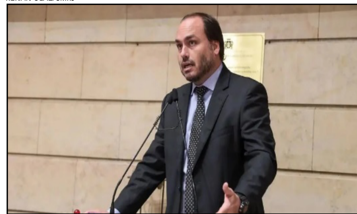
Proposta polêmica de Carlos Bolsonaro visa impedir inclusão de dietas saudáveis nas escolas

O vereador Carlos Bolsonaro (PL) apresentou um projeto de lei na Câmara dos Vereadores do Rio de Janeiro que pretende proibir a presença de cardápios vegetarianos e veganos em escolas públicas da cidade, além de impedir funcionários da educação de debaterem o tema, em qual-