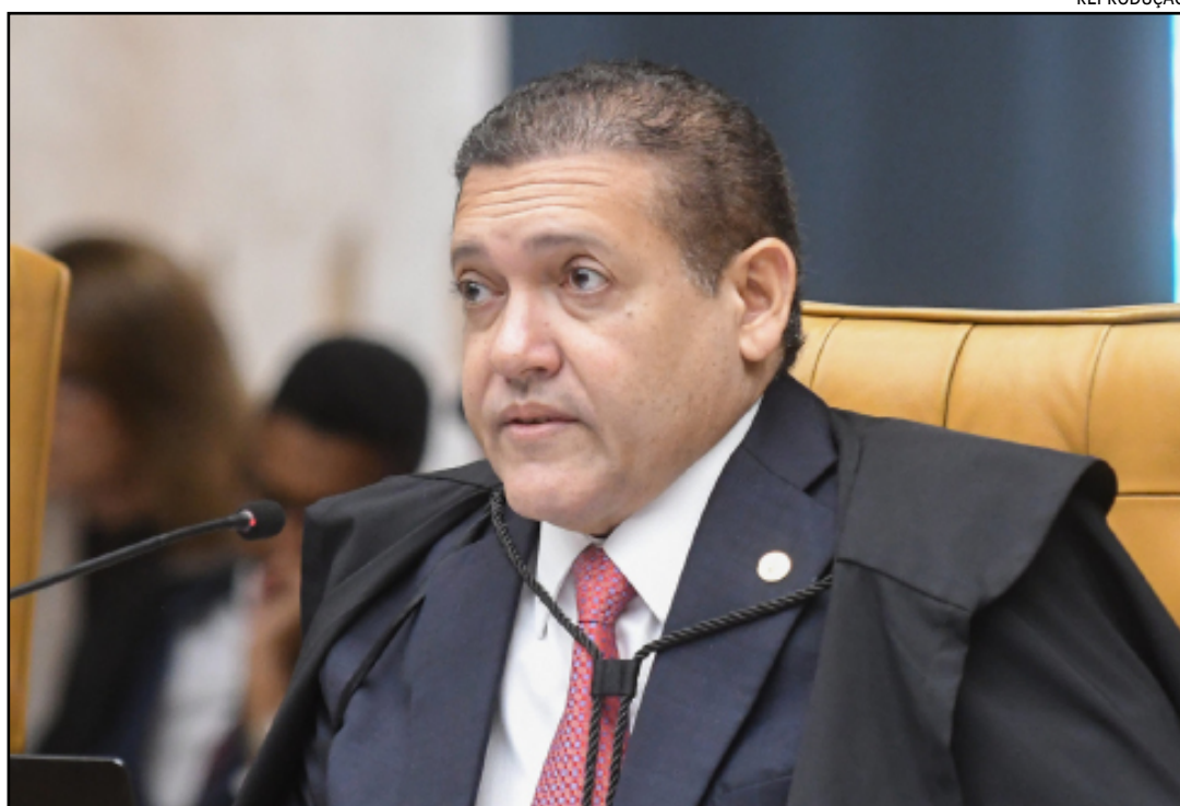
Decisão do ministro Kassio Nunes Marques será analisado pela Corte

Na Polícia Federal, responsável por um relatório utilizado na Operação Calígula, a revogação da tornozeleira também foi recebida com perplexidade. Um membro da corporação comentou: “Perderam a vergonha”.