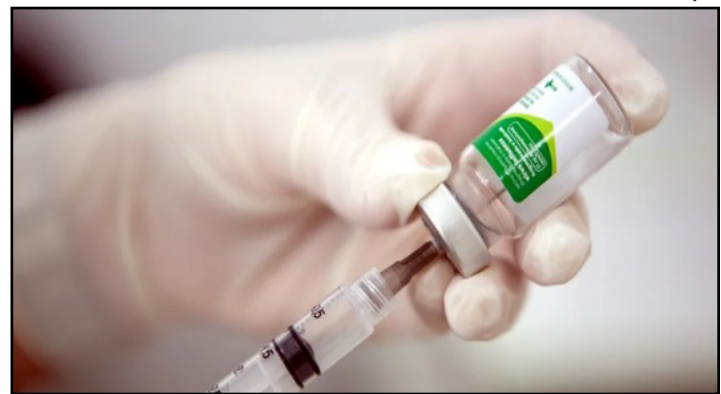
Meta do Ministério da Saúde é imunizar 75 milhões de brasileiros