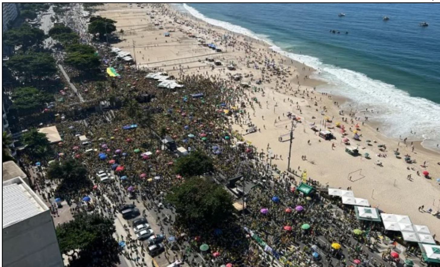
Manifestação reuniu em Copacabana políticos aliados e eleitores que apoiam Bolsonaro

Ao longo do discurso, Bolsonaro continuou atacando a atual gestão. “Ainda têm a desfaçatez de dizer que salvaram o Brasil de uma ditadura. Elegeram o cara que é amante da ditadura, que é amante do falecido Fidel Castro, que venera o ditador Nicolás Maduro e que está agora ao lado do Irã. Mais ainda, que estiveram ao lado do Hamas. Isso é democracia? Mais do que interferir, querem no calar,