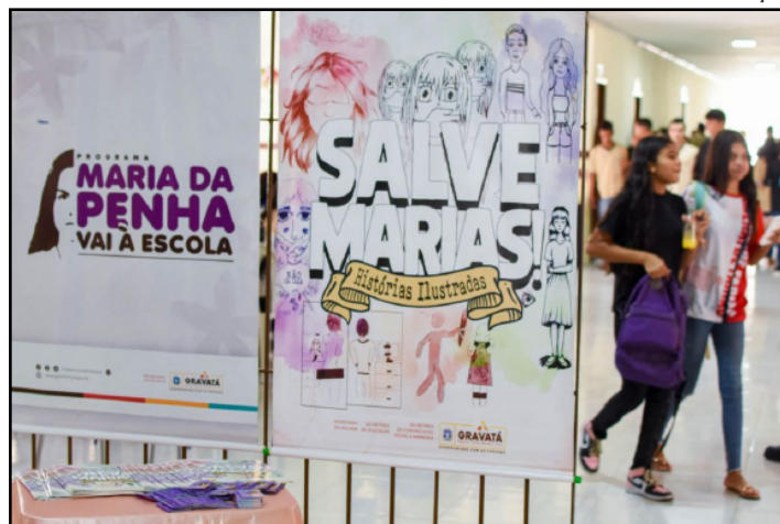
Lei determina inclusão de noções sobre proteção à mulher

É o que estabelece a Lei 10.344/24, que foi aprovada pela Assembleia Legislativa do Estado do Rio de Janeiro (Alerj), sancionada pelo governador Cláudio Castro e publicada no Diário Oficial. A