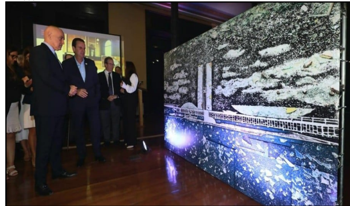
Paes e Moraes observam uma imagem da primeira peça que vai compor a exposição: a reprodução fotográfica “8 de Janeiro”, do artista Vik Muniz

A Prefeitura do Rio e o Tribunal Superior Eleitoral estabeleceram uma parceria para a criação do Museu da Democracia da Justiça Eleitoral. O museu funcionará no prédio do atual Centro Cultural do TSE e terá sua concepção feita pela Fundação Getúlio Vargas.