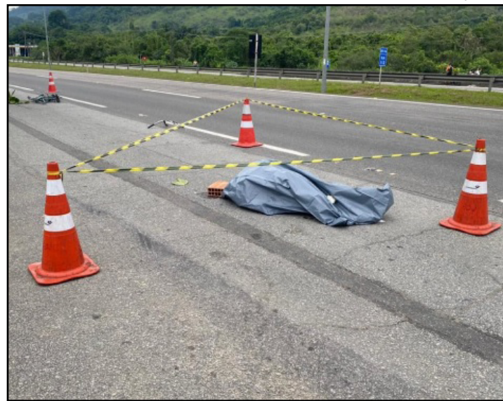
A vítima, de 41 anos, morreu no local