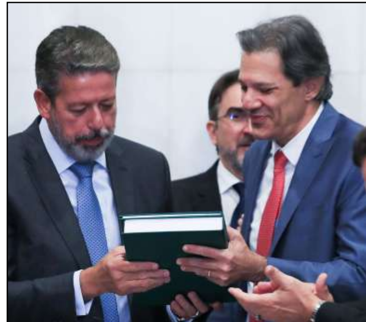
Ministro Haddad entregou projeto de lei complementar ao Congresso

Quatro meses após a promulgação da reforma tributária, o governo enviou o primeiro projeto de lei complementar com a regulamentação dos tributos sobre o consumo. O ministro da Fazenda, Fernando Haddad, entregou a proposta ao presidente da Câmara dos Deputados, Arthur Lira (PP-AL), no início da noite da última quarta-feira (24).