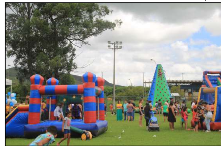
Jardim Manchete irá sediar a 4ª edição ‘Direito de Ser Criança’