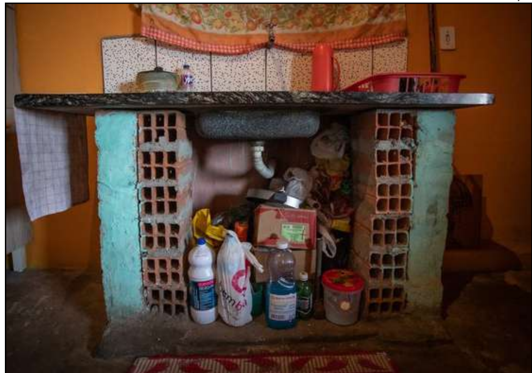
IBGE foi o responsável pelo levantamento

A proporção de domicílios fluminenses em insegurança alimentar moderada ou grave era de 5,1% em 2013. Em 2018, subiu para 10,2%. Em percentu-