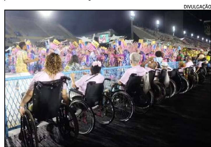
Multa será de R$ 5 mil aos organizadores de eventos

zo de seis meses a partir da data de vigência da lei para se adequarem às exigências de acessibilidade estabelecidas. O Poder Executivo ainda vai regulamentar a norma.