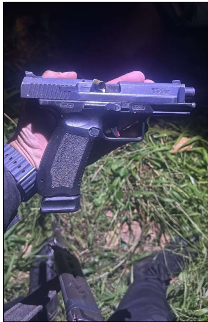
Pistola apreendida pelos policiais

Dois criminosos ficaram feridos durante confronto com policiais militares do 20º BPM (Queimados), no Morro do Sião, no distrito de Engenheiro Pedreira, em Japeri, na Baixada Fluminense.