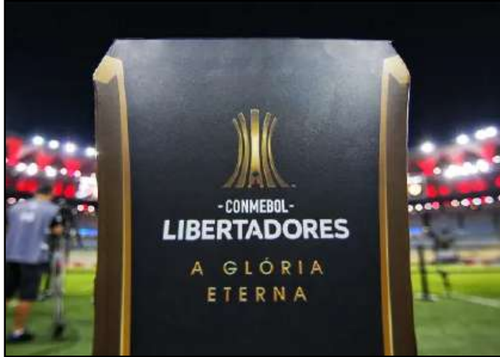
O Flamengo ocupa a segunda colocação na tabela

A Conmebol tomou a decisão de mudar o local da partida entre Flamengo e Palestino