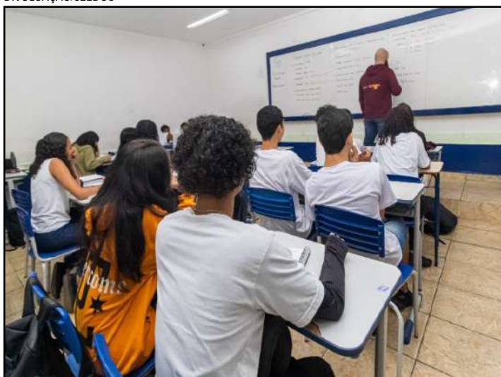
Ações do Comitê Intersetorial de Segurança Escolar surte efeito

Quase um ano após a criação do Comitê Intersetorial de Segurança Escolar (Cise) o número de notificações de ameaças de ataques às escolas teve redução de 98% no segun-