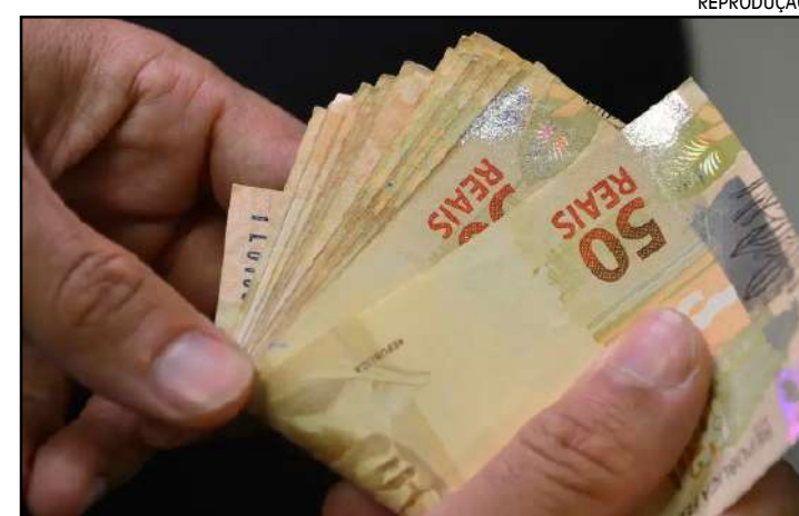
Cashback beneficiará famílias de baixa renda ou de programas sociais

A regulamentação do cashback estabeleceu que a