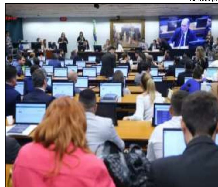
Em nove meses, a unidade realizou mais de 650 mil diagnósticos

das pelo TCE foram apontadas durante auditoria realizada pela Secretaria-Geral de Controle Externo, entre 1º de janeiro de 2021 e 31 de dezembro de 2022, divididas entre 40 dispensas de licitação (R$ 292.245.413,34) e 12 pregões (R$ 115.087.318,44).