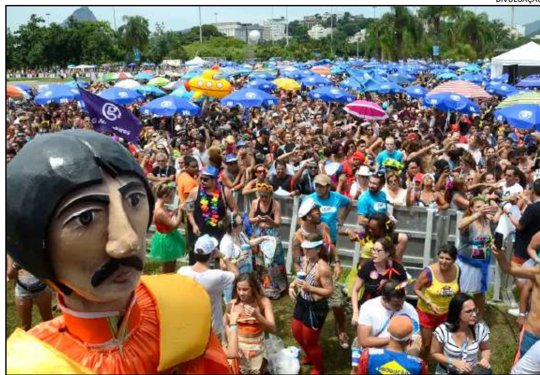
Blocos refletem a diversidade cultural do país

Para a relatora do projeto, senadora Augusta Brito (PT-CE), os blocos e bandas de carnaval são manifestações que “refletem a grandeza de nossa diversidade cultural”. Em seu relatório ela citou o Mela-Mela, em cidades do Nordeste, como Beberibe e Camocim, no Ceará; os