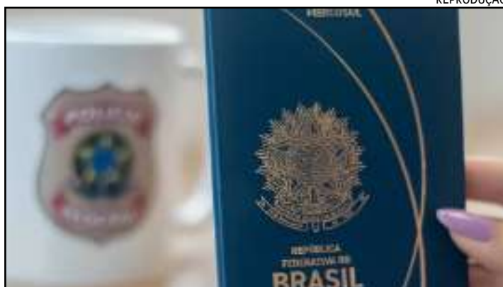
A PF informou que atualizou o sistema, restabelecendo o serviço

O agendamento para dar início aos procedimentos para emissão do documento de viagem podem ser solicitados na página da Divisão de Passaporte da Polícia Fe-