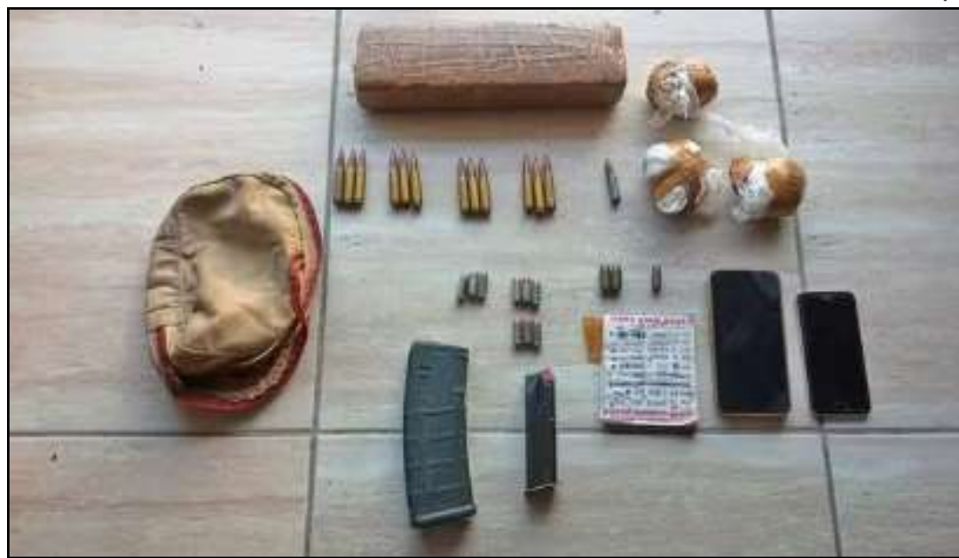
Armas e drogas foram apreendidas na casa de um dos PMs alvos da ação

Outro denunciado é um homem que se passa-