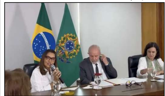
A primeira-dama Janja Lula da Silva, o presidente Lula e a

BRASÍLIA - A primeira-dama Rosângela Lula da Silva, a Janja, cobrou “violência zero” contra mulheres durante a solenidade de sanção da lei 2.221 de 2023 pelo presidente Luiz Inácio Lula da Silva (PT), ontem (25).