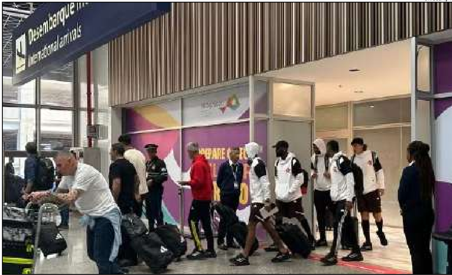
O Flamengo volta a jogar pela Libertadores no próximo dia 7, contra o Palestino, no Chile

O melhor resultado para os rubro-negros seria o do empate. Se o Millonarios vencer por um gol, o Fla segue na vice-liderança pelo saldo. Se o Palestino ganhar, o Rubro-Negro também fica no segundo lugar.