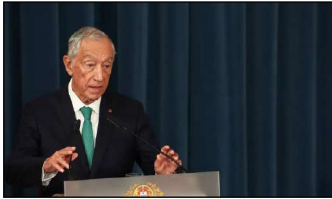
Portugal foi responsável por crimes na era colonial

O presidente português, Marcelo Rebelo de Sousa, disse que Portugal foi responsável por crimes cometidos durante a escravidão transatlântica e a era colonial, e sugeriu a necessidade de reparações.