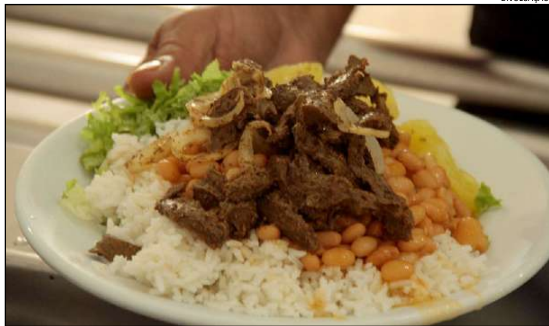
Mais de 20 milhões de pessoas convivem com o problema

Já a insegurança alimentar moderada atinge 4,2 milhões de famílias (11,9 milhões de pessoas) e demonstra redução quantitativa de alimentos entre os adultos e/ou ruptura nos padrões de alimentação resultante da falta de alimentos entre os