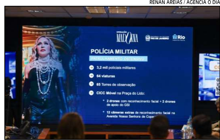
O plano operacional foi divulgado pela prefeitura e Governo do RJ no Centro de Operações Rio

Foi anunciado, ainda, que para aqueles que preferirem evitar a multidão e ouvir o show haverá torres de som atrás do palco que está sendo montado em frente ao Copa-