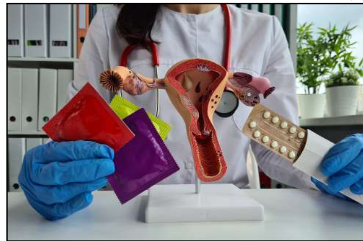
Campanha deverá ser feita em unidades públicas de saúde

A campanha deverá ser feita em unidades públicas de saúde do atendimento básico e unidades de saúde da rede privada, tendo como foco as pacientes do sexo feminino a partir dos 16 anos de idade; nas escolas da rede pública, tendo como foco os adolescentes a partir do segundo ano do ensino médio, podendo ser extensivo às mães ou as responsáveis legais dos alunos matriculados, e nas instituições públicas e empresas contratadas pelo po-