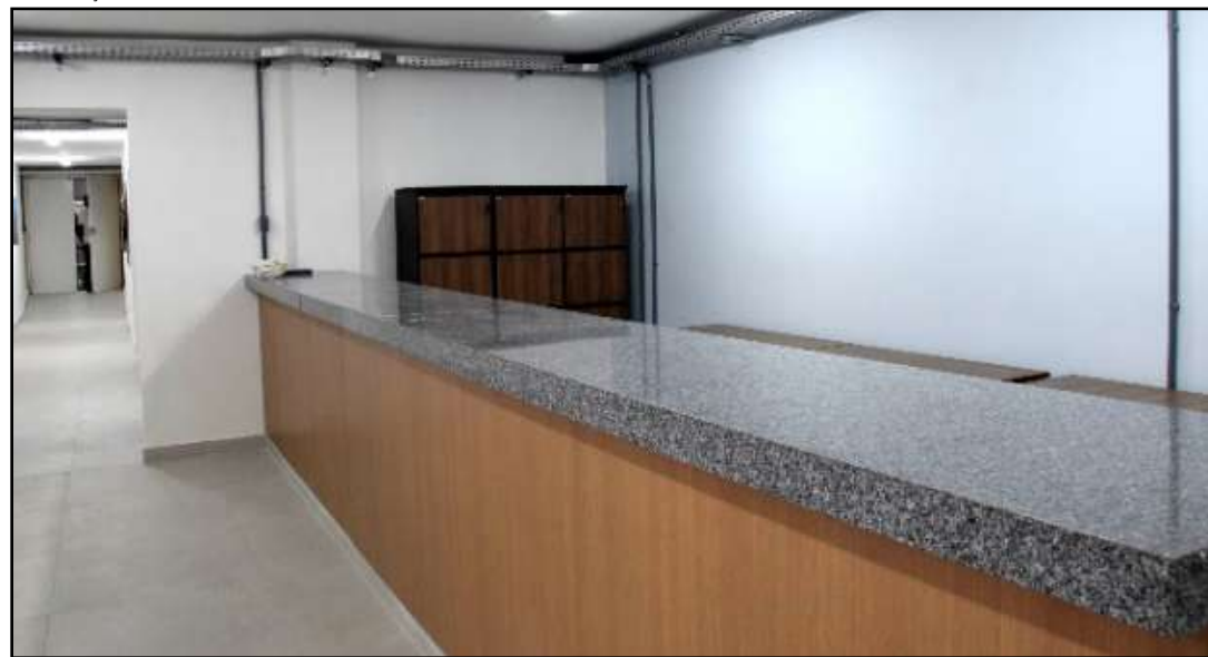
Setor da administração passou por diversas melhorias

A Prefeitura de Resende entregou mais um espaço renovado para a população, com a entrega das obras de revitalização da Secretaria Municipal de Saúde, que fica no pátio administrativo da Prefeitura, no bairro Ja-