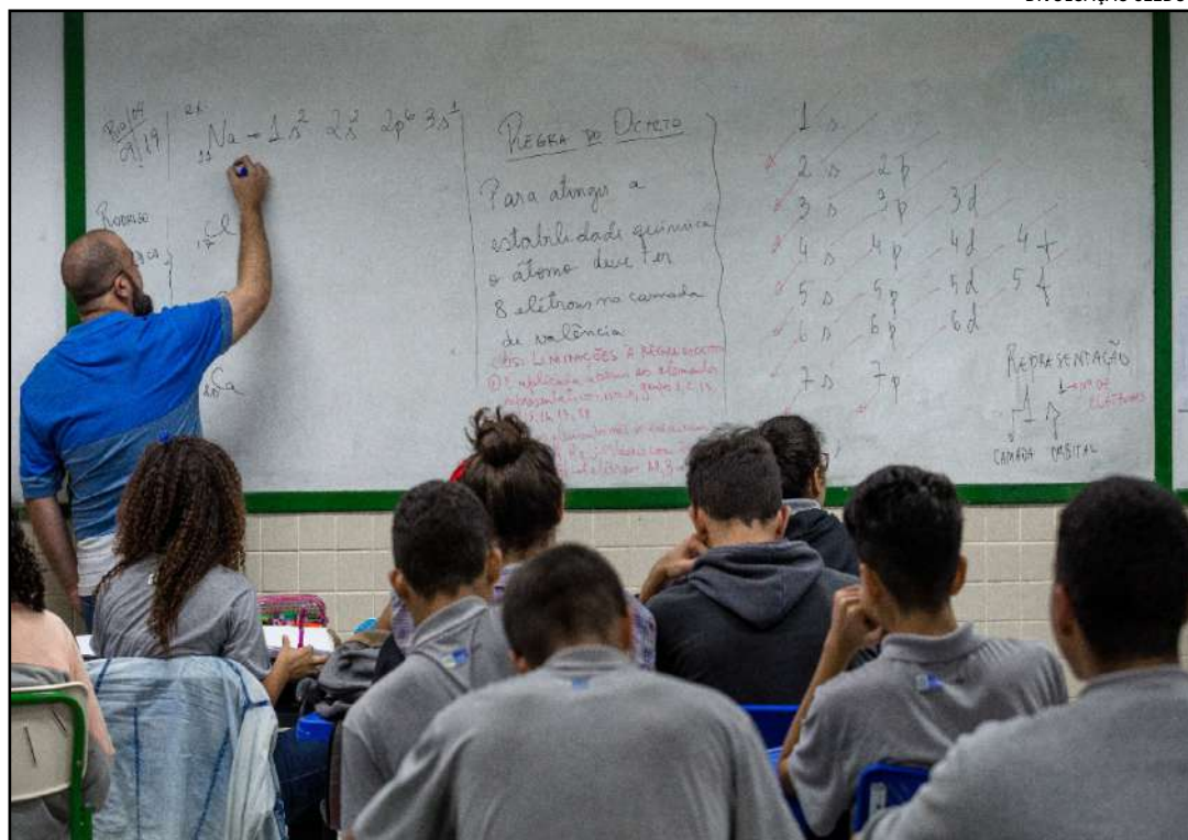
Salas de aula da rede estadual vão receber reforço de 4.700 professores temporários