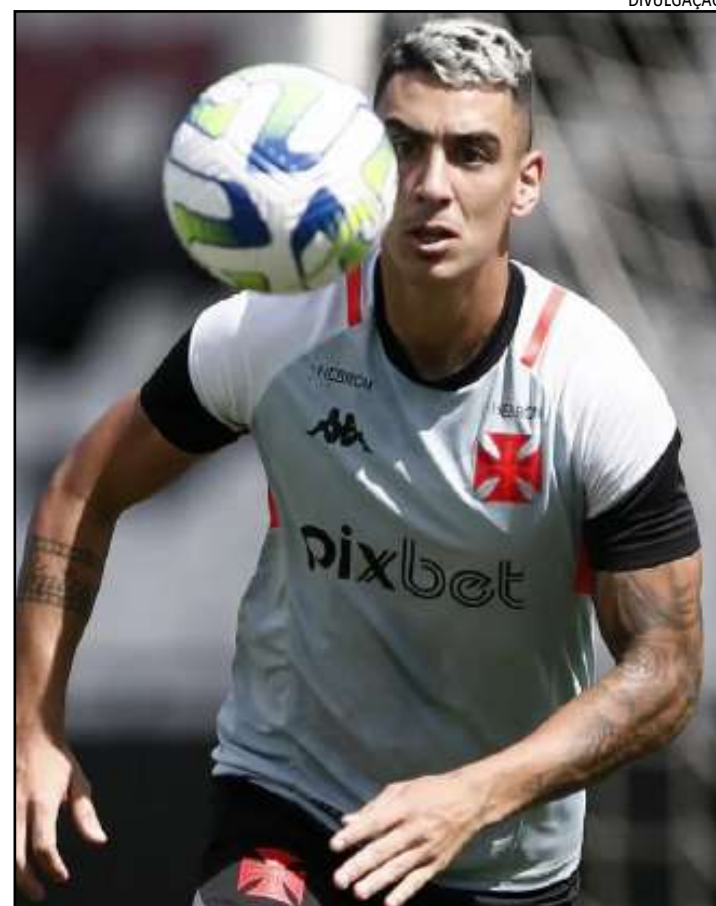
Lateral custou R$ 10 milhões ao clube carioca

No ano passado, o lateral viveu bons momentos no Vasco, sendo escolhido inclusive o melhor da posição no Campeonato