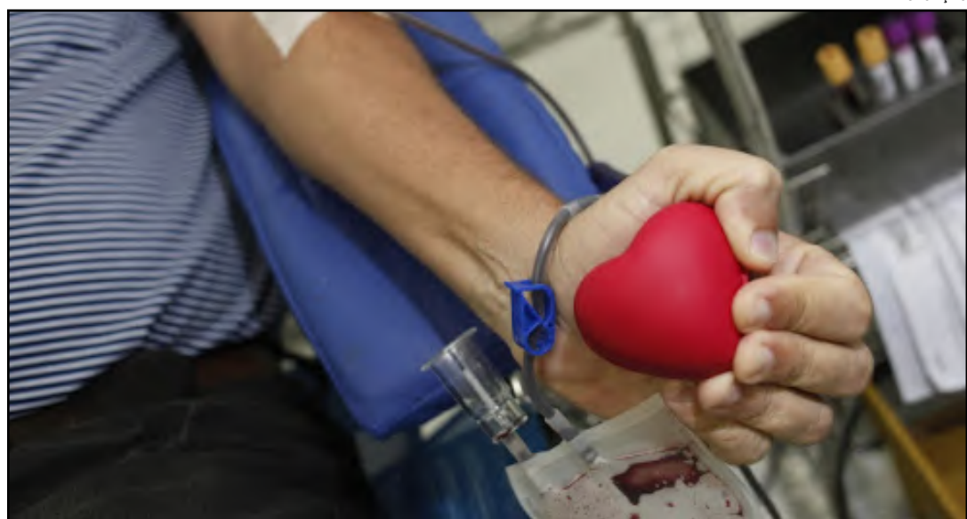
Dia D da campanha será neste sábado

Não é necessário estar em jejum, apenas evitar alimentos gordurosos nas quatro horas que antecedem a doação e não ingerir bebidas alcoólicas 12 horas antes. Tatuagem e piercing impedem a doação por seis meses.