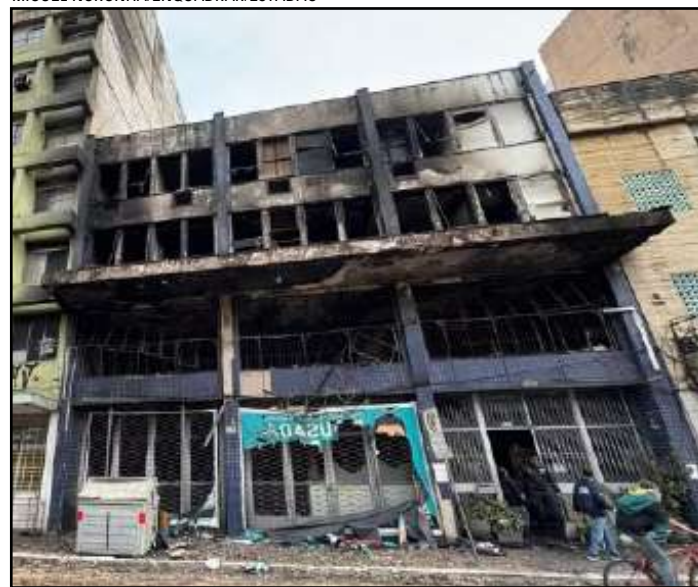
Local onde ocorreu o incêndio que matou 10 pessoas

PORTO ALEGRE - Dez pessoas morreram e outras 13 ficaram feridas em um incêndio que atingiu uma pousada na região central de Porto Alegre, na madrugada de ontem (26). A décima vítima foi localizada no terceiro andar do prédio