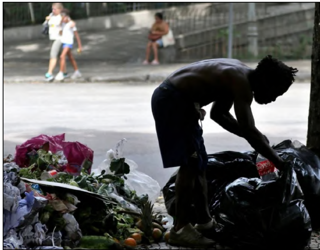
Perfil majoritário dessa população é masculina

Pessoas que frequentam as ruas para obter renda, mas não pernoitam, foram eliminadas do levantamento. A pesquisa foi realizada entre os dias 21 e 25 de novembro de 2022 e adotou como critério pessoas que dormiram ao menos uma noite em situação de rua na semana, excluindo casos fortuitos.