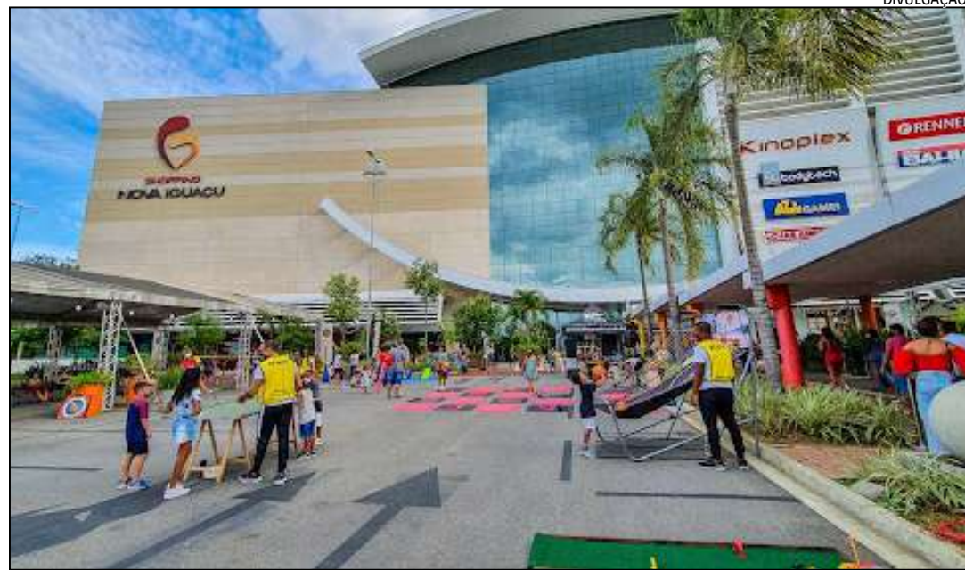
Comemorações começam às 12h30