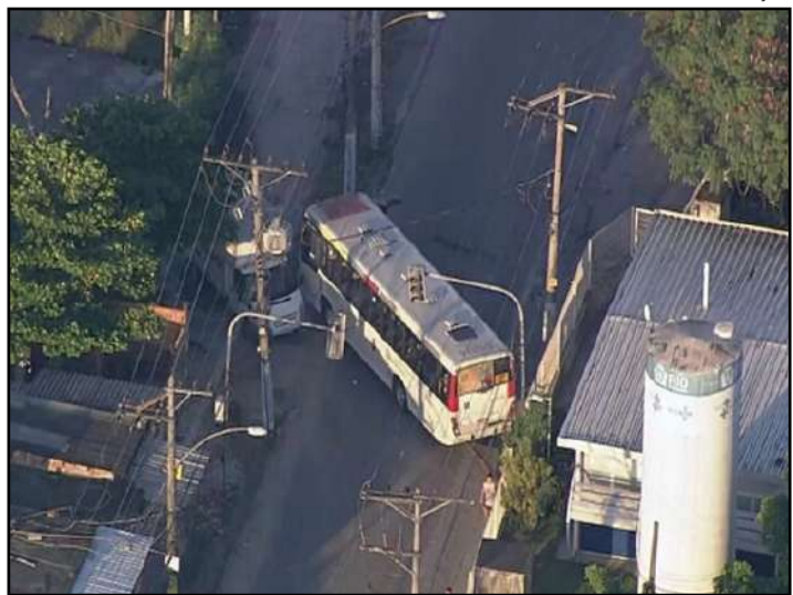
Veículos foram usados como barricadas

dos do sindicato, a cidade possui uma média de 230 veículos incendiados por mês. Os dados da pesquisa abrangem os meses de abril de 2023 a este ano. O prejuízo causado chega