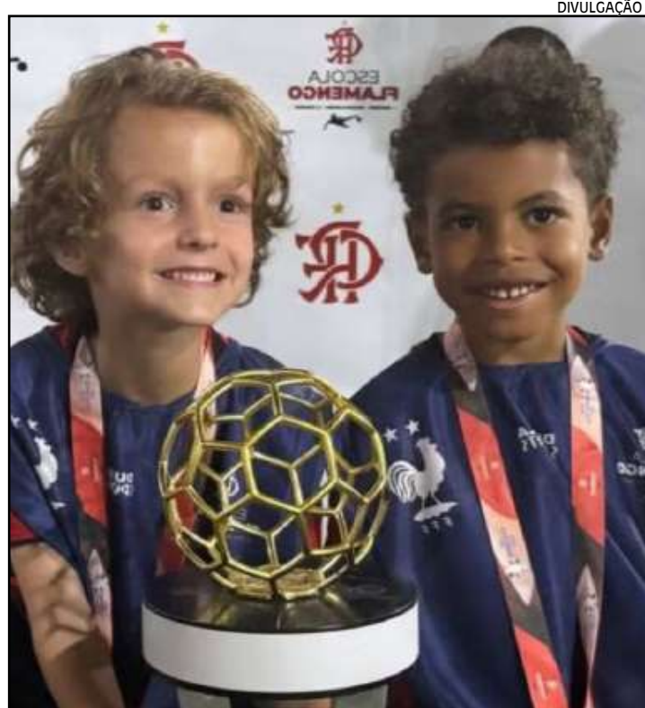
Pupilos ganham primeiro título pelo rubro-negro na categoria