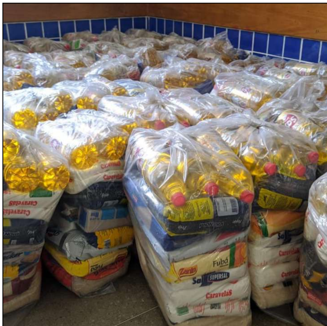
Insegurança alimentar ainda afeta 4,1% da população

com o Ministério do Desenvolvimento e Assistência Social, Família e Combate à Fome (MDA), usando como referencial metodológico a Escala Brasileira de Insegurança Alimentar (EBIA), que permite a identificação e classificação dos domicílios de acordo com o nível de segurança alimentar de seus moradores.