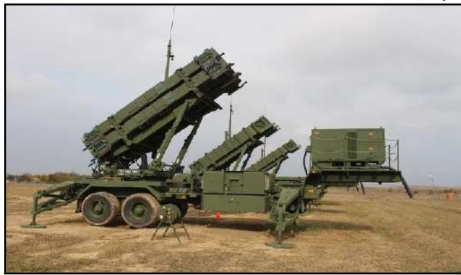
Mísseis serão usados para reabastecer defesa

Os Estados Unidos anunciaram que irão fornecer à Ucrânia mísseis Patriot para seus sistemas de defesa aérea adicional de ajuda de US$ 6 bilhões, segundo o secretário de Defesa americano, Lloyd Austin.