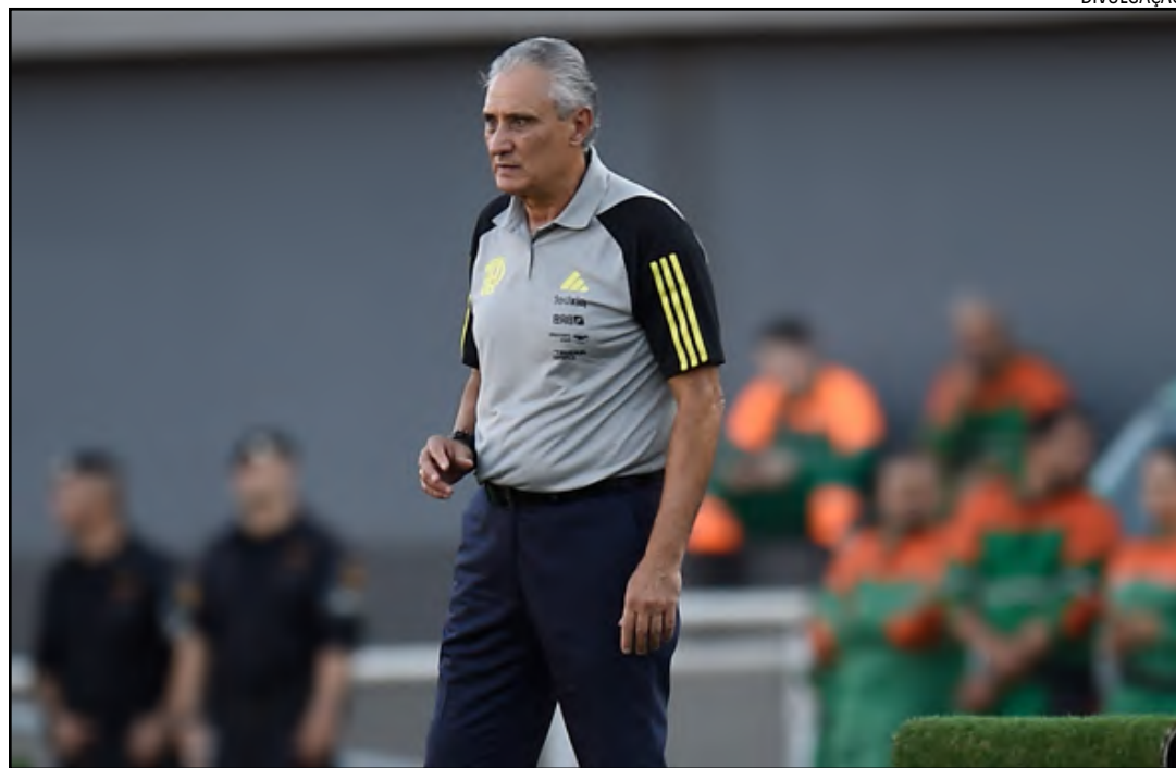
Tite decidiu escalar força máxima contra o Botafogo, pela quarta rodada do Campeonato Brasileiro

A partida entre Flamengo e Botafogo será