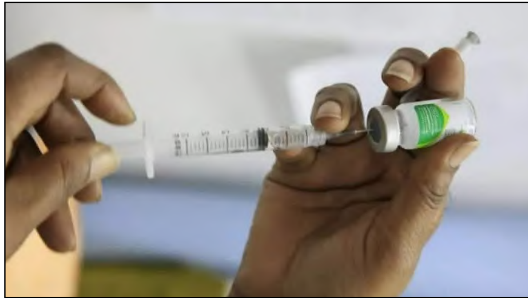
Vacinação está disponível para todas as pessoas

A Rodoviária do Rio recebeu um ponto de vacinação (PV) contra a gripe. Os viajantes interessados em atualizar a caderneta vacinal podem ser imunizados no local sempre às sexta-feiras, até o dia 31 de maio, das 8h às 17h, no 2º piso, próximo à Caixa Econômica Federal. A iniciativa da Secretaria Municipal de Saúde (SMS) visa facilitar o acesso e estimular a vacinação.