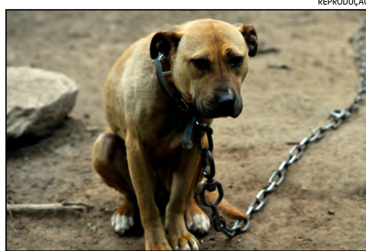
PL foi sancionado pelo governador do Rio

“Os animais submetidos a acorrentamento são necessariamente vítimas de violência, uma vez que têm suas liberda-