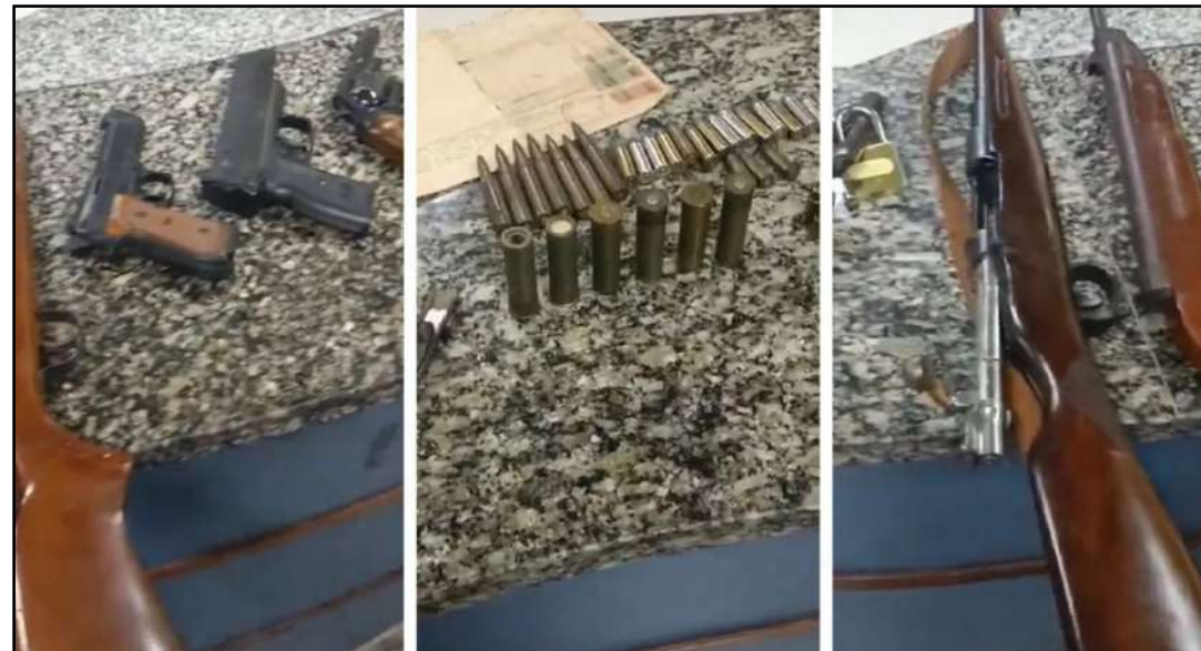
Homem não teve a identidade revelada

Policiais do 30º BPM (Teresópolis) prenderam um homem suspeito de agredir a mulher em Teresópolis, na Região Serrana. Segundo a Polícia Militar, na ação, os agentes apreenderam armas, facas e 47 munições.