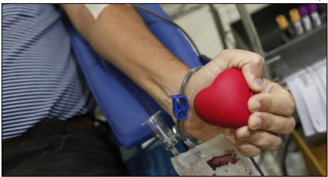
Dia D da campanha será neste sábado

Não é necessário estar em jejum, apenas evitar alimentos gordurosos nas quatro horas que antecedem a doação e não ingerir bebidas alcoólicas 12 horas antes. Tatuagem e piercing impedem a doação por seis meses.