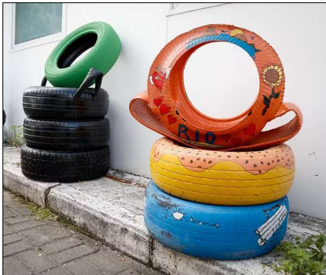
Pneus poderiam se tornar focos de mosquitos