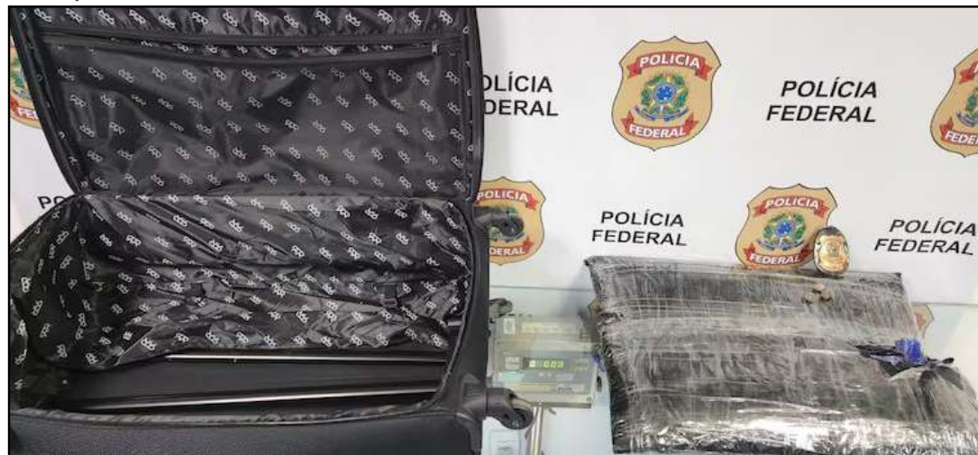
Droga estava escondida em bagagem

Um espanhol, de 26 anos, foi preso pela Polícia Federal com 8kg de ecstasy no Aeroporto Internacional Tom Jobim (Galeão), no Rio de Janeiro. De acordo com as investigações, o suspeito foi flagrado com a droga ao passar