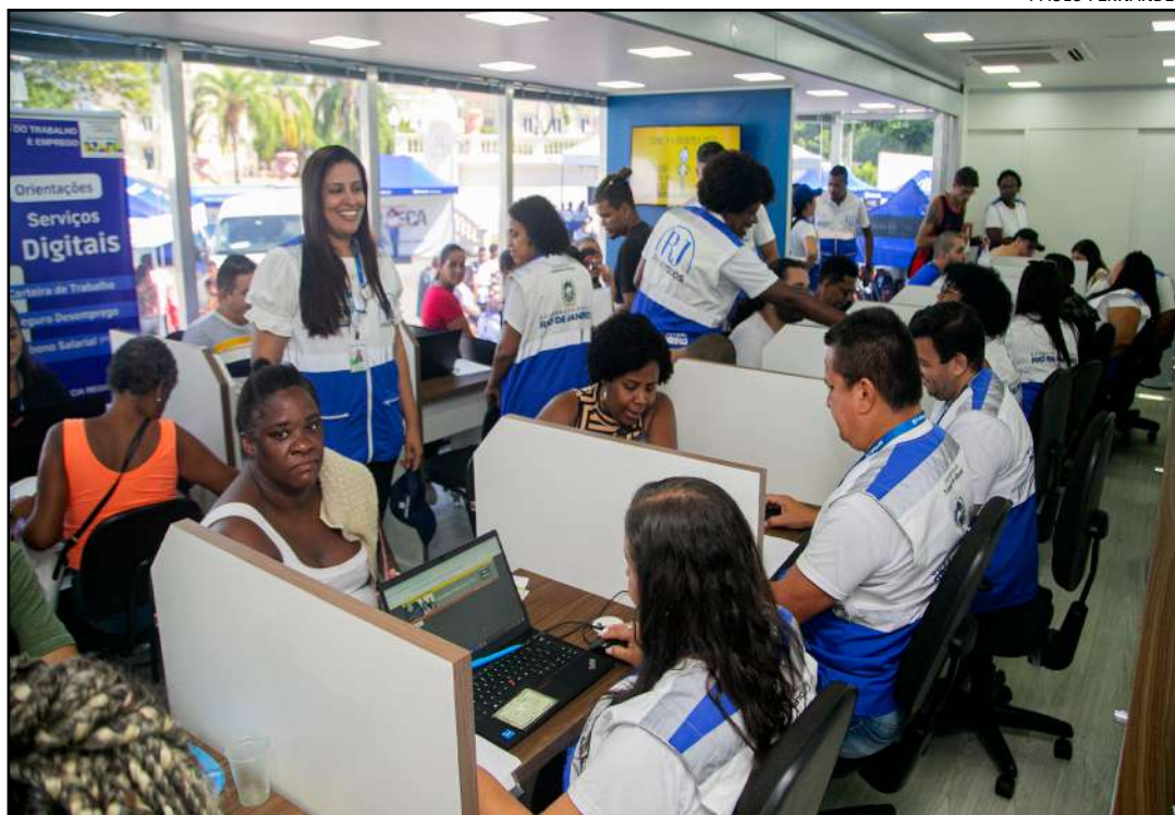
Mutirão ofereceu serviços como vagas de emprego e acesso à documentação