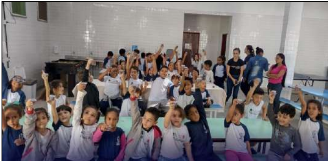
Evento enfatizou a importância de uma alimentação saudável dos alunos

Os alunos da Escola Municipal Sebastião Barbosa participaram de uma palestra sobre Educação Nutricional, realizada pelas estagiárias do setor de nutrição escolar, abordando a diferença entre alimentos saudáveis e não saudáveis.