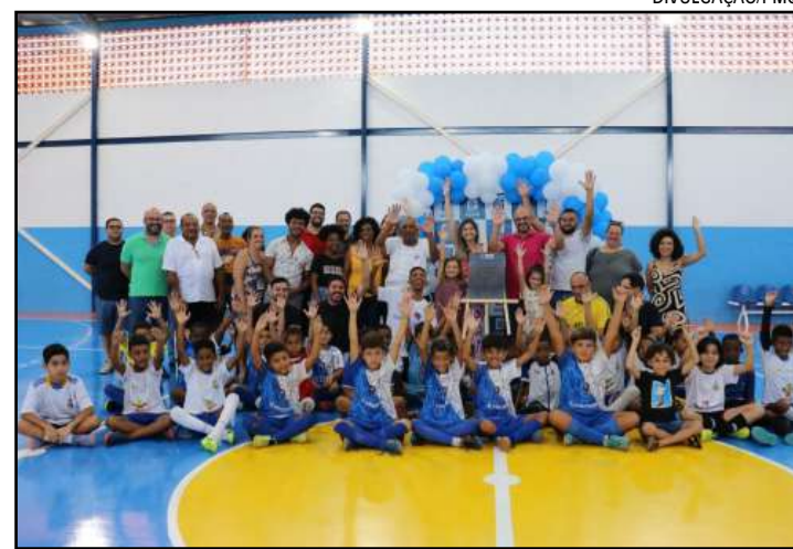
Espaço foi entregue durante cerimônia no bairro Nossa Senhora do Rosário

O dia também foi marcado pela entrega da reforma da área externa do