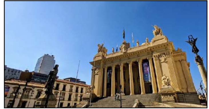
O palácio tornou-se a casa da Assembleia Legislativa do Estado do Rio