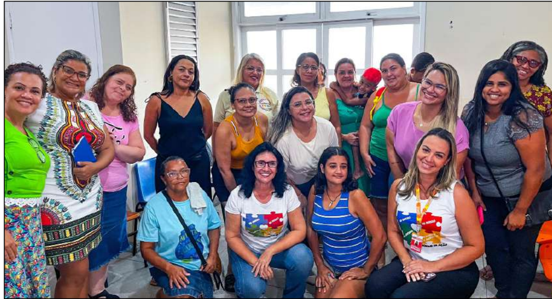
Objetivo do encontro foi para tirar dúvidas sobre questões de saúde mental e a implantação de centro de atendimento

O objetivo do encontro foi para tirar dúvidas sobre questões de saúde mental e a implantação do Centro de Atendimento Especializado às Famílias Neuroatípicas, no bairro Piam. A conversa com as mães atípicas aconteceu na sede do Ambulatório, na Escola Municipal de Educação