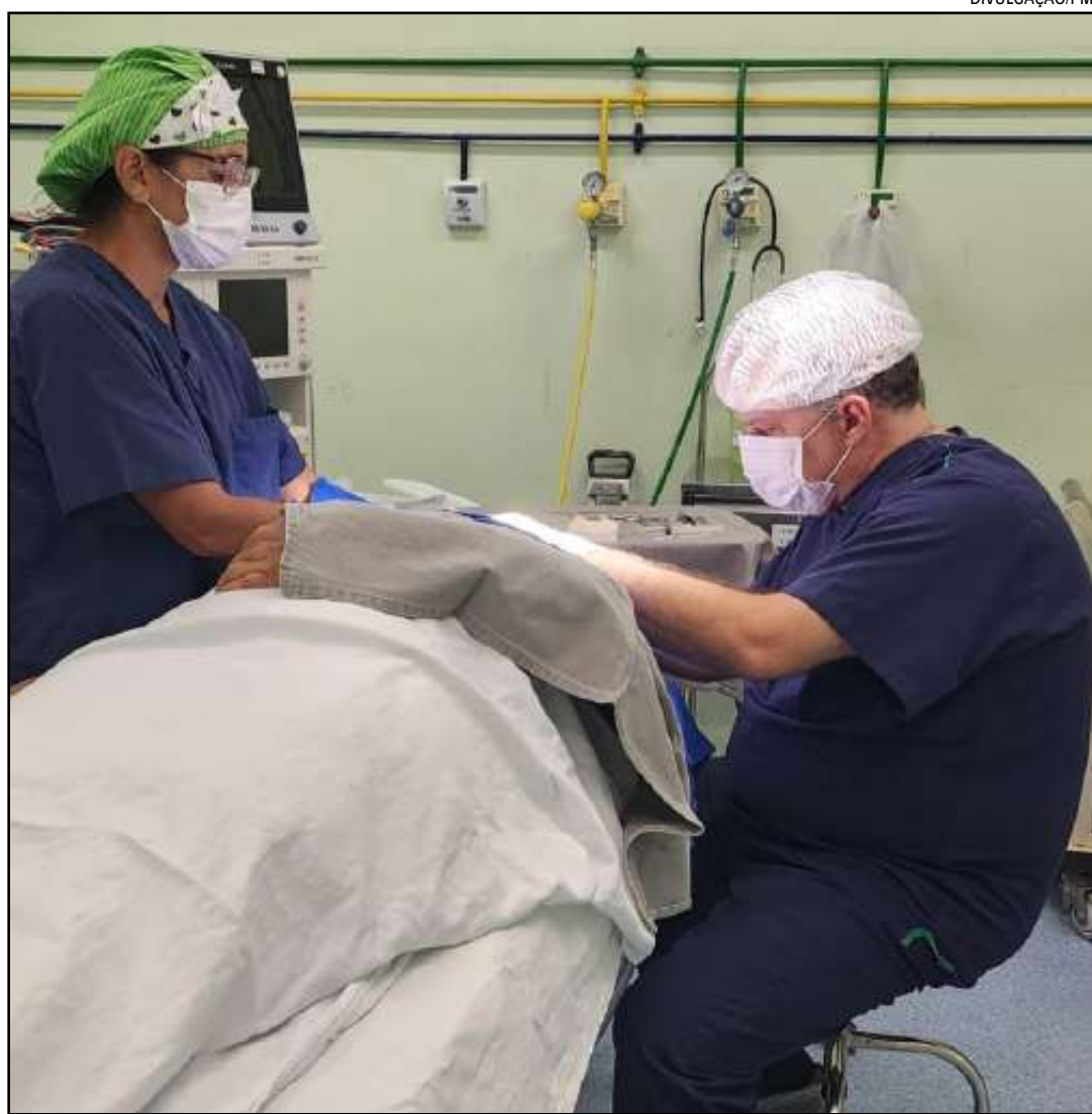
Procedimento está entre as cirurgias reparadoras pós-bariátricas cobertas pelo SUS

“Além dos benefícios estéticos, a mamoplastia melhora a saúde da paciente. Ao diminuir o