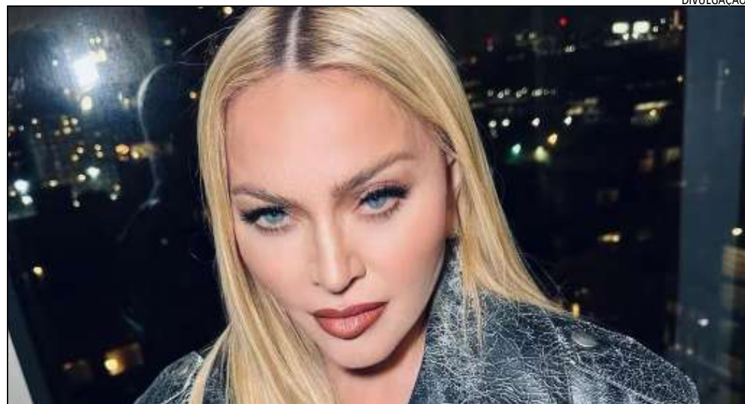
Imagens da apresentação já rodam a internet

As imagens de Cazuzza, Renato Russo e Betinho no telão de Madonna já rodam a internet depois que apareceram no teste, na última quarta-feira (1). O palco está sendo montado para o maior show da carreira da artista americana, marcado para o sábado (4), quando os organizadores esperam reunir mais de 1 milhão de pessoas.