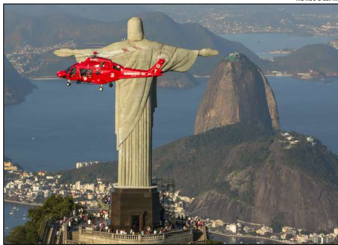
Militares do CBMERJ vão auxiliar nas ações de resgate no RS

O apoio na operação foi oferecido pelo governador Cláudio Castro ao