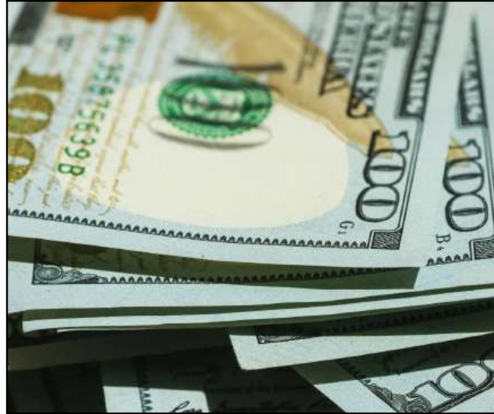
Bolsa sobe 0,95% e recupera os 127 mil pontos

Embalado pelo cenário internacional e pela melhoria da perspectiva da nota de crédito do Brasil, o mercado financeiro teve um dia de alívio. O dólar teve forte queda e voltou a aproximar-se de R$ 5,10. A bolsa de valores subiu quase 1% e recuperou os 127 mil pontos.