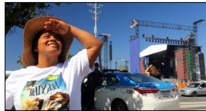
Polícia reforça atuação de agentes para o show da cantora em Copacabana

Através das imagens registradas pelas câmeras da