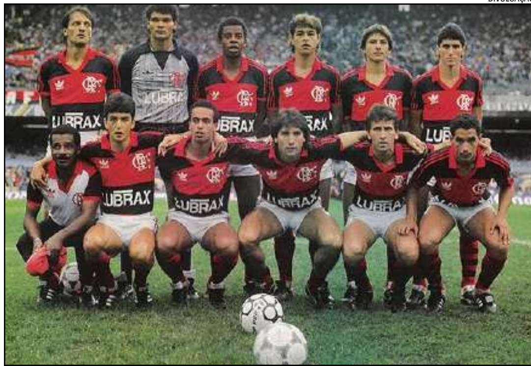
Sem dinheiro para organizar o Campeonato Brasileiro, a CBF anunciou que não iria promover a competição em 1987

Em 2011, a Confederação Brasileira de Futebol (CBF), especialista no esporte, reconheceu o Flamengo e o Sport como campeões brasileiros de 1987. Porém, insatisfeito com o resultado, o time pernambucano procurou o STF, ou seja, a Justiça Comum, para conquistar o direito de ser considerado o único vencedor daquele ano.