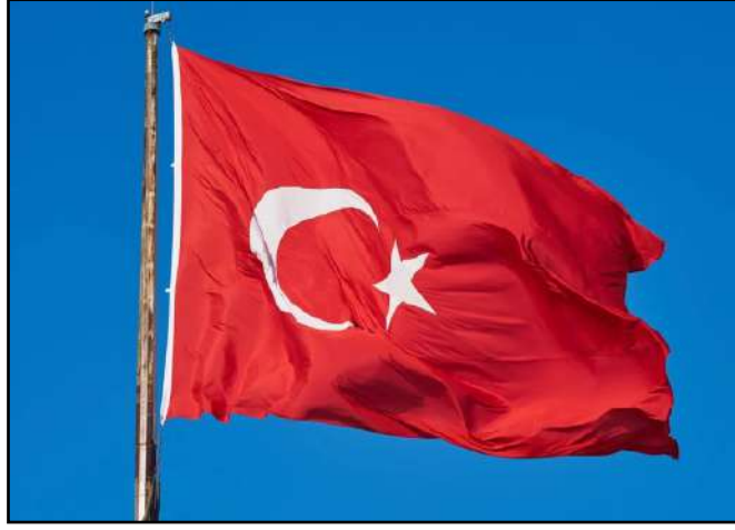
Ministro das Relações Exteriores afirmou que entrará em contato imediatamente com autoridades relevantes para criar alternativas ao bloqueio

O ministro das Relações Exteriores de Israel, Israel Katz, alegou que o presidente da Turquia, Recep Tayyip Erdogan, está quebrando acordos ao bloquear o comércio de importações e exportações israelenses nos portos turcos. “É assim que um ditador se comporta, desconsiderando os interesses da população turca e de empresários, ignorando acordos internacionais de comércio”, escreveu o ministro, em publicação no X, antigo Twitter.