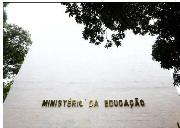
Medida integral política para implementar educação étnico-racial

O anúncio foi feito em meio a casos recentes de racismo em unidades de ensino. Um deles ocorreu no dia 3 de abril, em Brasília, quando alunos da