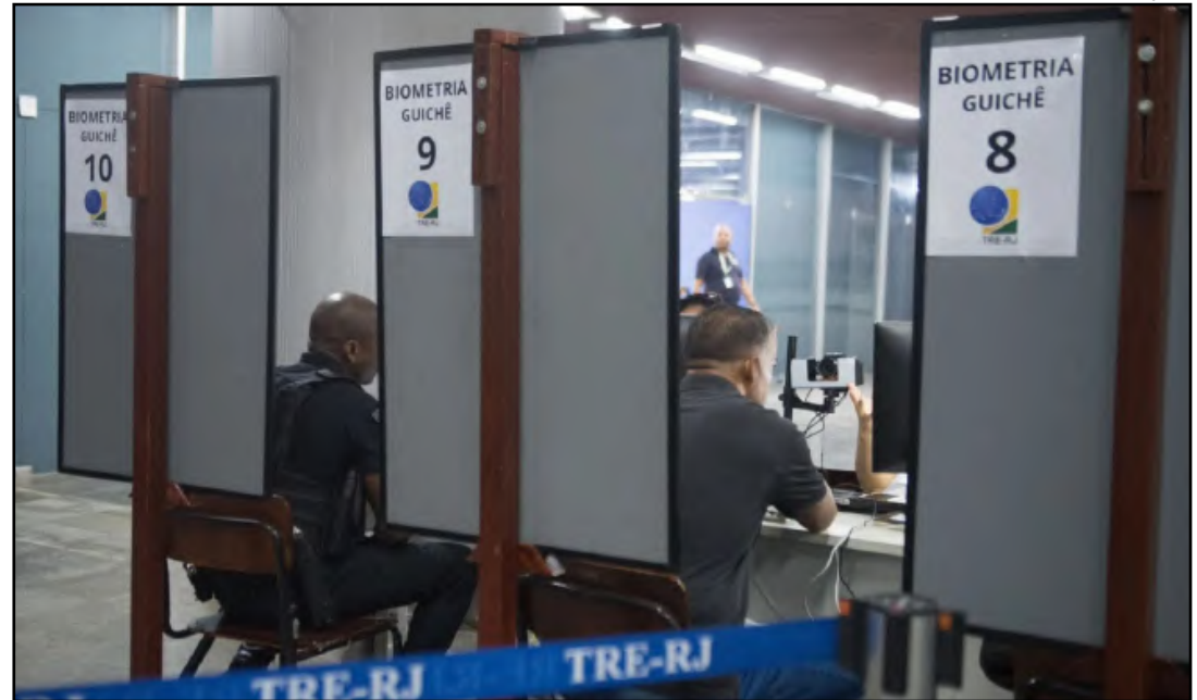
Eleitores têm até dia 8 para regularizar cadastro

As próximas eleições, para prefeitos e vereadores, acontecerão nos dias 6 e 27 de outubro.