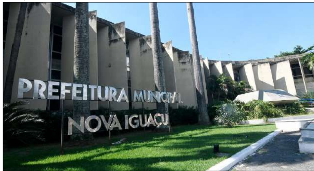
Para se cadastrar no Sistema de Registro Cadastral Unificado, os fornecedores podem enviar os documentos pelos correios ou comparecer pessoalmente à sede da Comissão Permanente de Licitação

A Comissão Permanente de Licitação (CPL/SEMUG) oferece aos interessados a oportunidade de cadastramento no Portal Nacional de Contratações Públicas (PNCP), para fornecedores que desejam fazer negócios com o Município de Nova Iguaçu. O chamamento acontece conforme a Lei Federal nº 14.133/21.