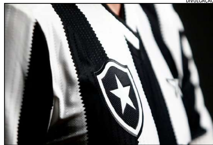
Uniforme I para 2024 foi lançado na última quarta-feira, e vendas tiveram início ontem

Segundo o próprio Botafogo, a camisa faz referência a história do clube. A estreia da nova camisa acontece nesta quinta-feira (2), na partida contra o Vitória, pelo jogo de ida da terceira fase da