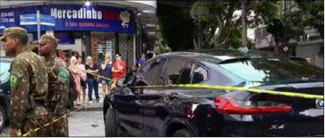
Caso ocorreu na Rua Barão de Mesquita, próximo do 1º Batalhão de Polícia do Exército (BPE)

Um suspeito morreu e um idoso foi baleado durante uma tentativa de assalto com troca de tiros, na tarde do último sábado (20), na Tijuca, Zona Norte do Rio. O caso ocorreu na Rua Barão de Mesquita, na altura da Rua Gonzaga Bastos, próximo ao 1º Batalhão de Polícia do Exército (BPE).