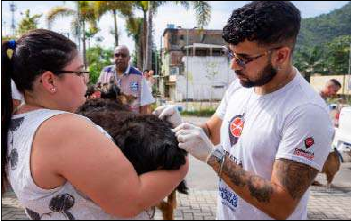
Superintendência divulgou o balanço das atividades

Programa de Controle de Roedores - Mais de 3.800 tratamentos foram executados, reforçando o combate de roedores em imóveis diversos;