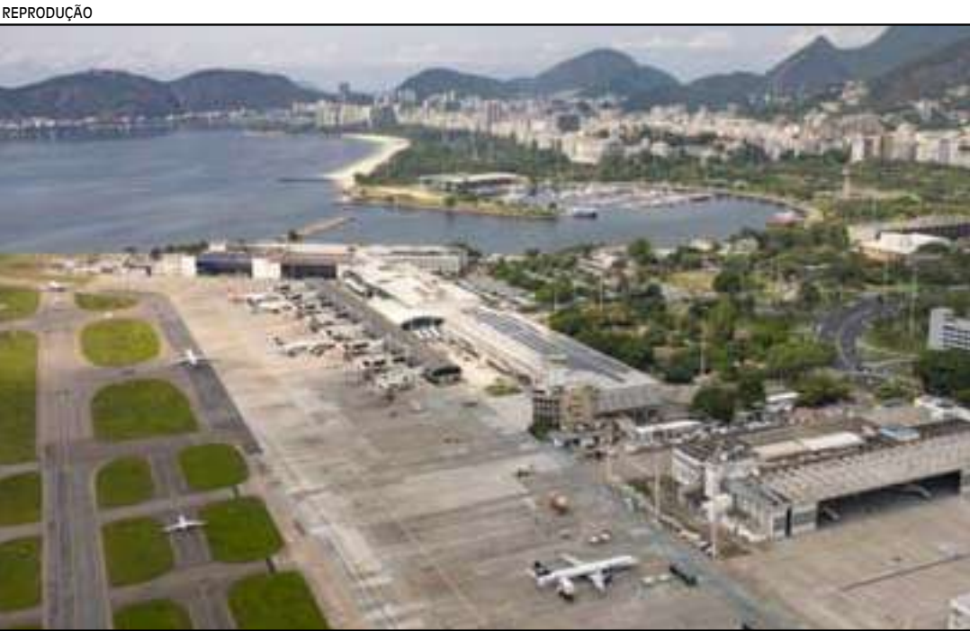
A restrição tem como objetivo equilibrar a demanda do Santos Dumont com o Galeão

A expectativa do Executivo estadual é que, com a adesão formal ao Propag, o Rio consiga aliviar a pressão sobre o caixa nos próximos anos, ampliar a previsibilidade fiscal e criar condições para retomar investimentos, após décadas marcadas por crises financeiras e sucessivas renegociações da dívida.