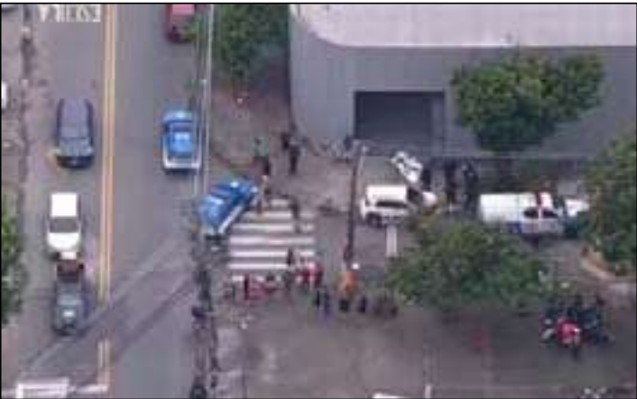
O crime aconteceu na Rua Rubens de Castro, na Taquara

O corpo foi encaminhado para o Instituto Médico Legal (IML). A Delegacia de Homicídios da Capital (DHC) investiga o caso. Segundo a Polícia Civil, diligências estão em andamento para apurar a autoria e as circunstâncias do crime.