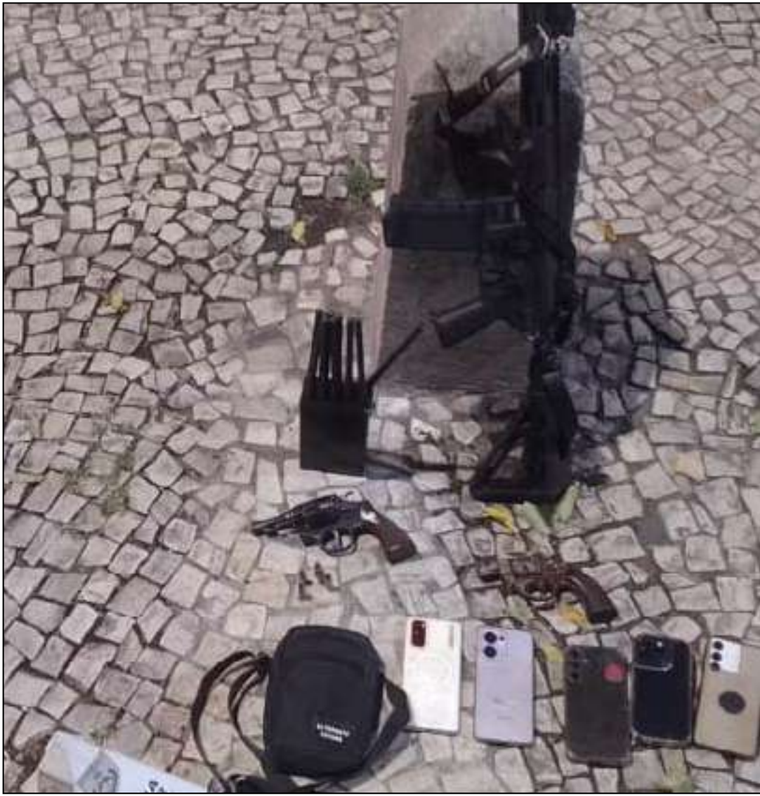
A polícia apreendeu um veículo com registro de roubo, um bloqueador de sinal, equipamento comumente usado para impedir o rastreamento de carros, dois revólveres, uma réplica de fuzil e cinco telefones celulares

A Rua da Passagem chegou a ter o trânsito impactado durante a operação, mas a via foi liberada após o fim do trabalho da perícia.