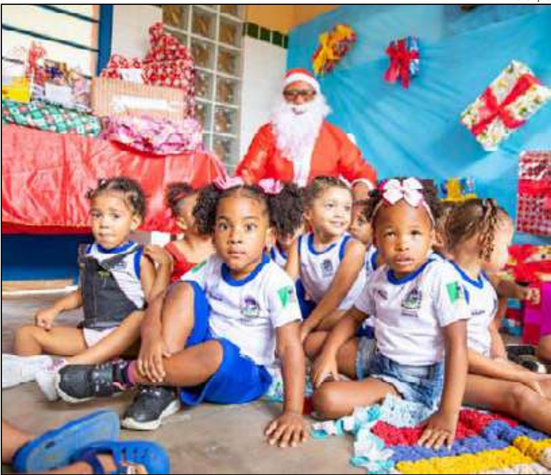
A campanha solidária é promovida pelos Correios há mais de 30 anos

Através das men-sagens, os pequenos expressaram, com de-senhos e palavras sim-ples, seus desejos para o Natal. As cartas foram enviadas aos Correios e atendidas por corres-pondentes anônimos dedicados a contribuir com um Natal mais alegre para uma crian-ça desconhecida. A campanha solidá-ria é promovida pelos Correios há mais de 30 anos e, desde 2010, contempla escolas pú-blicas do país. Esse é o segundo ano consec-u-tivo que Mesquita tem uma das escolas da rede pública municipal atendida pela iniciati-va.