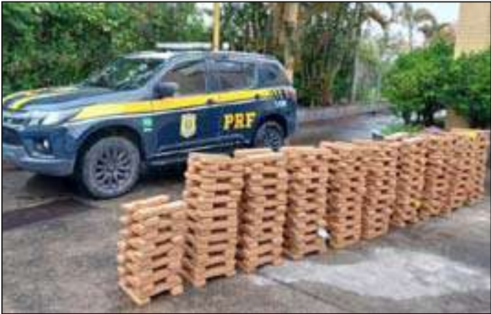
Carga da droga, que tinha como destino Juiz de Fora, em MG, estava espalhada pelo carro e no porta-malas

Policiais rodoviários federais apreenderam, na manhã deste sábado (20), 334 quilos de maconha durante uma fiscalização na Rodovia Presidente Dutra (BR-116), no trecho que passa por Itatiaia, no Sul Fluminense. Um homem de 29 anos foi preso em flagrante.