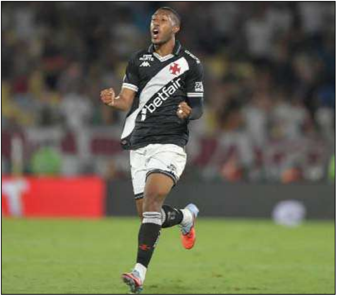
Vasco espera uma valorização ainda maior do seu ativo

80 milhões de euros (cerca de R$500 milhões). O que põe o Vasco em condições de ser o mediador da negociação, impondo os valores que eles enxergam como justos para a venda de uma das suas maiores joias. Apesar dos R$200 milhões oferecidos serem um valor que traria uma certa tranquilidade para o clube na próxima temporada. O que o camisa 77 fez nesta temporada com apenas 19 anos de idade, faz o clube sonhar com valores mais altos e equipes de uma prateleira maior no futebol europeu.