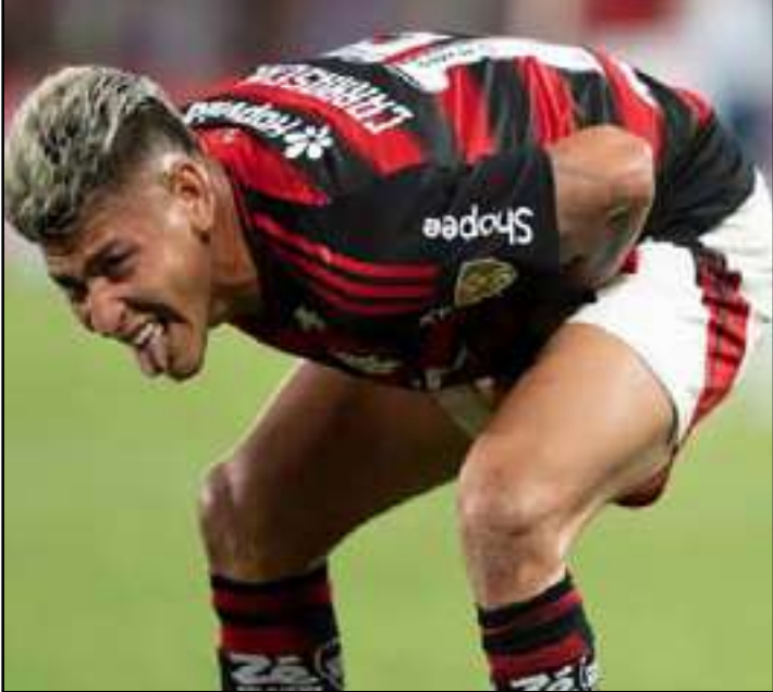
Meia-atacante colombiano é o grande alvo do time francês

Após perder o Intercontinental para o PSG, o Flamengo começa a trabalhar na montagem do elenco para 2026 e começa a ver alguns dos seus jogadores sendo alvo de ofertas de outros