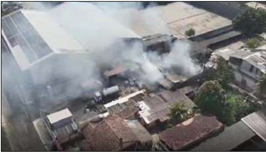
Colunas de fumaça foram vistas à distância

Um incêndio de grandes proporções atingiu um galpão no bairro Figueira, em Duque de Caxias, na Baixada Fluminense, na manhã de ontem (21). Não há informação sobre feridos. Testemunhas relataram o barulho de ex-