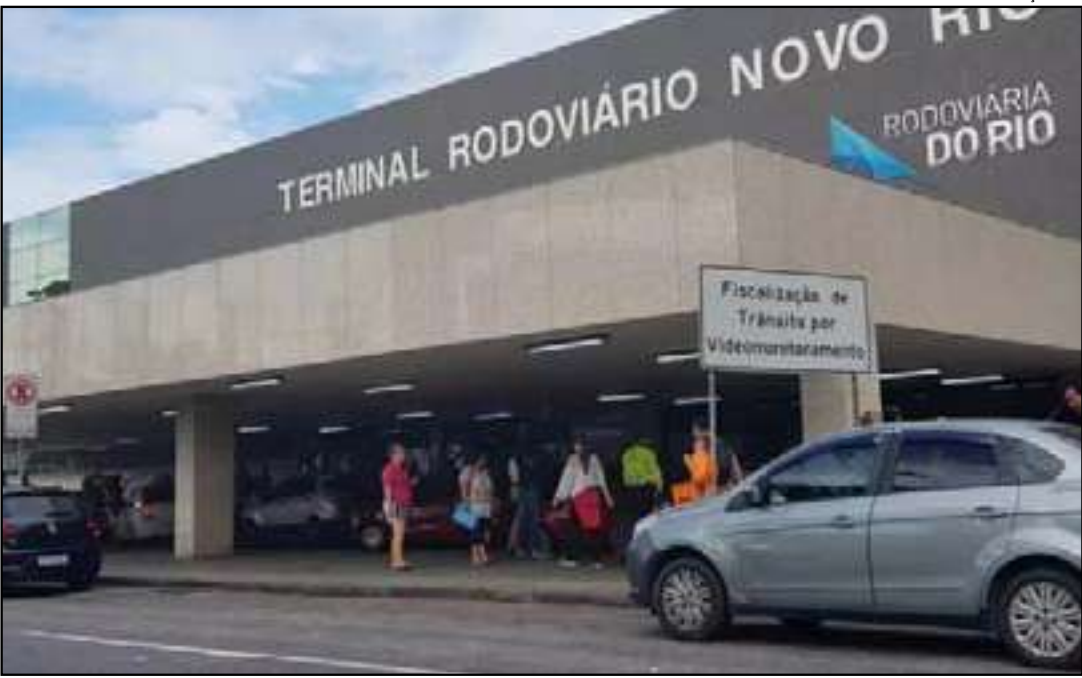
Terminal Rodoviário Novo Rio

Ostras, Angra dos Reis, Juiz de Fora, Saquarema, Arraial do Cabo e Vitória. Já em 2025, as seis primeiras posições permanecem as mesmas, mas o restante da lista foi reconfigurado. Arraial do Cabo ganhou destaque ao subir no ranking, seguida por Juiz de Fora, enquanto Araruama e Búzios passaram a integrar o grupo dos destinos mais procurados. FORTALECIMENTO DO TURISMO Os dados indicam