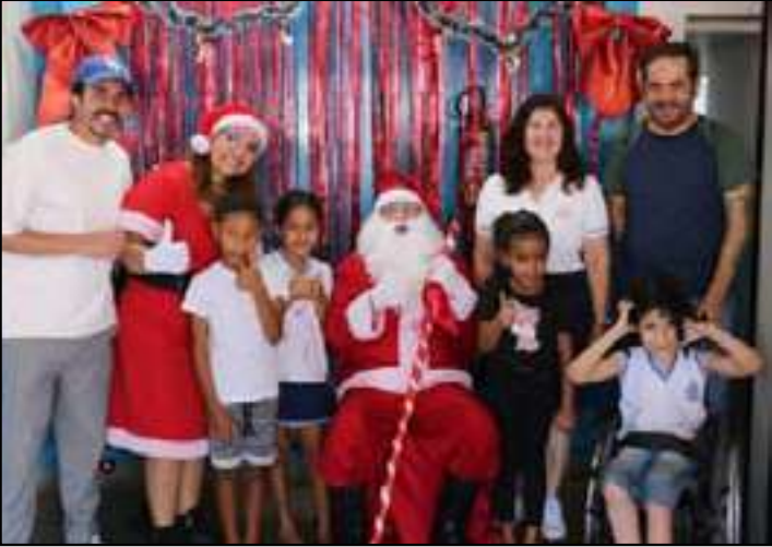
Cantatas de Natal, apresentações culturais e brinquedos infláveis foram os destaques do dia

Um dia de muita diversão e espírito natalino marcou o último sábado (6), em Quatis, durante o evento ‘Natal para Todos’, promovido pela prefeitura em parceria com o Instituto Inovart Educação, arte e impacto social, para os alunos da rede municipal de ensino.