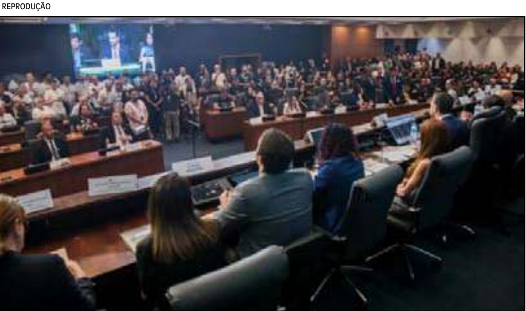
Corrida interna expõe divisão entre PL, União Brasil e bloco independente

ciado. Balthazar, ao visitar sua propriedade no alto do penhasco, quase foi atacado por uma cobra enquanto descansava sob uma árvore. Ele foi salvo após clamar: “Valei-me, Nossa Senhora”. Em um ato providencial, um lagarto, predador natural de serpentes, surgiu e atacou a cobra, salvando o fidalgo que, em agradecimento, mandou construir a capela no topo do penhasco. Em 1870, a antiga capela foi demolida para dar lugar à nova Igreja, que foi expandida e reformada em diversas fases. Entre 1900 e 1902, foram adicionados à Igreja da Penha muitos elementos arquitetônicos que compõem a identidade visual atual do santuário.