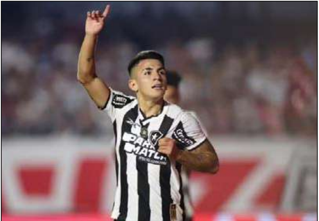
Cobrança foi iniciada em novembro de 2024

manteve a condenação integral. O Alvinegro afirma que o acordo fechado em junho de 2024 previa que o pagamento seria dividido ao longo de quatro anos, e não até junho de 2026, como argumenta o Atlanta. A defesa alvinegra também apontou que um fator externo quase inviabilizou a transação: pela legislação da MLS, Almada tinha direito a 10% da venda. O Atlanta exigiu que o jogador abrisse mão desse valor — algo rejeitado pelos advogados do atleta. A solução encontrada foi que a Eagle Football compraria esse crédito de Almada por 2,1 milhões de dólares, para posteriormente buscar ressarcimento da MLS. A partir daí, surgiram divergências, com o Botafogo cobrando os 10% na Justiça americana,