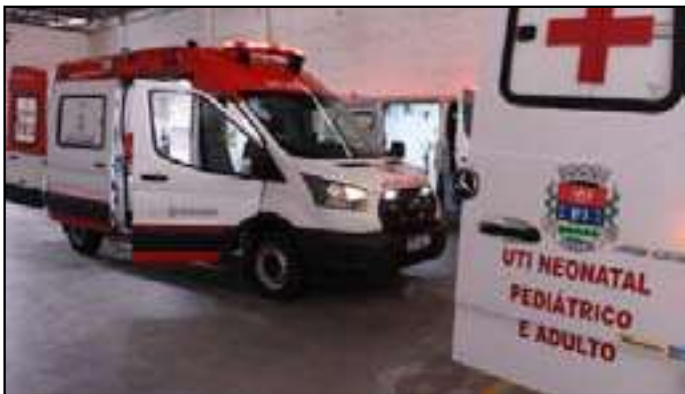
Os veículos foram recuperados e reintegrados à frota

prometeu divulgar novos dados na semana seguinte, incluindo o cronograma de implementação e a estrutura prevista para o local. A live foi encerrada com agradecimentos à bancada federal e à Câmara Municipal.