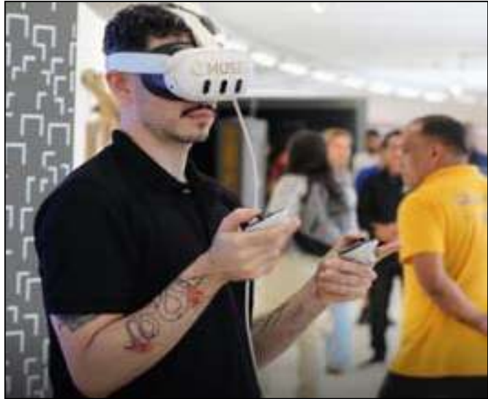
A instalação reúne acervo permanente, exposições digitais e obras de artistas locais

O Museu de Favela (MUF) do Complexo Pavão-Pavãozinho e Cantagalo, na Zona Sul do Rio, foi inaugurado ontem (10)), após receber mais de R$ 2,6 milhões do Governo do Estado para construção e adequação do espaço. A instalação, localizada no Edifício Multiuso do Estado, reúne acervo permanente, exposições digitais, obras de artistas locais e áreas dedicadas à educação e ao turismo comunitário.