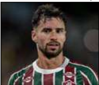
Fluminense observa o cenário com mais cautela