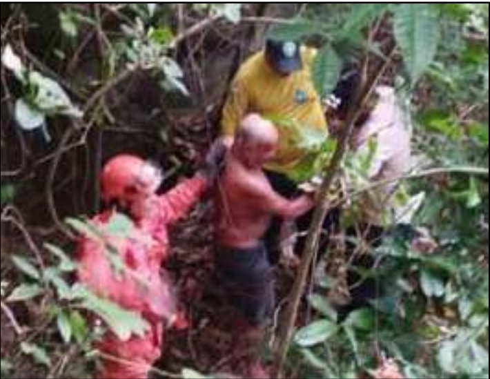
O homem de 67 anos foi resgatado com diversas escoriações

Guarda-parques do Parque Estadual da Pedra Branca, unidade de conservação administrada pelo Instituto Estadual do Ambiente (Inea), realizaram na tarde da última terça-feira (9) uma operação de resgate em conjunto com agentes do 30º Grupamento de Bombeiros Militares (GBM) de Realengo.