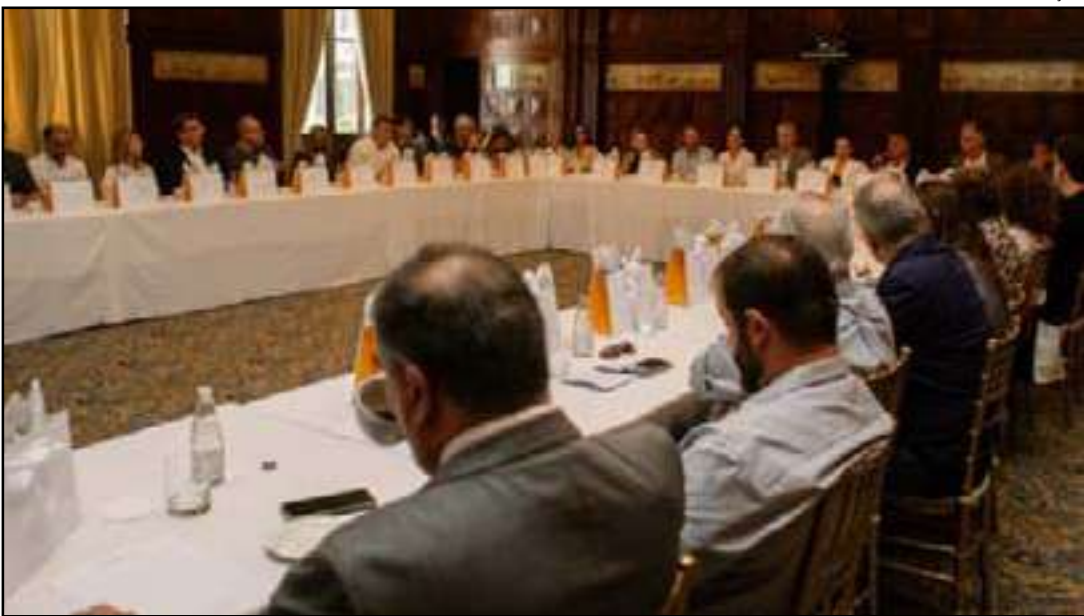
O Visit Rio apresenta no Copacabana Palace, o balanço anual do Calendário de Eventos

O levantamento mostra ainda que o calendário ganhou mais diversidade de público e perfil. Do total de eventos, 15% foram internacionais, 21% na-