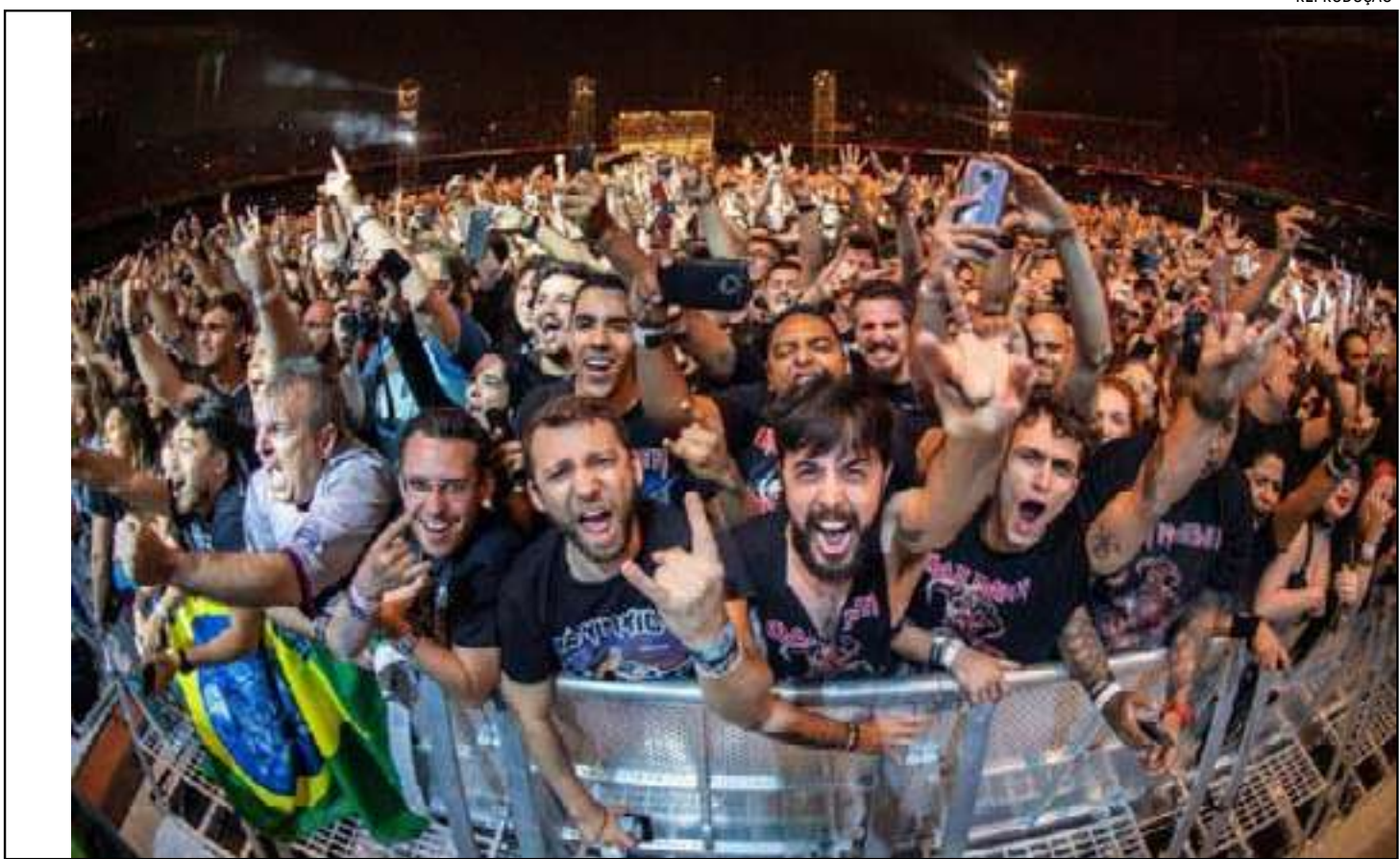
Festival prepara novidades de cenografia e experiências

“Mais uma vez o Rock in Rio reforça sua potência junto ao público. Nossos fãs querem estar no evento, independentemente de quem vai se