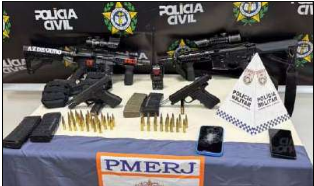
Com o grupo, os agentes apreenderam fuzis, pistolas; carregadores de

saíram do Juramentinho e pretendiam atacar a comunidade Para-Pedro, dominada pelo TCP. Durante o cerco na Avenida Pastor Martin Luther King Jr., próximo à Estrada Coronel Vieira, um veículo suspeito foi abordado, mas seus ocupantes dispararam contra a polícia em vez de parar, iniciando o confronto. Cinco homens no carro foram atingidos e levados ao Hospital Estadual Getúlio Vargas, na Penha, Zona Norte. Um dos suspeitos veio a óbito. Os demais feridos foram identificados como