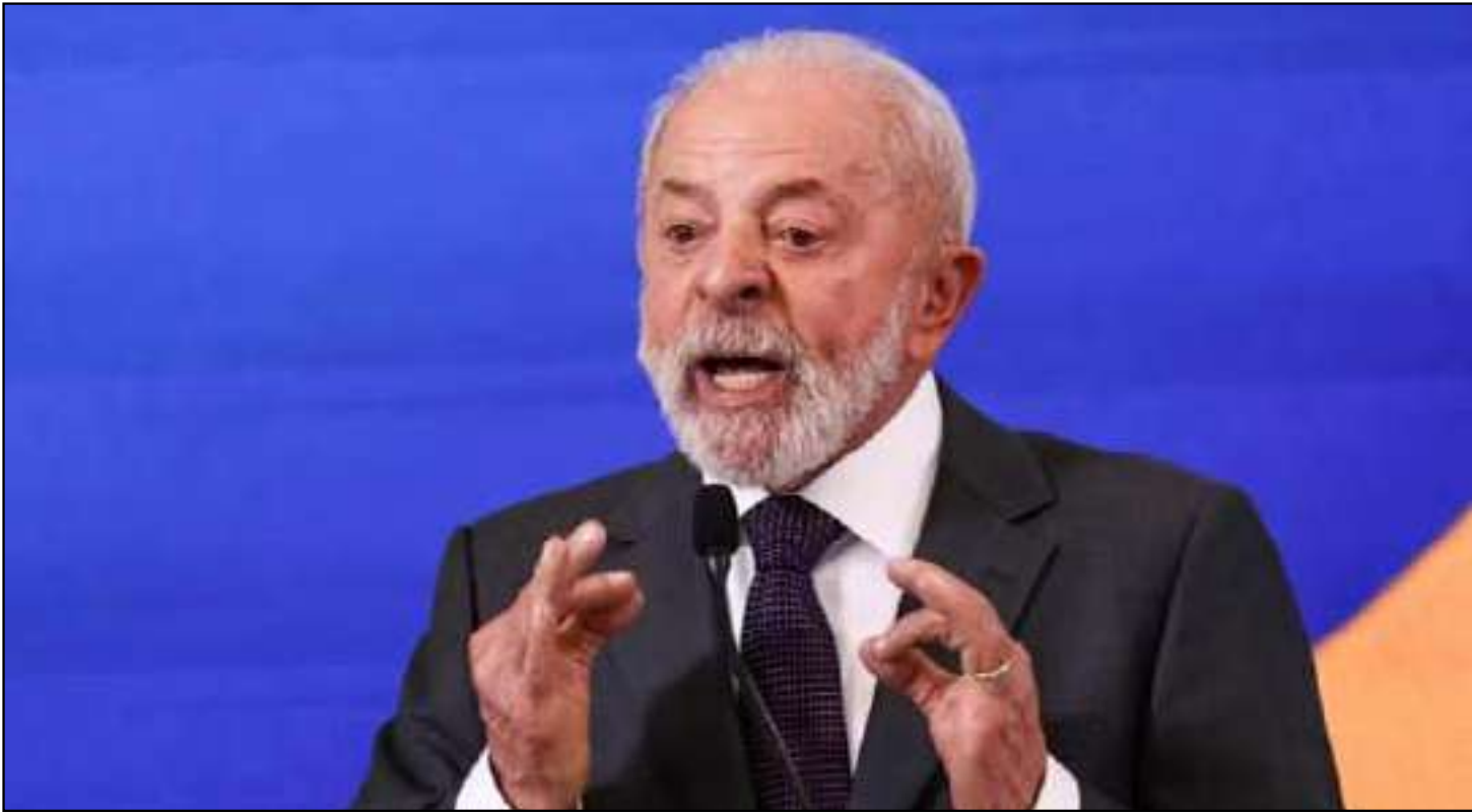
A margem de erro é de 2 pontos percentuais

maior índice de rejeição entre eleitores entrevistados na pesquisa Ipsos-Ipec. O presidente tem 44% de rejeição. Flávio Bolsonaro é rejeitado por 35%. Em seguida, aparecem como mais rejeitados o deputado Eduardo Bolsonaro, com 32%, e a ex-primeira-dama Michelle Bolsonaro, com 30%. Os governadores Ratinho Jr. e Romeu Zema têm 13% de rejeição cada um. Depois, vem Tarcísio de Freitas, com 11%.