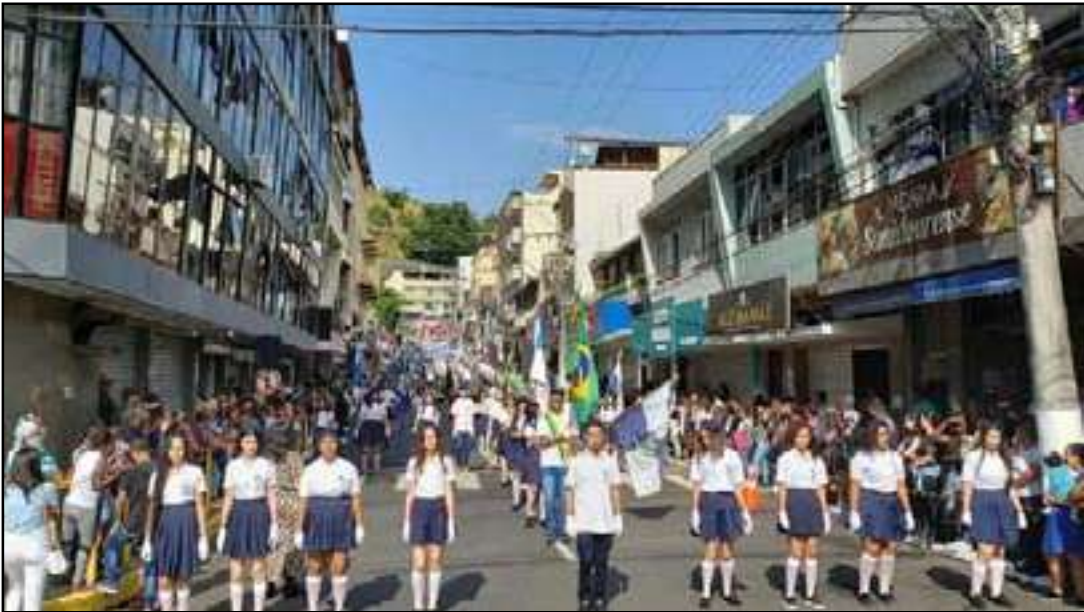
O MPEduc mostra queda no Índice de Desenvolvimento da Educação Básica (Ideb) no município

RECOMENDAÇÕES No plano sistêmico, as recomendações exigem que Sumidouro passe a cumprir a reserva mínima de 1/3 da jornada para planejamento extraclasse, regularize o pagamento integral do adicional de 1/3 de férias, instale mesa de negociação para atualizar o plano de carreira de 2006 e reforce a coordenação pedagógica, hoje restrita a apenas quatro profissionais para 23 escolas. O MPF e o MPT também cobram plano estra-