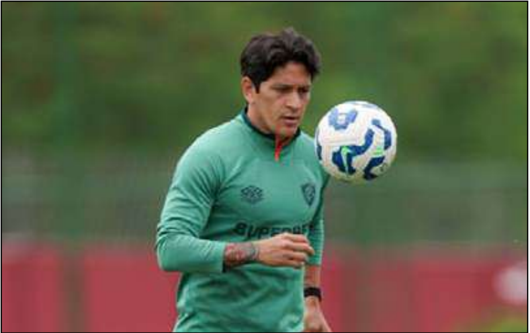
Atacante sofreu lesão no joelho direito

Artilheiro do Fluminense, Germán Cano, de 37 anos, não deverá mais entrar em campo na temporada. De acordo com informações, apesar das tentativas, o argentino não se recuperou da lesão no joelho direito a tempo de ficar à disposição de Luís Zubeldía.