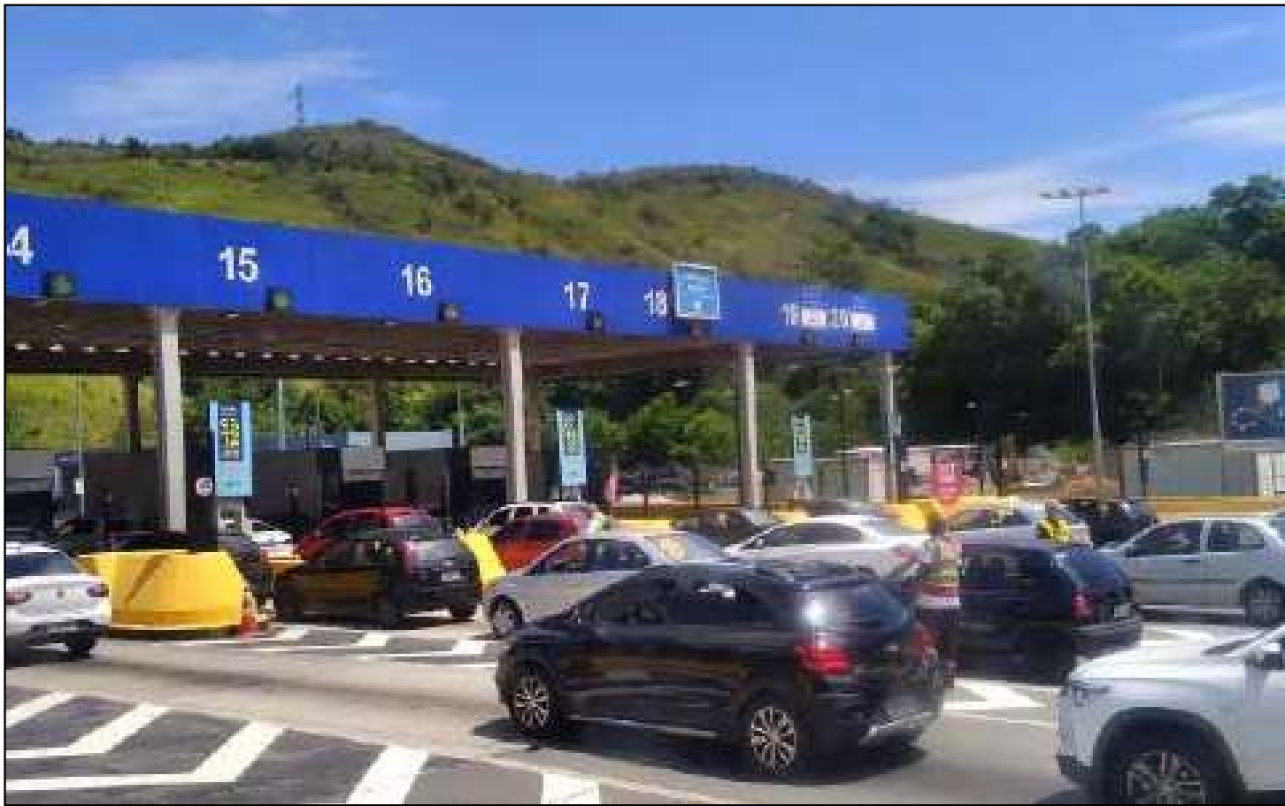
Tarifa seria reajustada a partir do próximo dia 20

plicou que o aumento deveria ter sido homologado pela Prefeitura do Rio, o que não ocorreu. Por isso, a empresa foi à Justiça. Argumentou que o reajuste de fevereiro