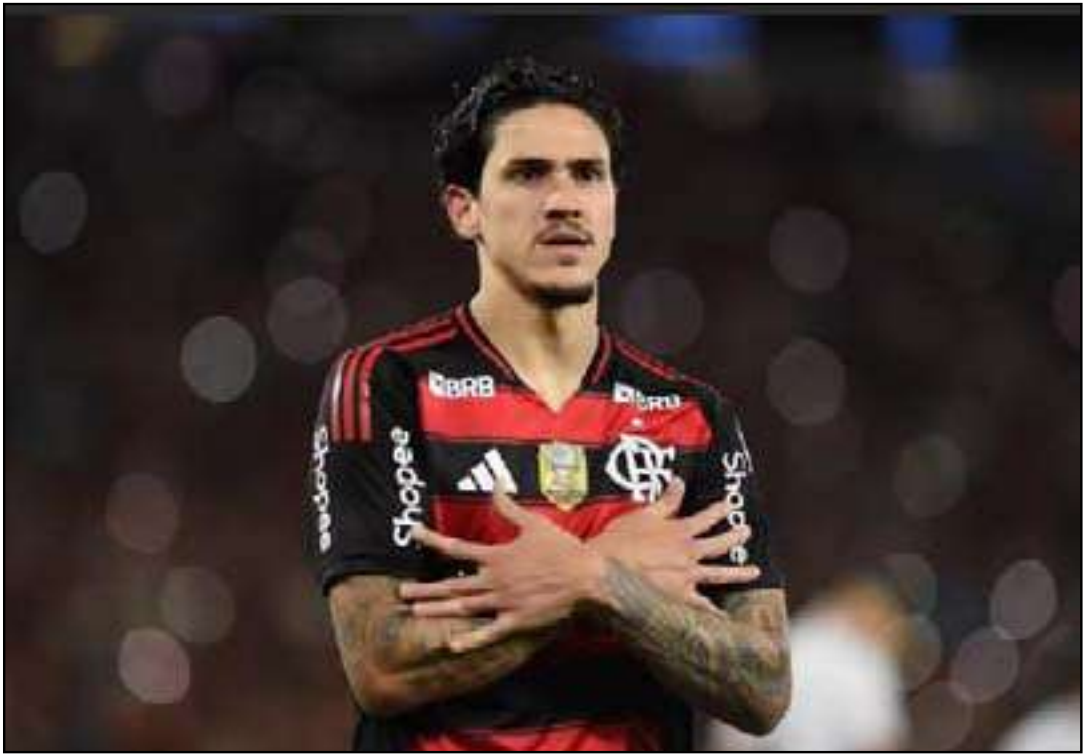
Jogador está em recuperação de uma lesão muscular na coxa

O Flamengo tem mais um treino nesta sexta-feira (12), o único com o elenco completo antes de enfrentar o time egípcio. Se avançar, o Rubro-Negro faz a final do Intercontinental contra o PSG na próxima quarta-feira.