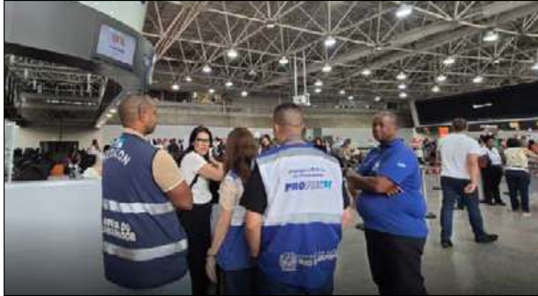
Equipes da SEDCON e do Procon-RJ acompanham a situação de passageiros afetados por cancelamentos e atrasos de voos