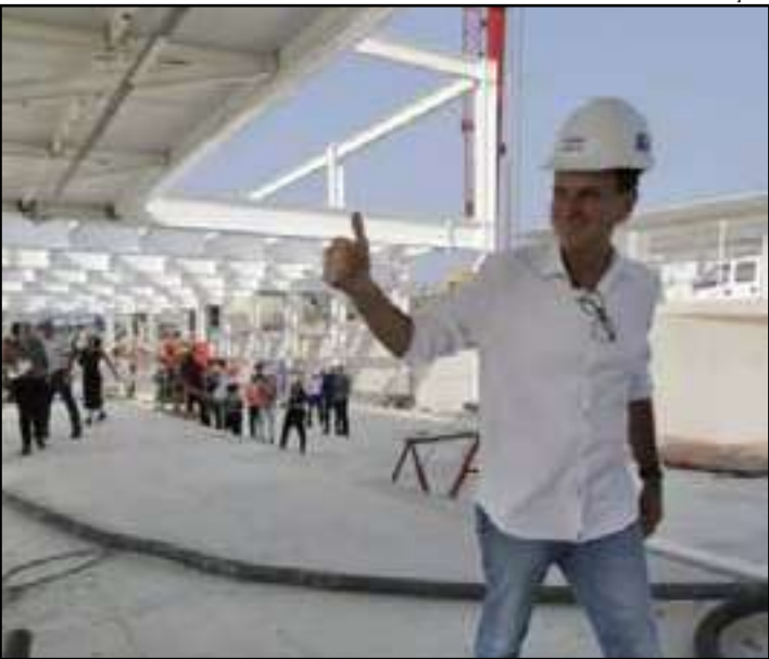
Para o prefeito Eduardo Paes, esses políticos seriam “pitbulls de coleira do CV”

Paes reiterou que a segurança é responsabilidade do Governo do Estado, não da Prefeitura, mas criticou a postura de alguns membros da classe política fluminense. “Eles adoram falar grosso, adoram falar desse jeito, mas na hora de bater firme no crime, de bater firme no Comando Vermelho, vão lá é para abaloiar o Comando Vermelho”, disparou o prefeito, defendendo que o combate ao crime deve ser feito com gestão e não apenas com palavras de ordem.