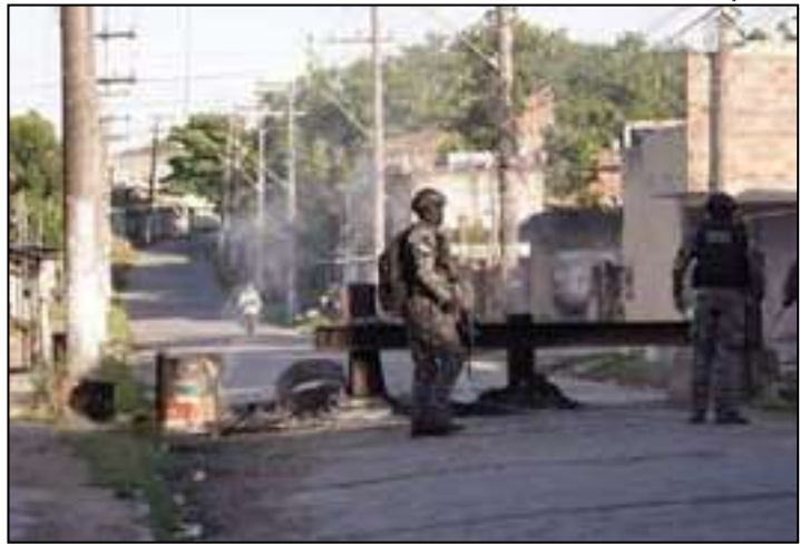
Policiais ocupam um dos pontos do complexo dominado por facção