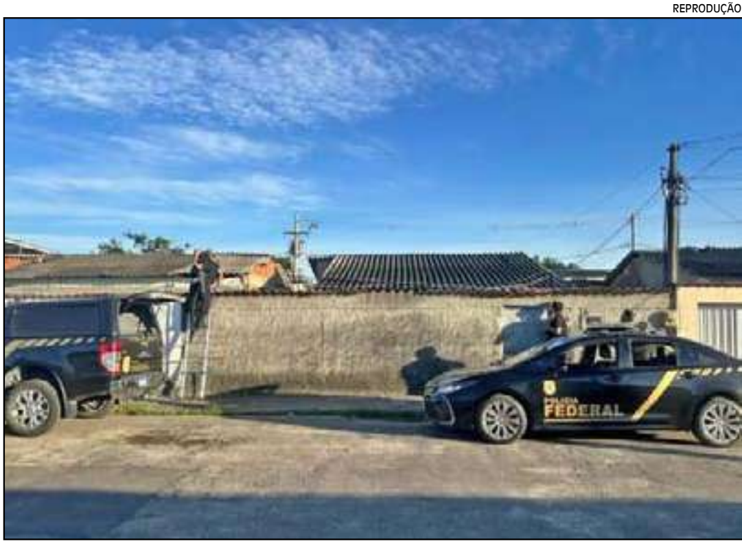
Agentes saíram para cumprir 7 mandados de busca e apreensão em Nova Iguaçu e Valença