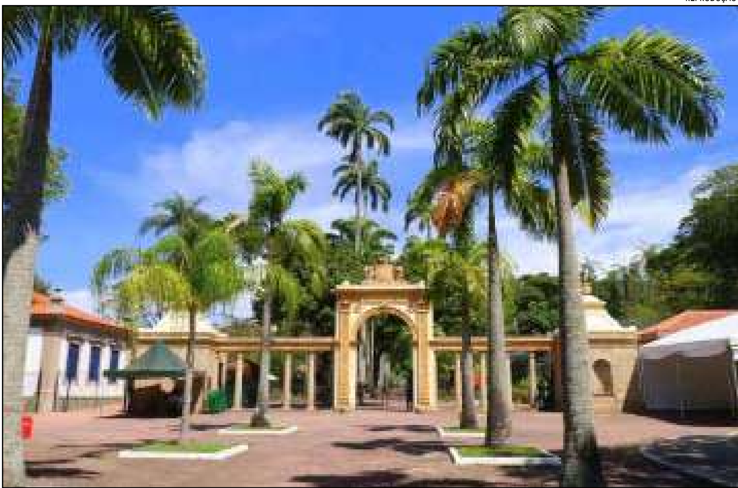
BioParque abriga cerca de 650 animais de 124 espécies

O BioParque do Rio segue em ritmo de Natal e oferece uma série de atividades educativas e lúdicas, reunindo experiências voltadas para crianças, famílias e amantes da natureza. Até 4 de dezembro o espaço conta com atrações, brincadeiras, oficinas e interação direta com o Bom Velhinho. No dia 12, o destaque é a Oficina Paper Toy, que convida os visitantes a construir brinquedos em papel inspirados em animais. A atividade estimula a criatividade e oferece uma forma divertida de conhecer mais sobre a biodiversidade, enquanto as famílias podem levar as criações para casa como lembrança do passeio. Já nos dias 13 e 14, além