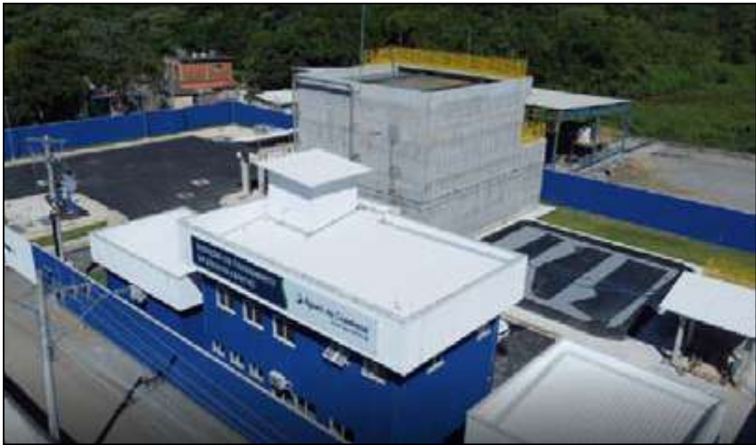
Estação de Tratamento de Esgoto de Paraíba do Sul, no Sul do do RJ

O projeto prevê ainda a construção de um segundo módulo da estação, que permitirá dobrar a capacidade total de tratamento para 5 milhões de litros