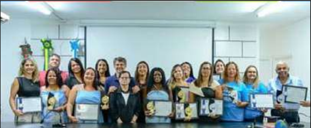
Cerimônia realizada na Câmara destacou o compromisso da rede municipal com a garantia da aprendizagem

A Prefeitura Municipal de Porto Real, por meio da Secretaria Municipal de Educação, Cultura e Turismo, realizou na manhã do dia 4 de dezembro, no Plenário da Câmara Municipal, a solenidade de outorga dos Selos Municipais Qualidade de Ensino da Educação Infantil e Compromisso com a Alfabetização. A cerimônia destacou o compromisso da rede municipal com a garantia da aprendizagem, o fortalecimento das políticas educacionais e o reconhecimento público das boas práticas desenvolvidas pelas escolas.