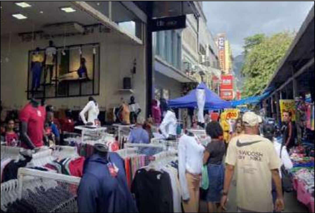
Bangu (foto), Campo Grande, Madureira, Tijuca e o Centro já estão na rota do choque de ordem

A Prefeitura do Rio começou na última quarta-feira (10) uma megaoperação de fim de ano para conter o comércio irregular e reorganizar áreas que tradicionalmente viram um caos às vésperas do Natal. Bangu, Campo Grande, Madureira, Tijuca e o Centro já estão na rota das ações, que vão até 31 de dezembro. A missão é liberar calçadas, coibir camelôs irregulares e evitar a desordem, principalmente, no período de maior movimentação nestas regiões de comércio de rua. A Secretaria de Or-