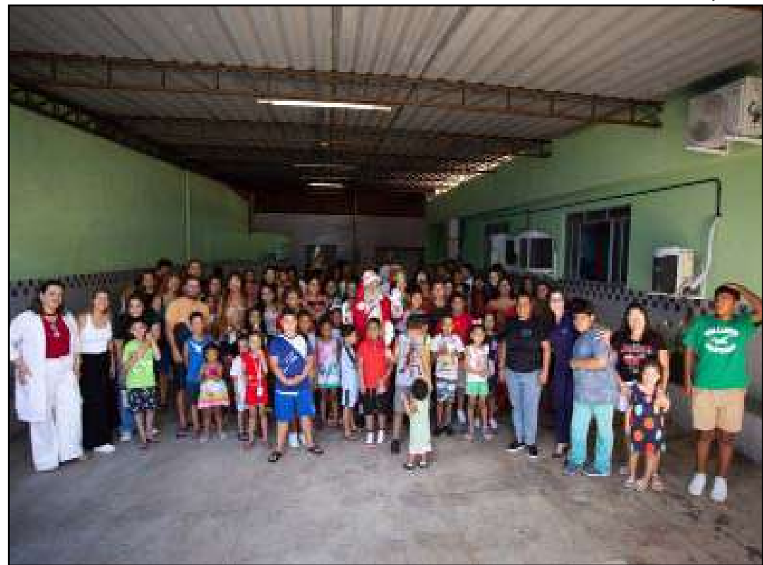
Papai Noel encantou os pequenos com fotos e lembrancinhas