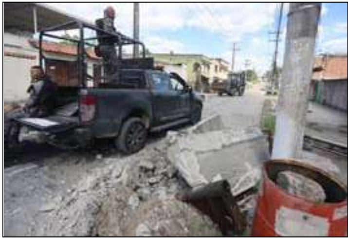
Polícia detalha estratégia da Operação Contenção para as equipes