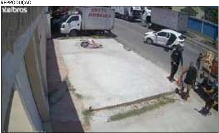
A abordagem, rápida e violenta, foi registrada por câmeras de segurança

Integrante do grupo de pagode Os Morenos, o cantor Gilmar PQD foi assaltado na tarde de ontem (11) na porta de casa, na Taquara, na Zona Oeste do