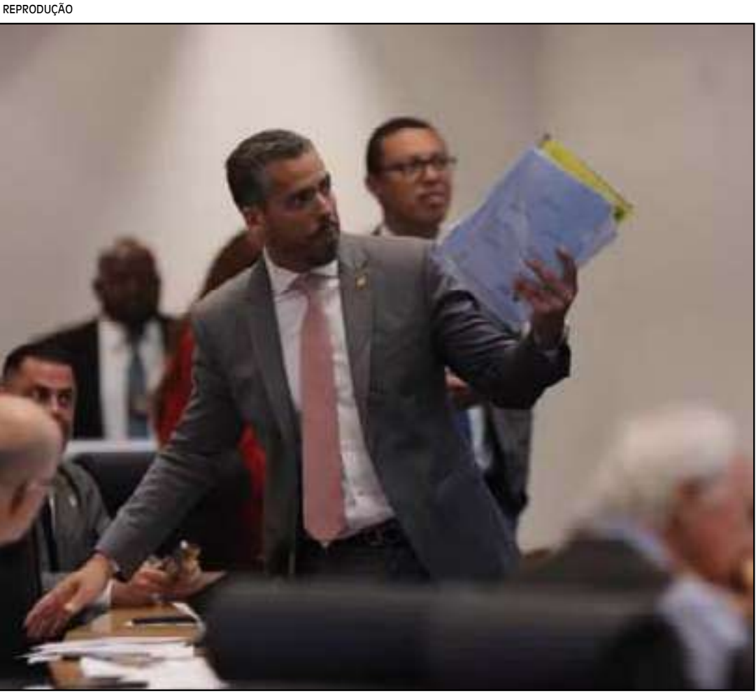
Aliado de Bacellar, Amorim nega orientação do deputado ou articulação do governo

na Câmara carioca. “Estou atendendo a uma missão maior”, afirmou Carlos Bolsonaro, reforçando que segue para Santa Catarina para cumprir o que chamou de “um chamado”. O segundo filho de Jair Bolsonaro (PL) adiantou que vai se mudar para o município de São José, na região metropolitana de Florianópolis, onde pretende montar base política e começar a alinhar os primeiros passos da pré-campanha com aliados locais e nacionais. A ideia é usar o período pré-eleitoral para cravar seu nome como candidato do bolsonarismo ao Senado por Santa Catarina em 2026. O movimento também dialoga com os planos do irmão, o senador Flávio Bolsonaro (PL). A estratégia do grupo é que Flávio deixe o Senado para disputar a Presidência da República em 2026 como o nome do PL, abrindo espaço para que Carlos Bolsonaro tente ocupar a vaga catarinense no Senado. Em sua fala de despedida na Câmara do Rio, o vereador agradeceu o período em que exerceu o mandato e sinalizou que a saída não representa um afastamento definitivo da política, mas uma nova etapa.