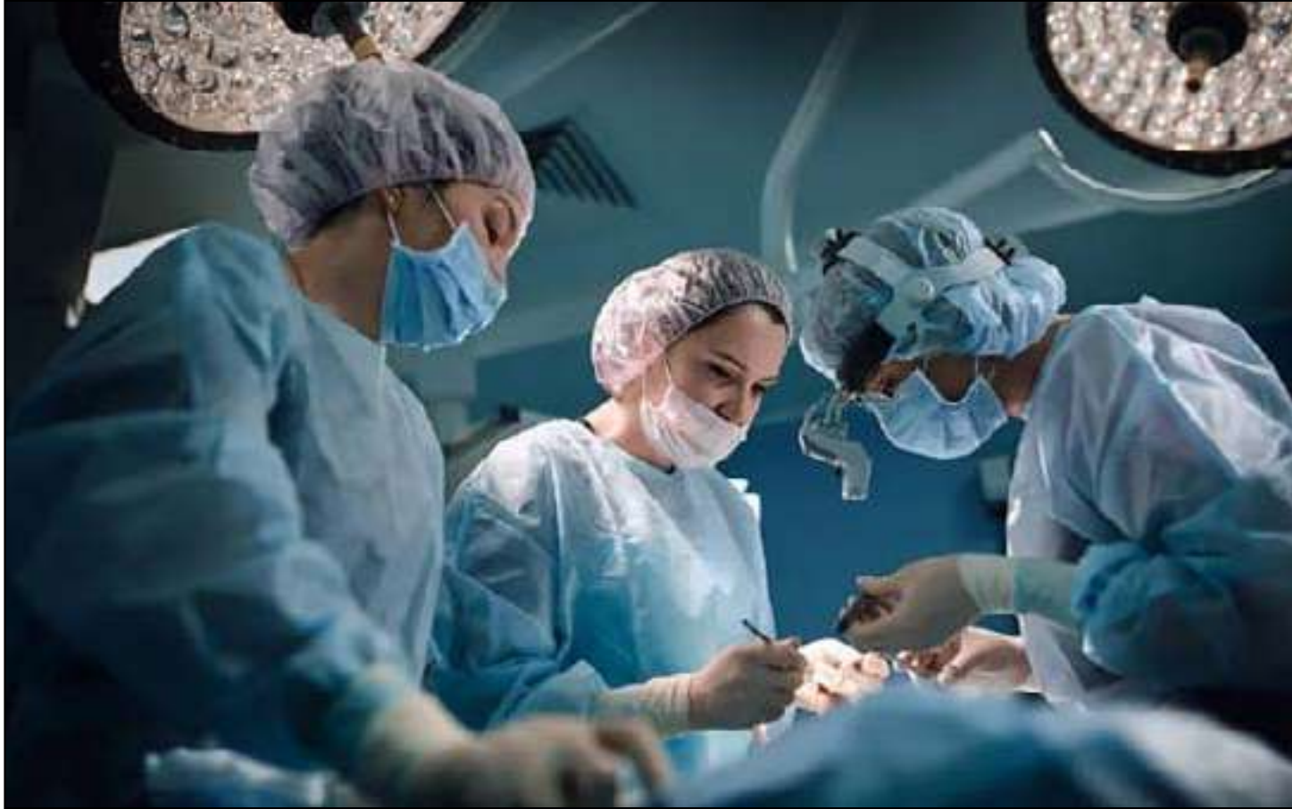
Objetivo é desafogar a demanda reprimida por cirurgias

agendados. Somente as 134 Santas Casas de Misericórdia e hospitais filantrópicos realizarão mais de 9 mil cirurgias, com o envolvimento das unidades localizadas em Alagoas (AL), Bahia (BA), Ceará (CE), Goiás (GO), Minas Gerais (MG), Mato Grosso do Sul (MS), Pará (PA), Paraíba (PB), Pernambuco (PE), Piauí (PI), Paraná (PR), Rio de Janeiro (RJ), Rio Grande do Norte (RN), Rio Grande do Sul (RS), Santa Catarina (SC), Sergipe (SE), São Paulo (SP) e Tocantins (TO). Entre as cirurgias oferecidas estão: bariátrica por videolaparoscopia, colecistostomia, plástica abdominal, hernioplastia e vasectomia.