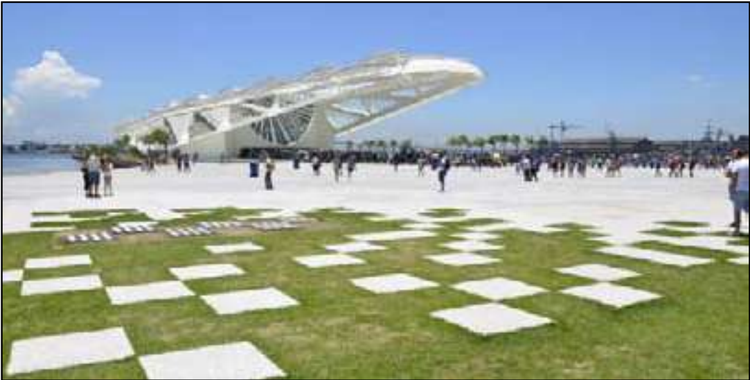
Museu oferece entrada gratuita no dia 17

O Museu do Amanhã começou a celebrar seus 10 anos de existência com a reinauguração da exposição “Do Cosmos a Nós”, uma das mais emblemáticas de seu acervo. Símbolo da revitalização da Zona Portuária do Rio, a instituição completa uma década no dia 17 de dezembro e programou uma série de atividades para marcar a data. A mostra voltou ao circuito com uma nova vídeo-instalação criada pelo diretor Estevão Ciavatta. A obra, totalmente imersiva, conduz o visitante a refletir sobre os principais desafios ambientais do planeta, destacando os impactos da ação humana e as consequências que