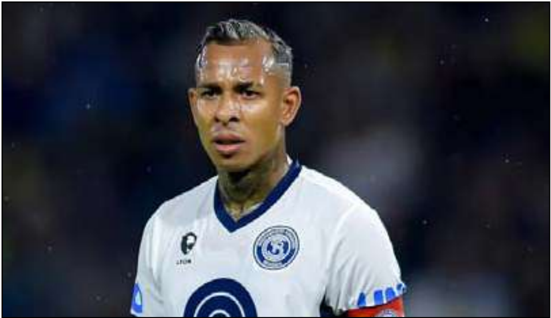
Colombiano foi revelado pelo Tolima

As partes conseguiram se acertar e será desembolsado pela contratação do atacante a quantia de 8,5 milhões de dólares (cerca de 46 milhões de reais na cotação atual), com chegada prevista