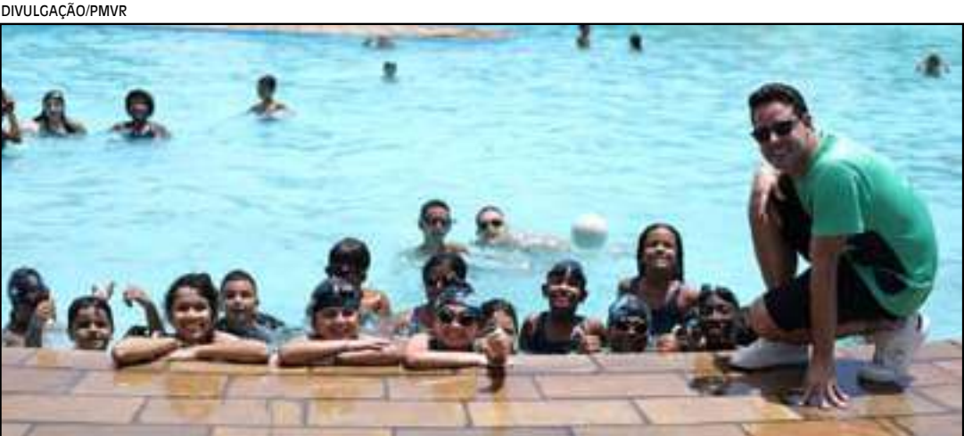
O medalhista olímpico Thiago Pereira acompanhou de perto as atividades e interagiu com os alunos

O Parque Aquático Municipal de Volta Redonda, na Ilha São João, foi palco ontem (12) da confraternização de encerramento das atividades do projeto “Nadando com Thiago Pereira”, que reuniu alunos, familiares e equipe técnica para celebrar mais um ano de aprendizado e convivência. O evento contou com a presença especial do maior medalhista da história dos Jogos Pan-Americanos, medalhista de prata nas Olimpíadas de Londres 2012 e idealizador do projeto, Thiago Pereira, que acompanhou de perto as atividades e interagiu com os alunos. “Estamos encerrando mais um ano, muito feliz de estar aqui com essa criançada. A gente vai começar um novo projeto em outra cidade a partir do ano que vem, em São Paulo. É um projeto que eu espero que outros nadadores comecem a fazer, porque a gente sabe da importância do salvamento aquático, da natação e do esporte na vida das pessoas. É um orgulho