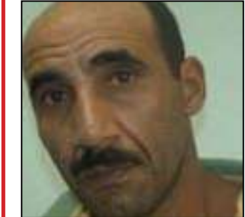
Traficante Rabicó está mira de operações contra o CV

Na última quinta-feira (11), mil homens das Polícias Militar e Civil foram mobilizados para realizar a Operação Contenção, no Complexo do Salgueiro, em São Gonçalo, na Região Metropolitana do Rio. Os agentes foram recebidos a tiros e bar-