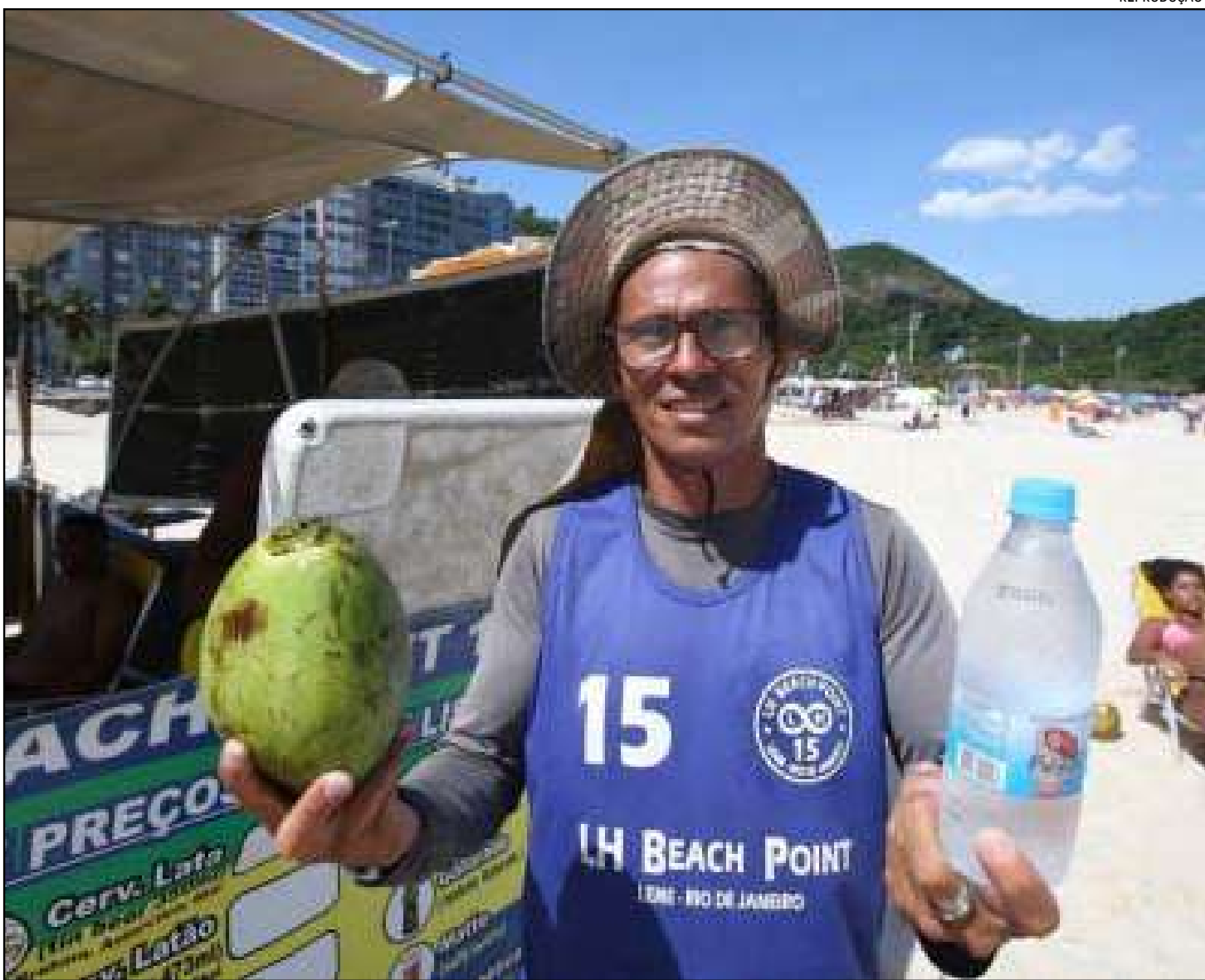
Permissão para venda será válida até as 20h do dia 1º de janeiro

A Prefeitura do Rio divulgou as regras para os ambulantes que vão atuar durante o réveillon na orla de Copacabana e do Leme, na Zona Sul. De acordo com a Resolução 632/2025, publicada no Diário Oficial, poderão ser credenciados até dois mil vendedores para o evento. O cadastramento será realizado pela empresa vencedora do caderno de encargos da Riotur, que irá definir ainda a quantidade e a localização dos postos de abastecimento. A autorização para comercialização será válida das 10h do dia 31 de dezembro até as 20h do