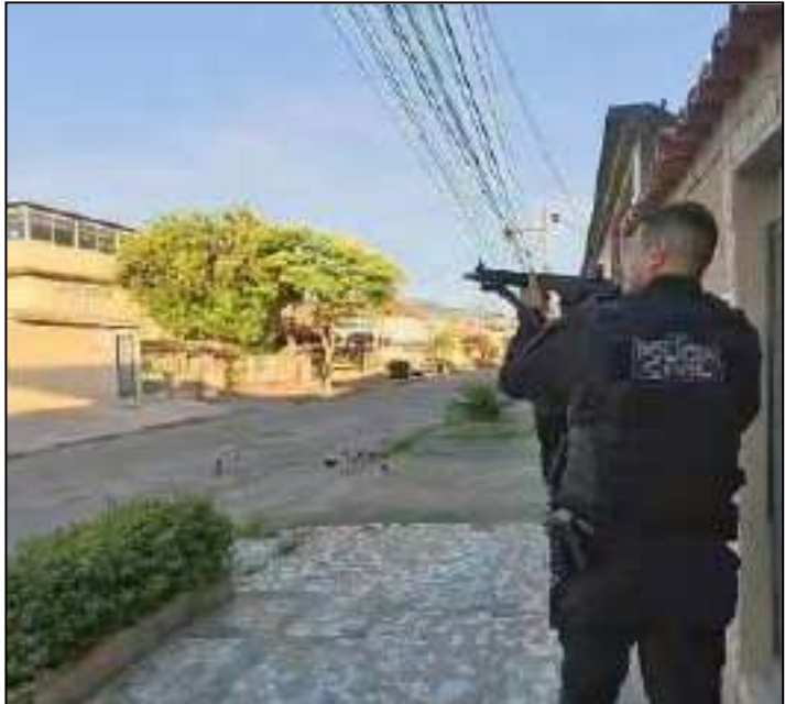
Na mira: policial se posiciona estrategicamente em ponto de Anchieta

A polícia monitorou a quadrilha por mais de um ano e identificou um esquema de lavagem de dinheiro do tráfico com