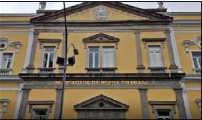
O Centro de Documentação e Pesquisa foi transferido para o Museu da Casa da Moeda

A Fundação Nacional das Artes (Funarte), vinculada ao Ministério da Cultura, está em contagem regressiva para inauguração oficial da nova sede do Centro de Documentação e Pesquisa (Cedoc), transferida para o Museu da Casa da Moeda do Brasil, na Praça da República. A cerimônia, marcada para o dia 27 de março de 2026, marcará a abertura da exposição Ocupação Grande Othello, em parceria com o Itaú