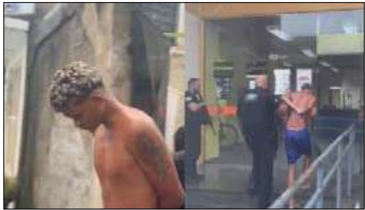
Criminoso exercia papel estratégico dentro da facção

Segundo as investigações, o traficante respon-