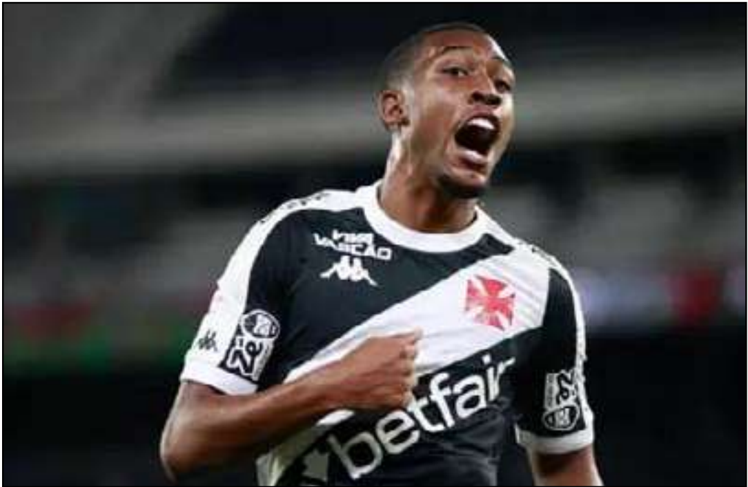
Expectativa é algo em torno de 50 milhões de euros

desde a base. Com a saída de Endrick por empréstimo para o Lyon, da França, em janeiro, o clube espanhol busca um novo nome para o lugar. Existe dúvida também quanto ao futuro do camisa 9, enquanto o atacante do Vasco já é visto pronto para atuar. Internamente, há a expectativa que o Real Madrid ofereça algo em torno de 50 milhões de euros (R$ 318,4 milhões) por Rayan. O clube espanhol acredita no seu potencial para o futuro e que ele terá capacidade para se adaptar rapidamente ao futebol europeu, diferentemente de Endrick. O Real Madrid não é o único interessado em Rayan, mas parece ser o favorito na disputa. Além do gigante espanhol, outros clubes monitoram o jogador do Vasco, entre eles o Arsenal e Chelsea, da Inglaterra, o Barcelona, também da Espanha, e a Inter de Milão, da Itália. Na atual temporada, Rayan marcou 20 gols