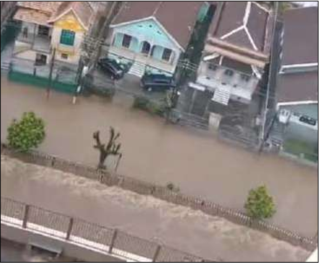
Ruas do Centro da cidade ficaram submersas com o forte temporal