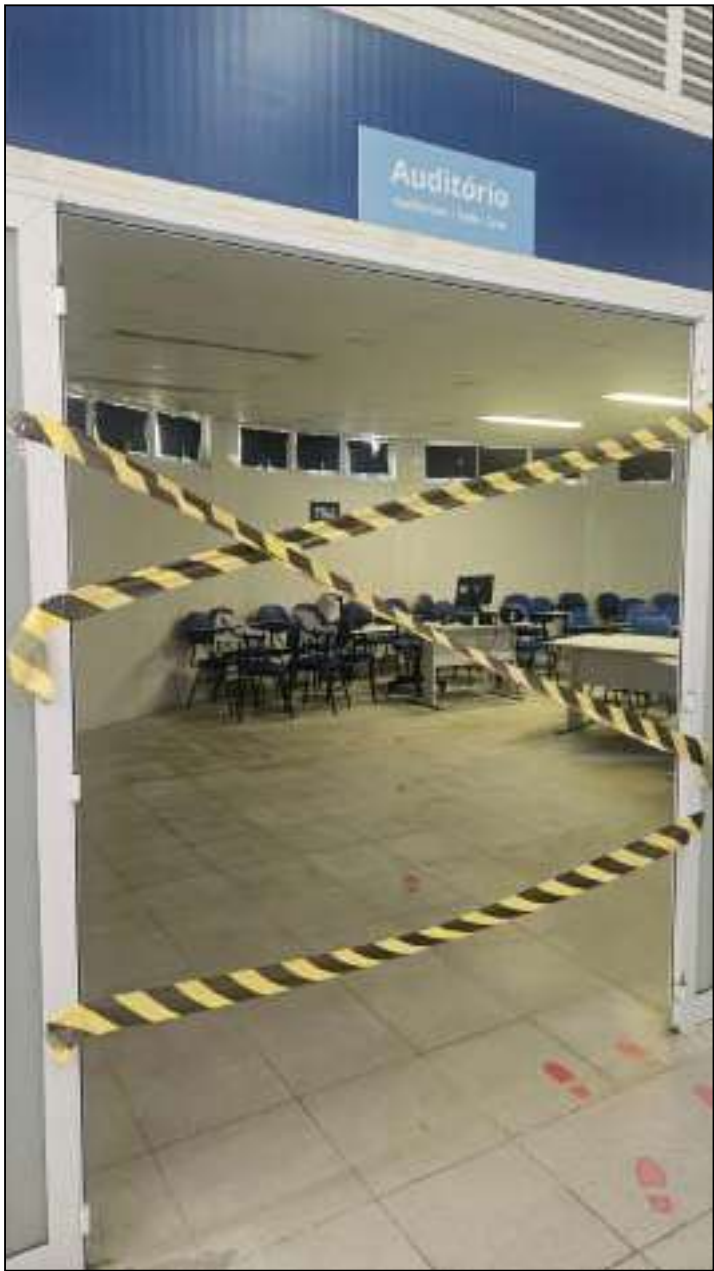
Unidade de saúde teve portas, TV e equipamentos furtados