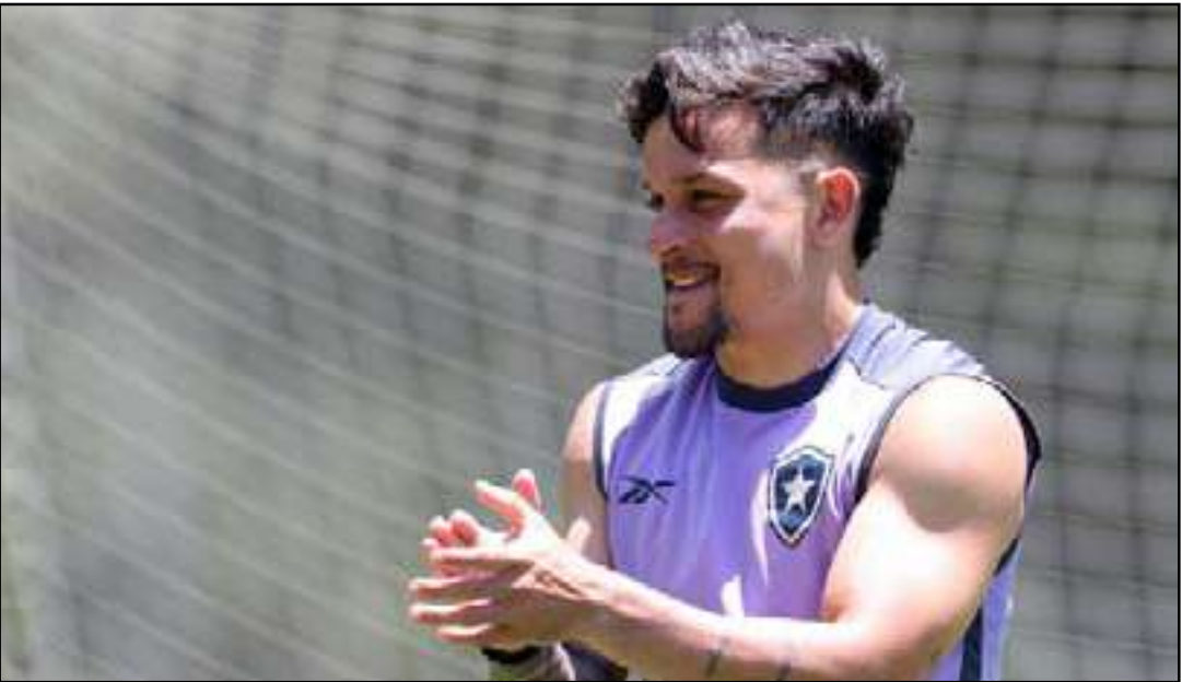
Alvinegro tem dívida com o jogador