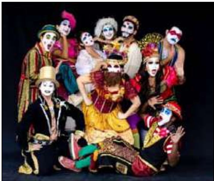
Espectáculo será apresentado ao ar livre, às 20h