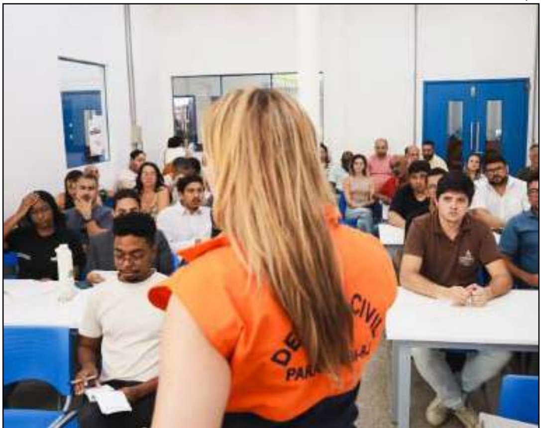
Foco é a prevenção de enchentes e redução de riscos

A iniciativa integra o conjunto de ações do programa Paracambi mais Resiliente, que tem como principal foco a prevenção de enchentes, a redução de riscos e a mitigação de desastres naturais no município,