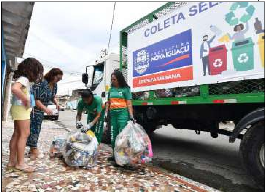
Coleta funciona de segunda a sábado

síduos enviados ao aterro sanitário e evita a poluição do solo, da água e do ar. A coleta funciona de segunda a sábado, das 7h às 15h, conforme o cronograma por bairro.