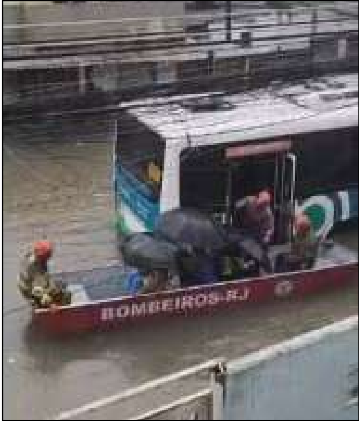
Embarcação do Corpo de Bombeiros resgata passageiros do ônibus

Os passageiros de um ônibus precisaram ser resgatados de bote do Corpo de Bombeiros no meio de um alagamento na Rua Camaipi, em Campo Grande, na Zona Oeste do Rio, durante a madrugada de ontem (17), quando uma frente fria chegou trazendo muita chuva. Os