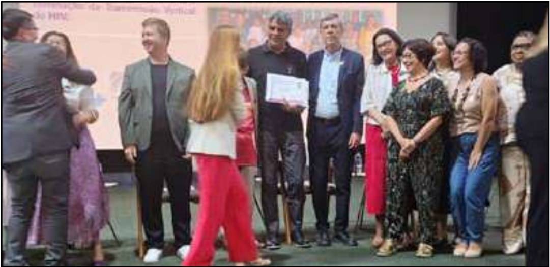
Cidade é a primeira da Baixada a conquistar esse reconhecimento

Neste ano, apenas três cidades fluminenses foram contempladas com a certificação: Mesquita, Teresópolis e Volta Redonda. No total, 59 municípios brasileiros foram