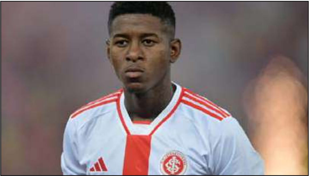
Internacional rejeitou a proposta do Flamengo

porada. No início do ano, o Flamengo não entrou em acordo com o Inter e abriu mão da negociação. A ideia era pagar 6 milhões de euros e perdoar a dívida de 4 milhões de euros que o Colorado tinha pela contratação de Thiago Maia. O clube gaúcho não aceitou, e a postura irritou a diretoria rubro-negra, que, ao longo do ano, fez cobranças públicas ao Colorado pelo não pagamento do volante. Os mesmos 10 milhões de euros (R$ 62 milhões) são pedidos neste momento. O Flamengo definiu