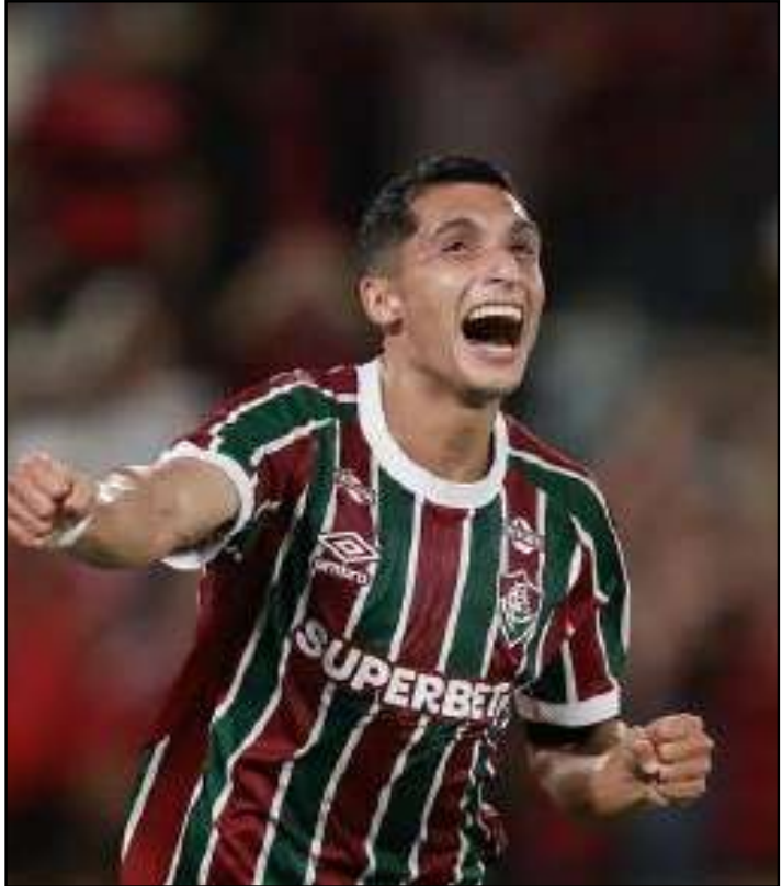
Atacante apresentou 21 participações em gols nesta temporada

Isso porque o atacante apresentou 21 participações em gols nesta temporada. Ele é o líder ao lado de Germán Cano. Serna, inclusive, se aproxima de duplo-duplo,