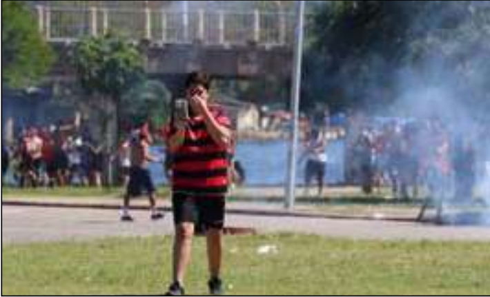
A polícia precisou usar gás de pimenta para conter os torcedores

A manifestação de torcedores do Flamengo durante o embarque da equipe para o Intercontinental de clubes no Catarterminou com confusão ontem (6). No fim do “AeroFla”, eles tentaram romper a barreira e invadir a área isolada próxima ao terminal de cargas do Aeroporto Internacional Tom Jobim (Galeão), por onde a delegação