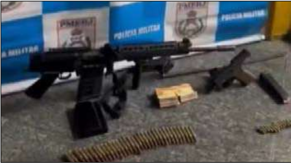
O PM Edinei Silva de Andrade estava em um carro com marcas de tiros e carregava armas com numeração raspada

A prisão aconteceu por volta das 3h, após um tiroteio na região. O PM estava em um carro com marcas de tiros e carregava armas com numeração raspada, além de R$ 2,8 mil em espécie. Ele foi levado para a delegacia de Niterói.