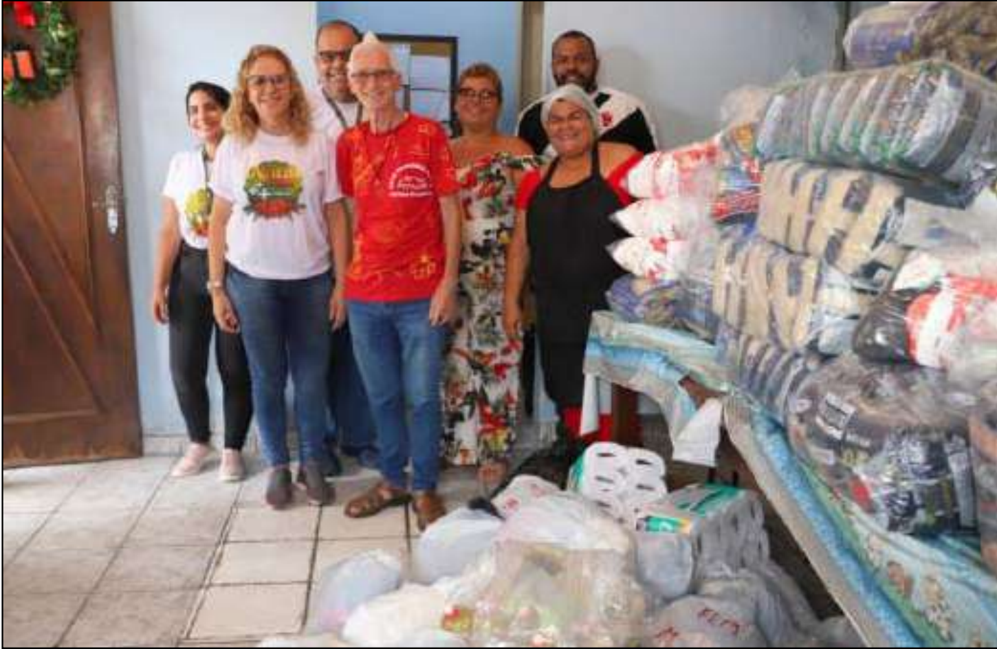
Doações podem ser feitas em Meriti e Seropédica

2025, a expectativa da empresa é superar esses números e ampliar ainda mais o impacto social da iniciativa.