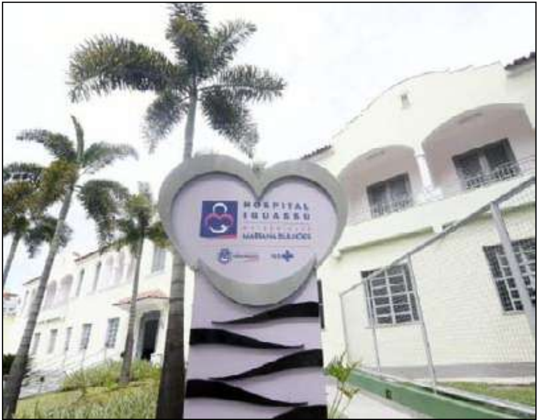
Unidade recebeu sua primeira certificação em 2004

A IHAC, criada pela Organização Mundial da Saúde (OMS) e pelo Unicef, reconhece instituições que adotam práticas baseadas em evidências para garantir um início de vida mais saudável aos recém-nascidos. De acordo com o Ministério da Saúde, a amamentação pode reduzir em até 13% as mortes de crianças menores de cinco anos por causas evitáveis, além de prevenir obesidade, hipertensão, diabetes, infecções e alergias. A recomendação é de aleitamento materno exclusivo até os seis meses e complementar até pelo menos os dois anos.