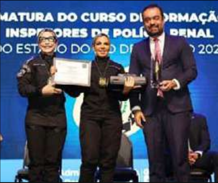
Cerimônia foi realizada no Espaço Hall, na Barra da Tijuca

O Governo do Rio de Janeiro formou ontem (8), 276 novos policiais penais em cerimônia realizada no Espaço Hall, na Barra da Tijuca. O reforço