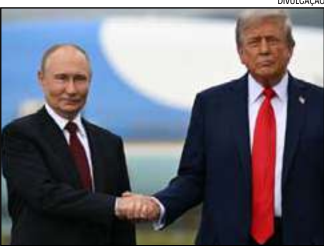
Peskov disse concordar com estratégia americana

A Rússia defendeu a nova estratégia de segurança nacional dos Estados Unidos, baseada na abordagem nacionalista do presidente americano, Donald Trump, e disse que ela está “globalmente em conformidade” com a visão de mundo de Moscou. “Os ajustes que observamos, eu diria, estão globalmente em conformidade com a nossa visão”, declarou o porta-voz do Kremlin, Dmitri Peskov, em entrevista à televisão pública Rossia, referindo-se ao documento. Peskov disse esperar que a nova estratégia americana “possa constituir uma garantia modesta para a capacidade de continuar de forma construtiva o trabalho conjunto para encontrar uma solução pacífica na Ucrânia”. O documento publicado pelo governo Trump na última sexta-feira (5) redefine a estratégia de seguran-