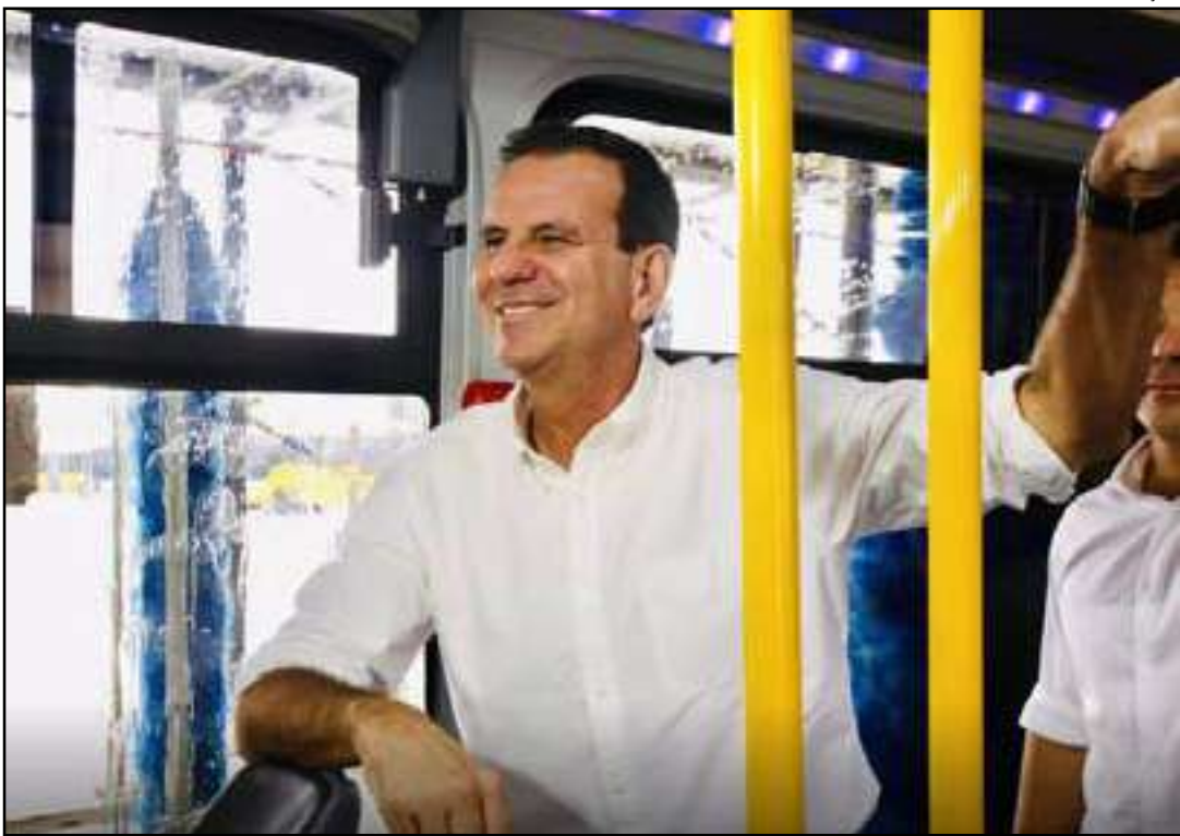
Prefeito Eduardo Paes é acusado de ataques públicos em entrevistas, vídeos e postagens nas redes sociais

Na petição, Riocard e Riopar sustentam que Paes teria desencadeado uma espécie de campanha pública para desacreditizar o antigo sistema de bilhetagem eletrônico, substituído pelo cartão municipal Jaé. Segundo as empresas, o prefeito teria associado a bilhetagem anterior a práticas “nada republicanas”, colocando em dúvida a lisura da atuação do gru-