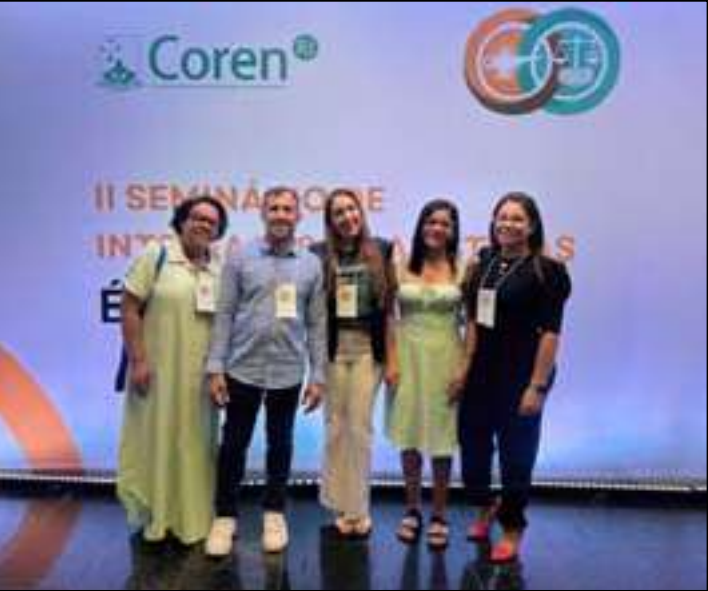
O município também elegeu a primeira Comissão de Ética em Enfermagem do Hospital Municipal