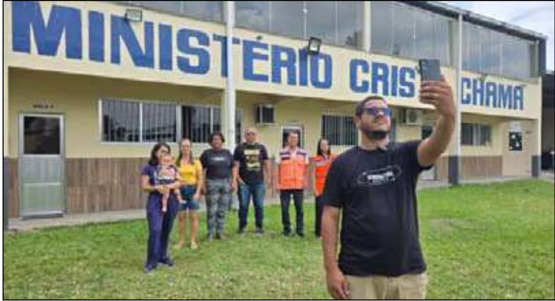
Um dos pontos de apoio é a Igreja Missionária Ministério Cristo Chama

A Prefeitura de Nova Iguaçu realizou, na última sexta-feira (5), o último Exercício Simulado de Mobilização dos Pontos de Apoio. A ação, promovida pela Secretaria Municipal de Defesa Civil (SMDC), em parceria com as secretarias municipais de Assistência Social (SEMAS) e de Educação (SEMED), além de templos religiosos da cidade, visa preparar para a evacuação em segurança os moradores de áreas com maior risco de serem afetadas pelas chuvas de verão. O teste marcou também a celebração ao Dia Internacional do Voluntário, comemorado