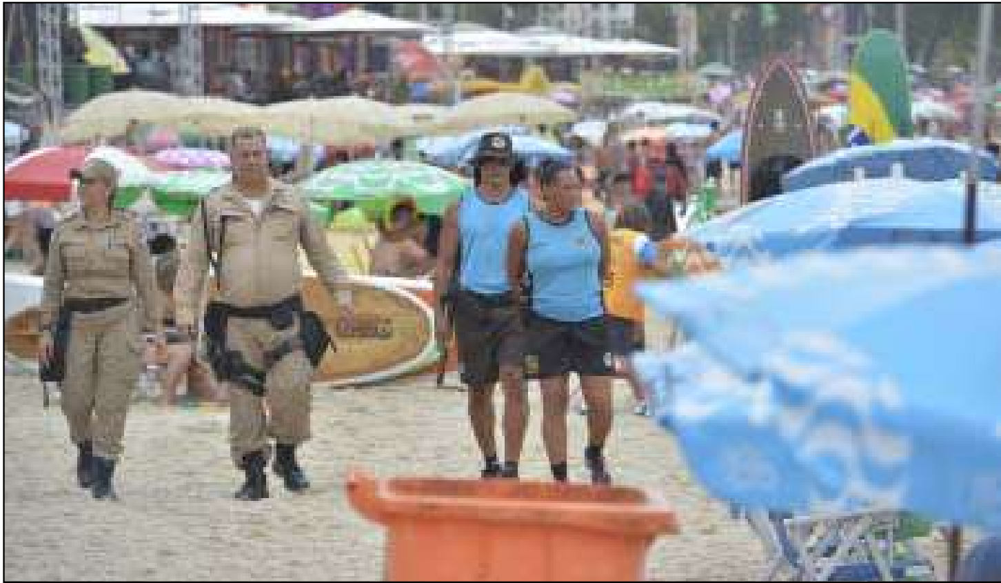
Equipes ainda removeram 50 veículos estacionados

ções e Resiliência para orientar agentes que estavam nas ruas. A Guarda Municipal aplicou mais de 110 mil multas de trânsito por diversas irregularidades de trânsito em toda a cidade desde o dia 5 de setembro. Nesse período, os agentes envolvidos na operação distribuíram mais de 12 mil pulseiras de identificação nas praias e também nos parques da cidade. Graças a esse serviço, foi possível realizar o reencontro de mais de 39 crianças e adolescentes com seus responsáveis. Além da orla nas zonas Sul e Sudoeste, a Operação Verão também é realizada no Parque Madureira Mestre Monarco, Parque Radical de Deodoro, Parque Oeste, Parque Realengo Jornalista Susana Naspolini, Parque Olímpico Rita Lee e o Parque Carioca da Pavuna; além da orla da Ilha do Governador e a Ilha de Paquetá. A ação envolve as Secretarias de Ordem Pública (SEOP), CET-Rio, Guarda Municipal e Secretaria Municipal de Transportes.