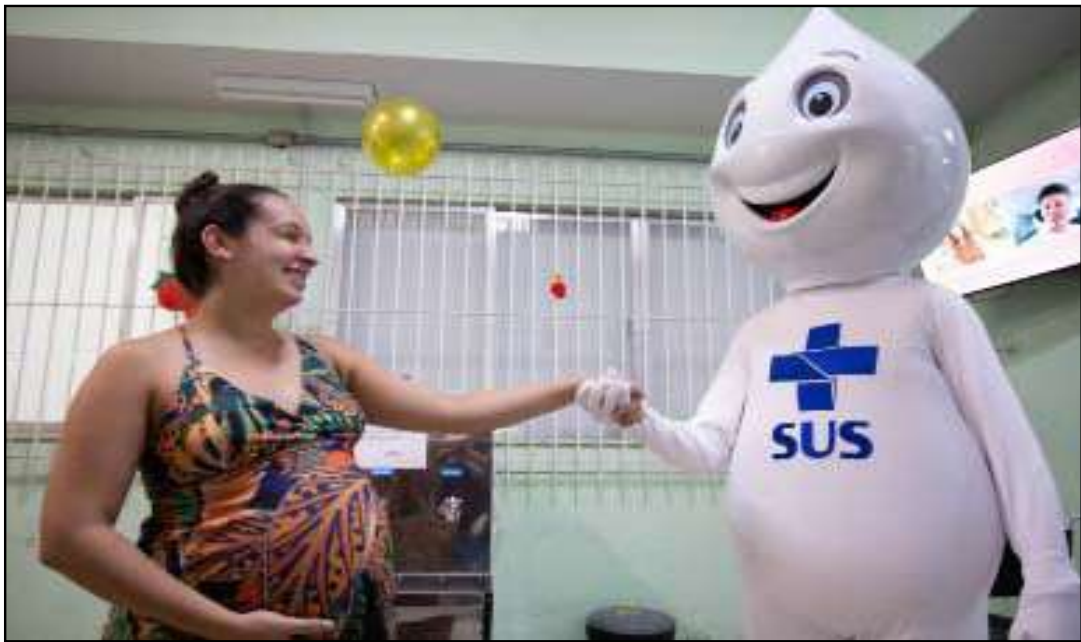
Gestantes a partir da 28ª semana já contam com a vacina contra o VSR

sos, segundo o Ministério da Saúde, decorre de infecção viral, e não existe um tratamento específico para