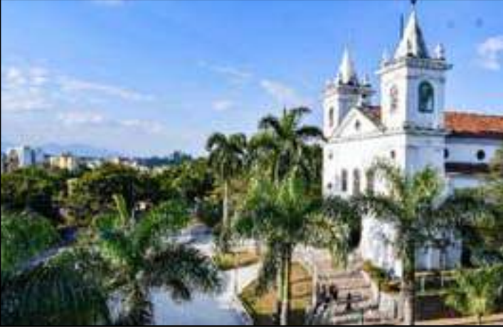
Comemoração pelo Dia de Nossa Senhora da Conceição teve programação religiosa e atrações musicais

Mais uma edição da tradicional Festa da Padroeira de Resende, Nossa Senhora da Imaculada Conceição, foi realizada na Praça da Igreja Matriz, localizada no Centro Histórico. Promovida pela Paróquia Nossa Senhora da Conceição, a festividade, que começou no último sábado (6) e terminou ontem (8), dia em que se celebra a santa, contou com apoio da Prefeitura Municipal de Resende, que ofereceu segurança e infraestrutura para a realização do evento. A data é feriado municipal, segun-