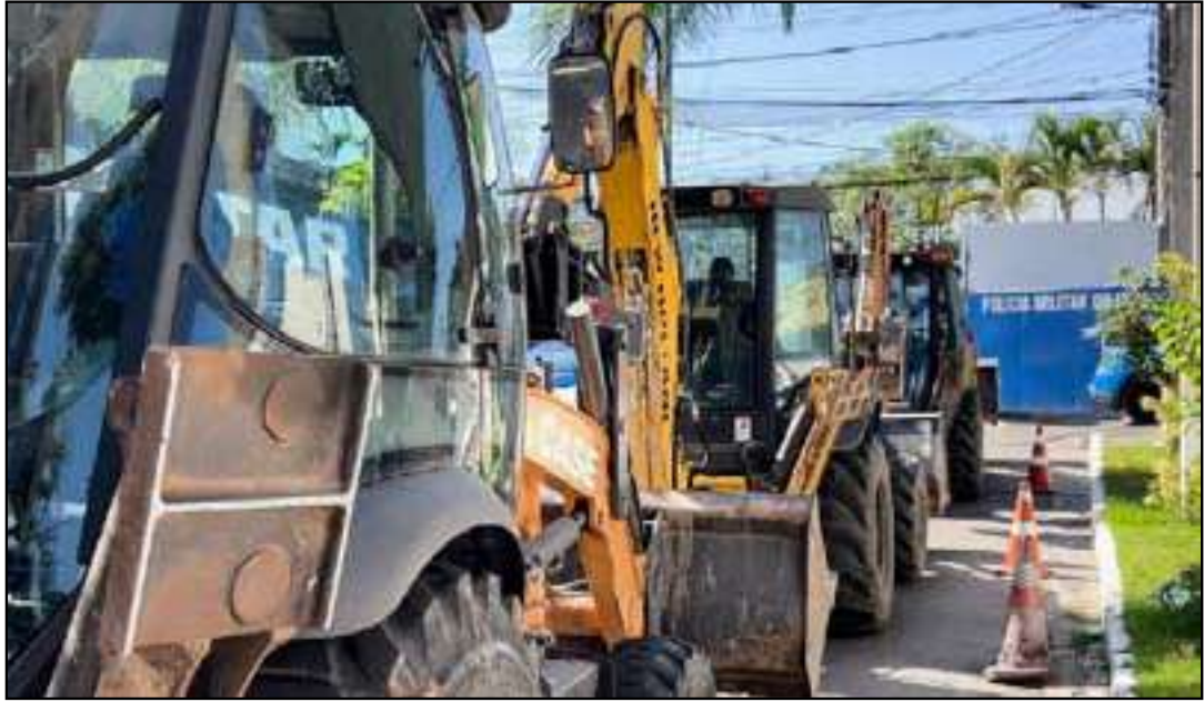
Esforço é um conjunto entre o Estado e prefeituras