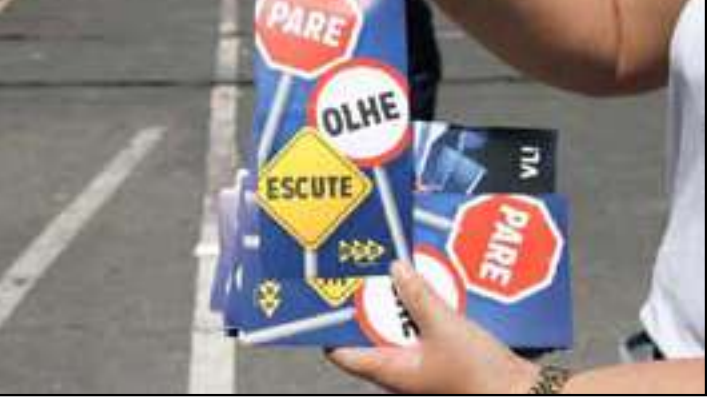
Equipes vão distribuir panfletos informativos e orientação direta aos pedestres e motoristas

lização de mais uma campanha de conscientização para reforçar a segurança nas passagens de nível da linha férrea. A ação é pro-