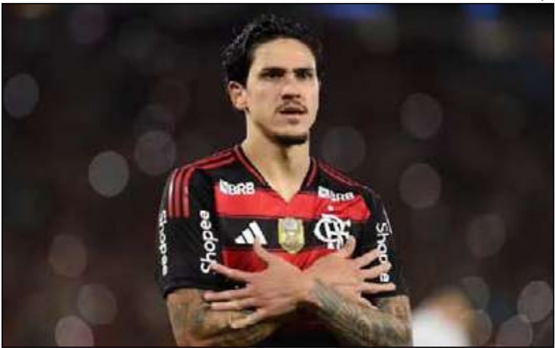
Camisa 9 tem feito atividades específicas dentro de campo

mids (EGI), pela Copa Challenger (equivalente à semifinal), em 13 de dezembro. Um possível duelo entre Flamengo e Paris Saint-Germain só poderá acontecer no dia 17, em Doha, valendo o título. Pelo atual formato da Copa Intercontinental, o representante da Uefa disputará apenas uma partida: justamente a final. Ainda durante o processo de consolidação da fratura no antebraço direito sofrida contra o Racing, pela semifinal da CONMEBOL Libertadores, Pedro sofreu