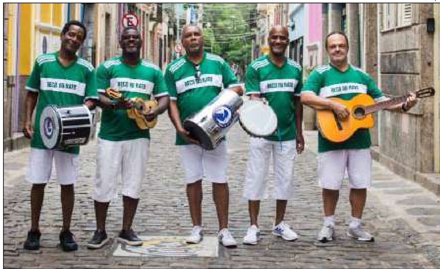
Evento contará com espaço gastronômico reunindo diversos bares

Entre os destaques confirmados estão nomes consagrados como Jorge Aragão, Marquinho