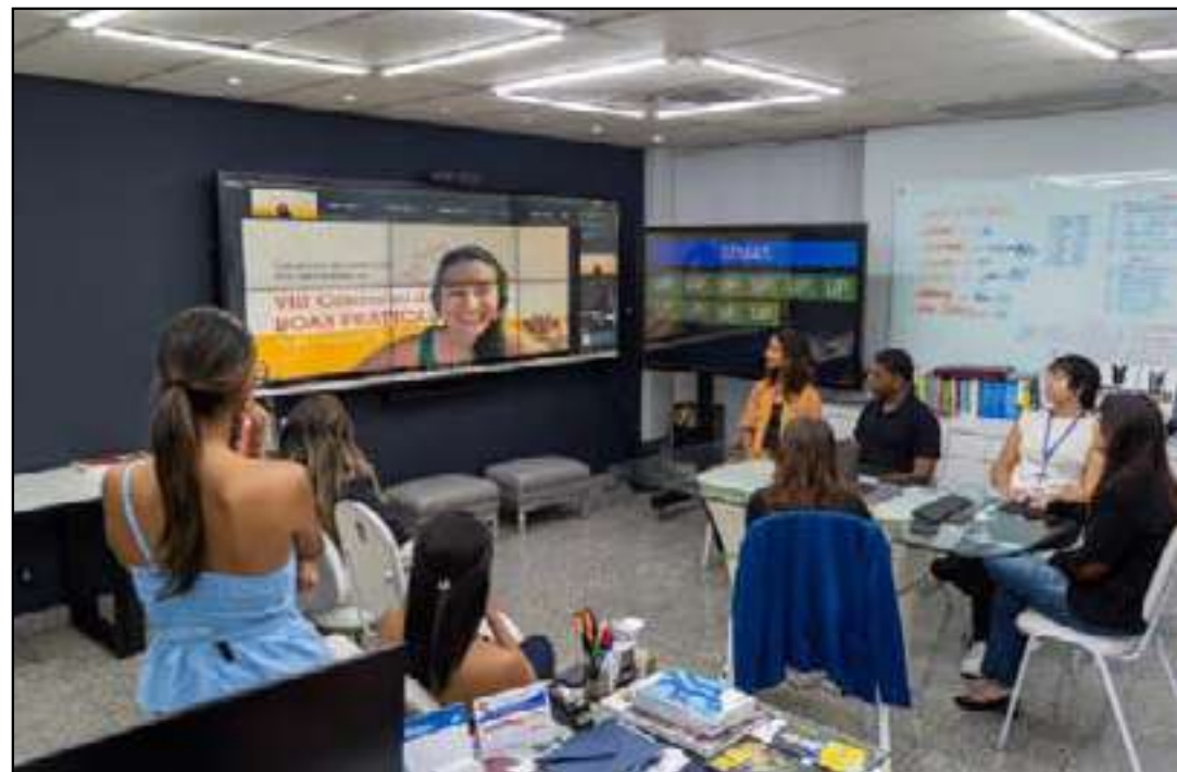
Projeto une tecnologia e ações presenciais em espaços públicos

O concurso, organizado pela Rede Nacional de Ouvidorias, também registrou número recorde de participantes, com 112 canais de instituições públicas de todo o país concorrendo em diferentes categorias.