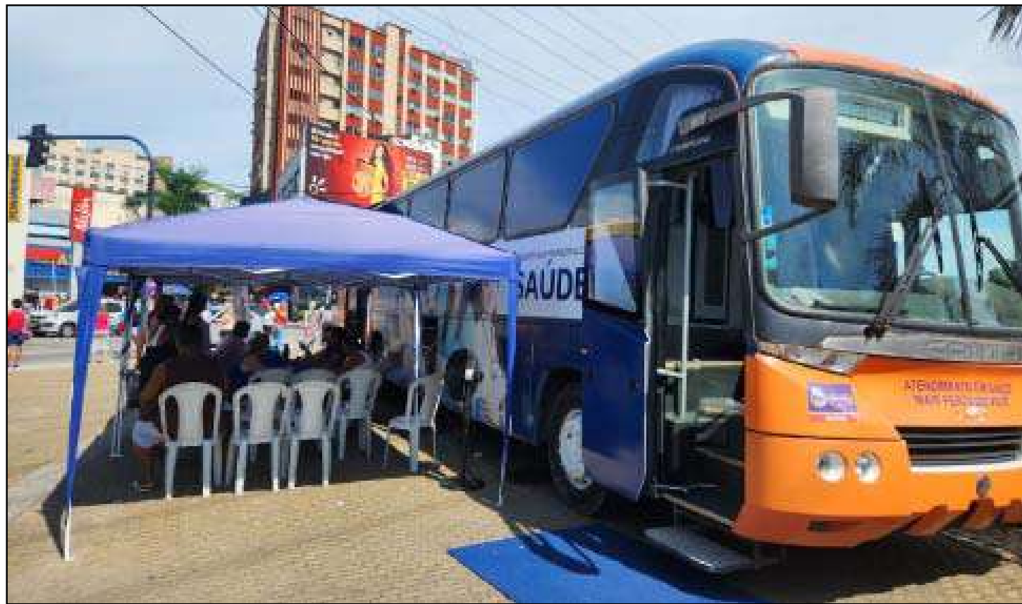
Escolha do local é considerada estratégica