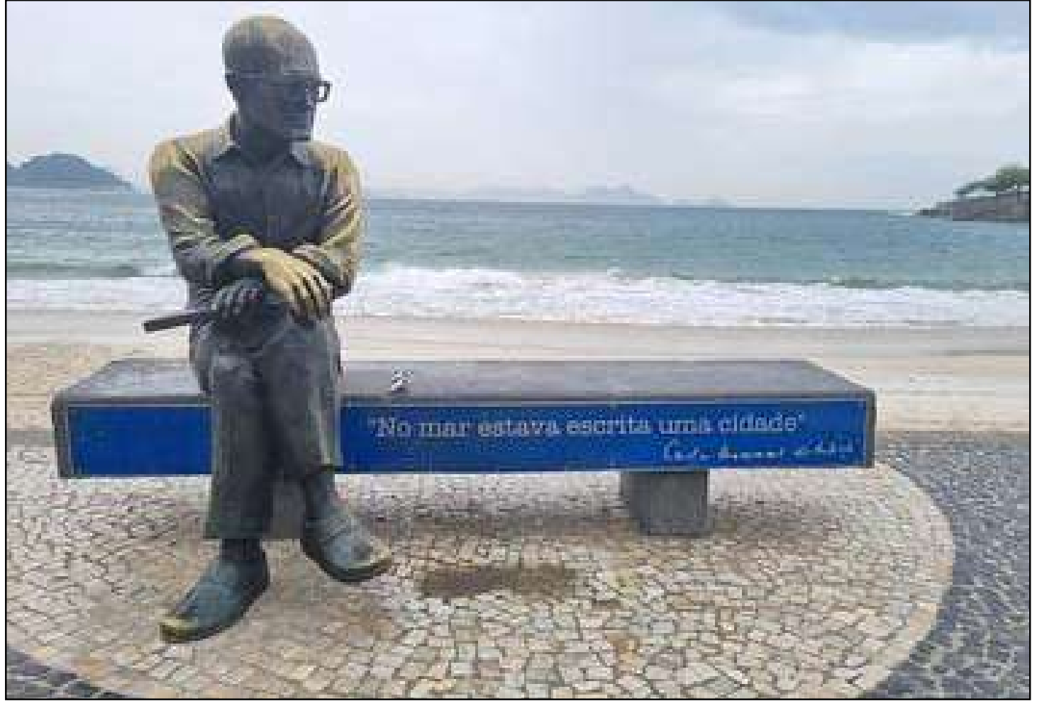
Pelo menos cinco monumentos já foram alvo de depredação neste ano

Pelo menos cinco monumentos já foram alvo de depredação neste ano, se-