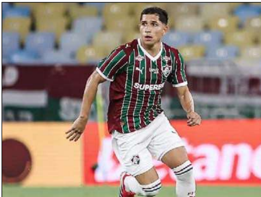
Venezuelano se torna principal opção ofensiva para Zubeldía