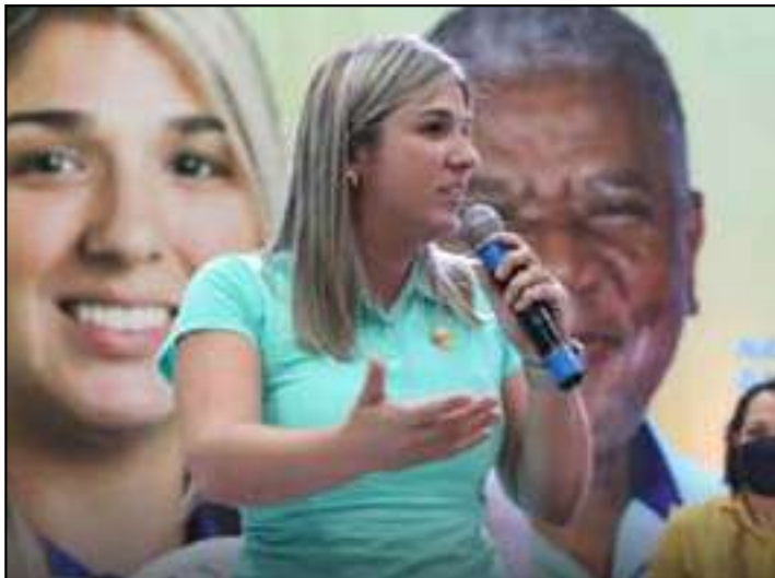
Decisão contra gestão de Marina Rocha atende a uma ação civil pública do MPRJ

A Justiça do Rio de Janeiro determinou o bloqueio de R$ 8,6 milhões em bens e contas da prefeita de Guapimirim, Marina Rocha (Agir), e de outros cinco investigados por suspeita de fraude em licitações na rede municipal de saúde.