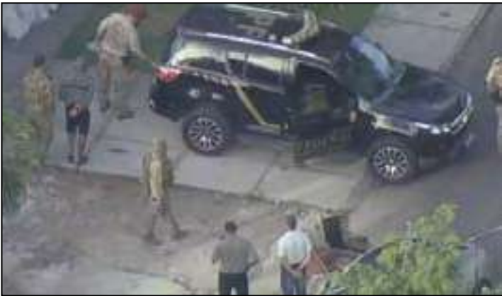
MC Poze é preso em casa no Recreio, na Zona Sudoeste do Rio