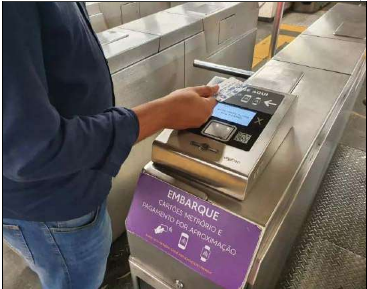
Sistema soma 71 milhões de transações com tecnologia NFC

A empresa ainda registrou um avanço de quase 20% no número de países de origem dos pagamentos realizados no sistema, evidenciando a ampliação do alcance global da tecnologia e a diversificação do perfil de usuários do transporte público carioca.