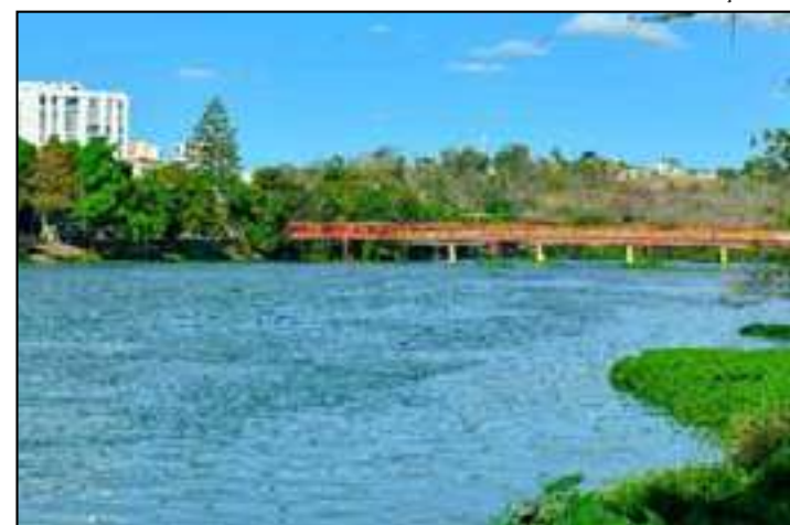
Evento acontece no dia 18 de abril, a partir das 11h, no Deck de Campos Elíseos