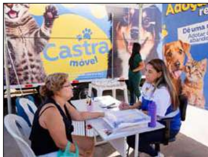
“Governo nos Bairros” reúne atendimentos em Nova Campinas

A expectativa é que o programa percorra os quatro distritos de Duque de Caxias, ampliando o alcance dos serviços e fortalecendo o vínculo entre a população e a administração pública.