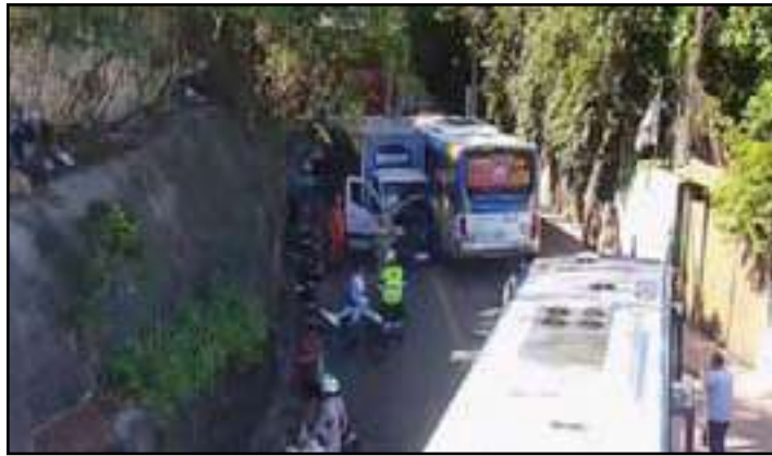
Acidente na Av. Niemeyer: o que provocou a interdição nos dois sentidos

Por conta da gravidade da batida, o tráfego precisou ser interrompido completamente. A medida foi necessária para permitir o trabalho das equipes de resgate e a futura movimentação dos veículos envolvidos