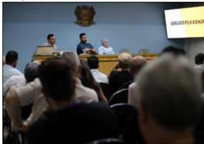
Encontro com representantes da sociedade civil e dos poderes Executivo e Legislativo no auditório da prefeitura

A Prefeitura de Volta Redonda promoveu audiência pública para apresentação do Projeto de Lei de Diretrizes Orçamentárias (LDO) referente ao exercício de 2027. O encontro com representantes da sociedade civil e dos poderes Executivo e Legislativo aconteceu na tarde da última terça-feira (14), no auditório da prefeitura.