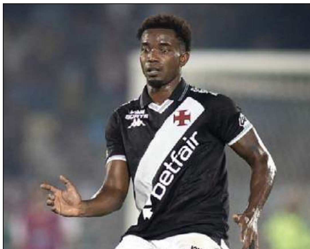
Volante aponta erros do árbitro uruguaio

A tendência é que o venezuelano ganhe mais minutos nas próximas partidas e entre de vez na briga por titularidade, especialmente após a boa atuação no clássico e a necessidade de reorganização do setor ofensivo.