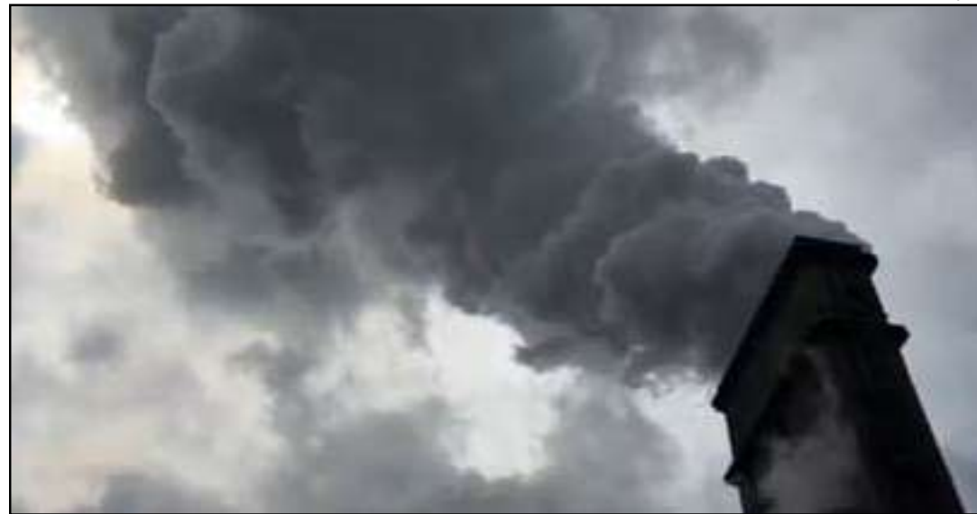
A droga foi destruída em uma siderúrgica em Santa Cruz, na Zona Oeste do Rio

Ontem (15), o Rio de Janeiro foi cenário de uma mobilização policial sem precedentes para a incineração de 48 toneladas de maconha, a maior apreensão já registrada na história do país. O material, localizado pelo Batalhão de Ações com Cães (BAC) no Complexo da Maré na última semana, estava sob custódia na Cidade da Polícia e seguiu para destruição em um comboio estratégico até uma siderúrgica em Santa Cruz, na Zona