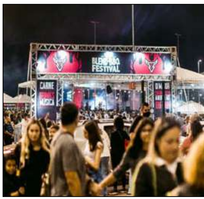
Blend BBQ Festival terá entrada gratuita e shows ao vivo

O festival reunirá mais de 15 estações de carnes premium, comandadas por chefs, assadores e pitmasters. Entre os cortes oferecidos estão costela no fogo de chão, brisket, picanha, cupim defumado, bife ancho, chorizo e porchetta, além de opções como hambúrgueres