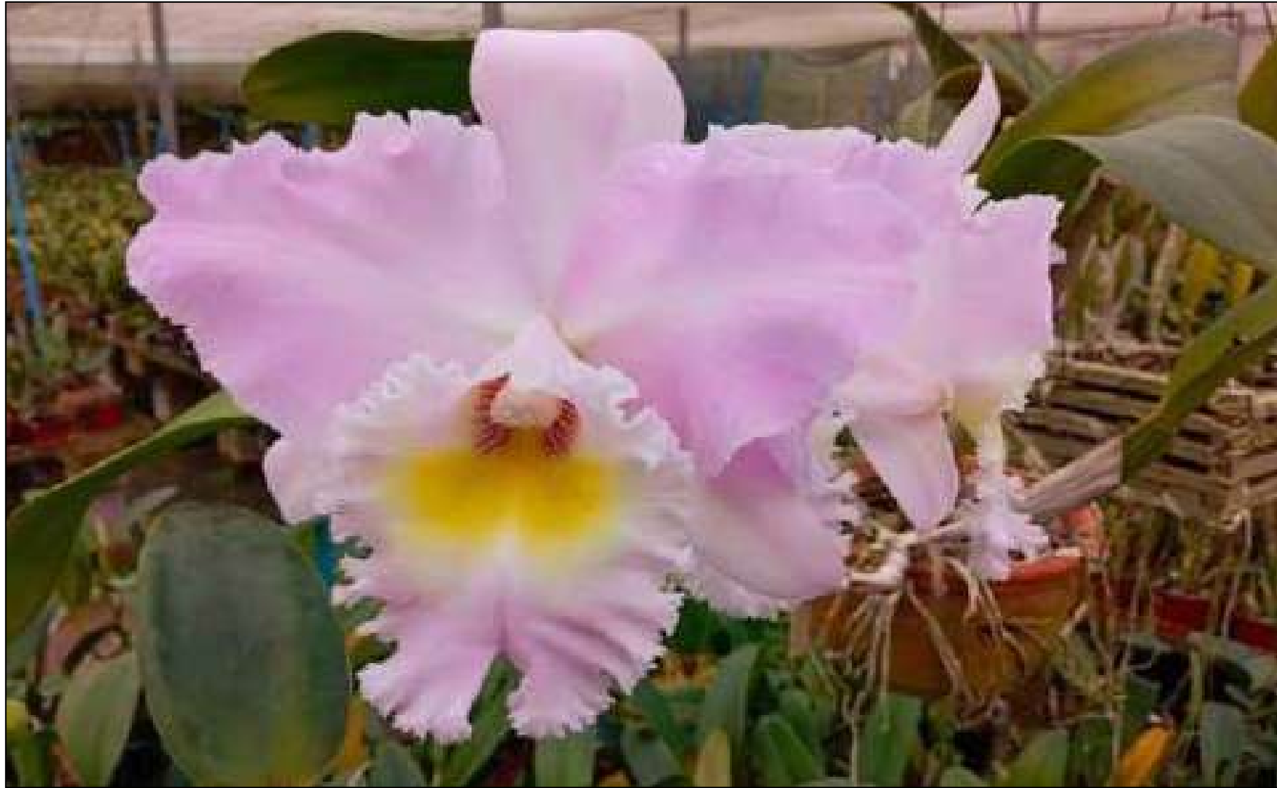
Exposição é aberta ao público e integra a programação cultural do espaço

De acordo com os organizadores, as orquídeas seguem um rigoroso sistema de registro de pedigree, com catalogação internacional realizada pela Royal Horticultural Society. O processo inclui a identificação das espécies parentais, data de cruzamento e autoria, per-