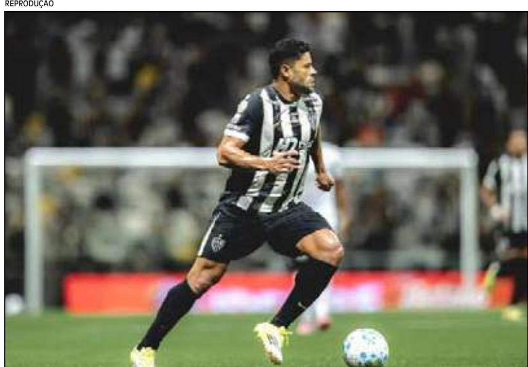
Negociação depende de rescisão com o clube mineiro

Outros grandes nomes também ficaram próximos do feito ao longo da história, como Romário, Bebeto e Renato Gaúcho, mas não completaram a lista de gols contra todos os principais rivais. A marca reforça o protagonismo de Pedro no atual elenco e sua relevância na história recente do clube.