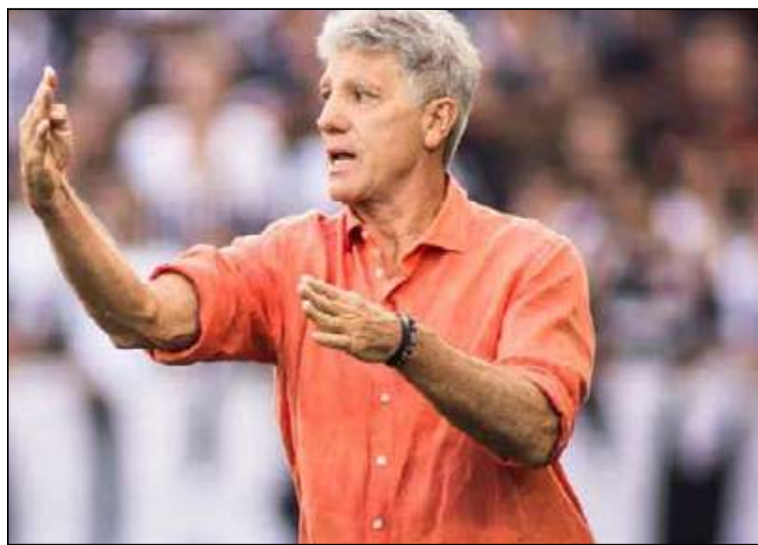
Técnico afirma que fez sua parte e cobra melhor desempenho dos jogadores

A possível chegada de Hulk é vista como estratégica dentro e fora de campo. Além da qualidade técnica, o atacante é considerado uma referência de liderança e experiência, características valorizadas pelo elenco. A diretoria entende que o jogador pode ajudar a suprir a lacuna deixada por nomes experientes que deixaram o clube recentemente e contribuir para fortalecer o perfil competitivo da equipe.