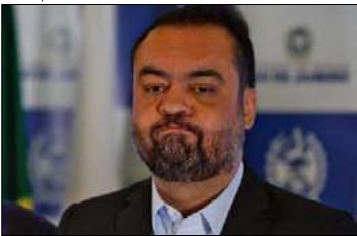
Pesquisa Quaest mostra que a aprovação de Cláudio Castro caiu de 53% para 35%

A aprovação do governo Cláudio Castro, do PL, caiu 18 pontos percentuais no Rio de Janeiro, segundo pesquisa Quaest divulgada ontem (27). Em outubro do ano passado, o governo era aprovado por 53% dos fluminenses. Agora, o índice recuou para 35%.