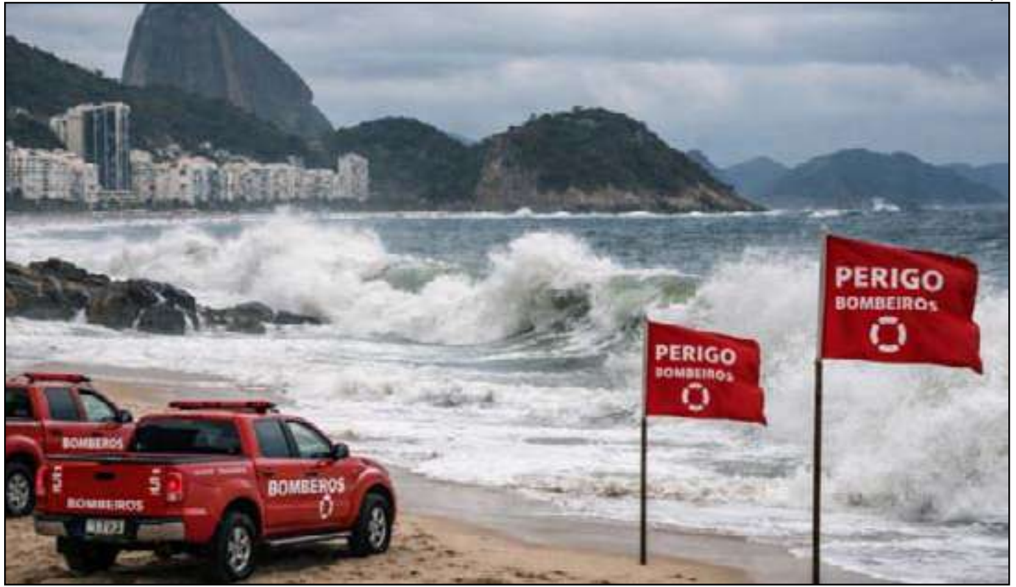
Bombeiros reforçam orientações de segurança para evitar afogamentos

Em outra ocorrência recente, registrada no domingo (26), equipes do Corpo de Bombeiros foram acionadas para um salvamento em área de difícil acesso no Parque