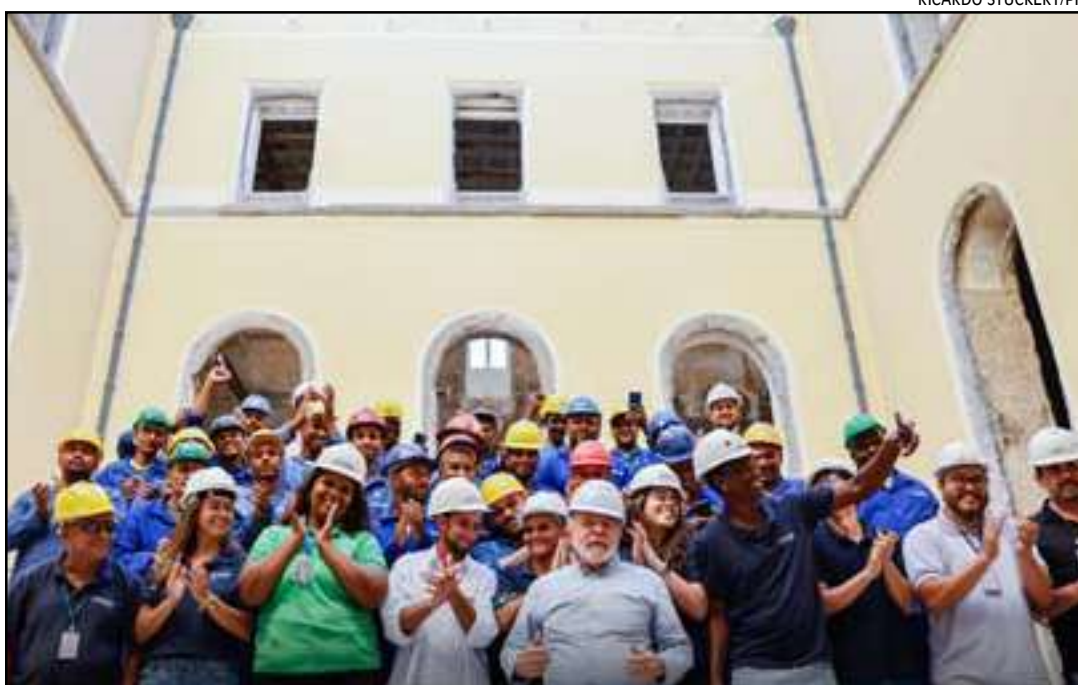
Presidente Lula durante visita guiada às obras de reconstrução do Museu Nacional, na Quinta da Boa Vista, em São Cristóvão