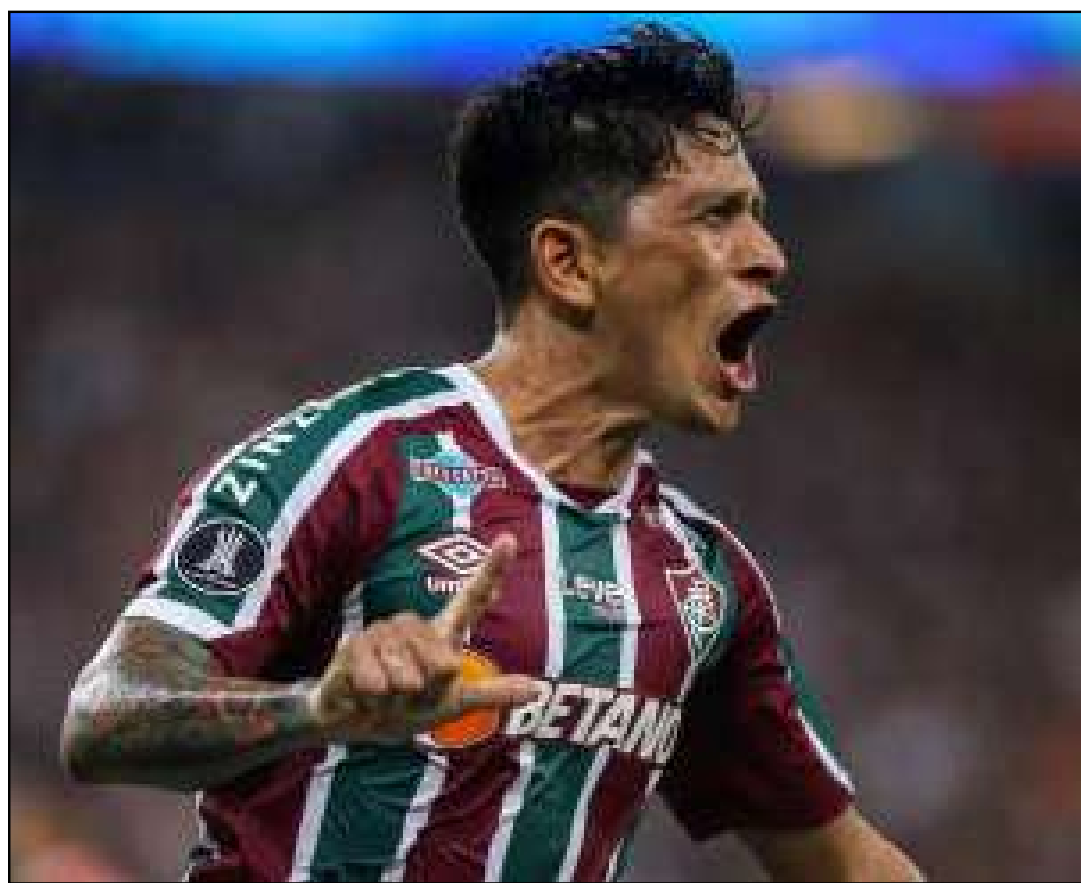
Atacante argentino teve problema na coxa direita

1º de abril, pela nona rodada do Campeonato Brasileiro. Na sequência, também entrou em campo nas partidas contra Coritiba e Deportivo La Guaira. Em comunicado oficial, o Fluminense informou que o jogador já iniciou o processo de recuperação após a lesão sofrida no treinamento.