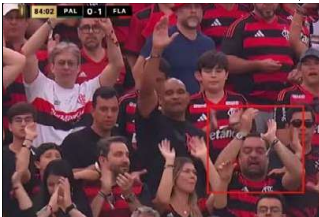
Cláudio Castro assistiu à partida entre Palmeiras e Flamengo em 2025, na final da Libertadores