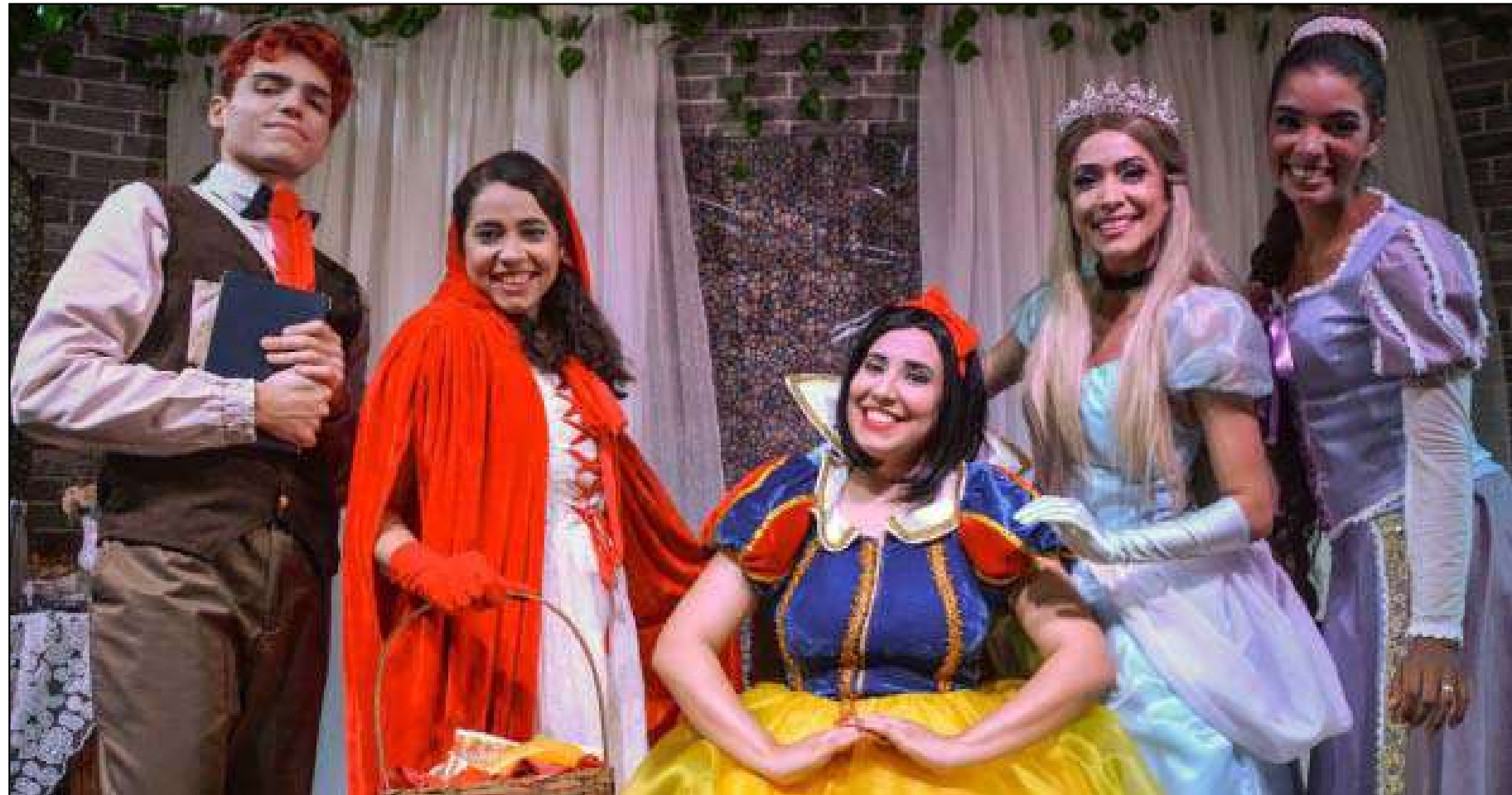
Evento é gratuito e requer inscrição prévia pelo aplicativo do shopping

A programação começa no dia 11 com Peter Pan, convidando o público para uma viagem ao mundo da fantasia. No dia 18, o destaque é “O Chá das Princesas”, com uma proposta voltada à amizade e à magia. Já no dia 25, a atração será Super Mario, personagem clássico dos vide-