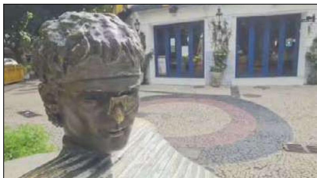
Essa não foi a primeira vez que o monumento foi alvo de vandalismo

Em nota, a Secretaria Municipal de Conservação do Rio de Janeiro disse que fará uma vistoria no local e providenciará o reparo do óculos da estátua.