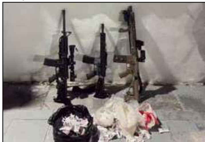
Apreensão aconteceu após agentes avistarem homens em veículo sem placa

Policiais militares do 15º BPM (Duque de Caxias) apreenderam três fuzis durante um ação na manhã de ontem (11). As armas, todos de fabricação estrangeira, estavam dentro de uma casa abandonada, nas proximidades da comunidade do Sapó, no município de Duque de Caxias.