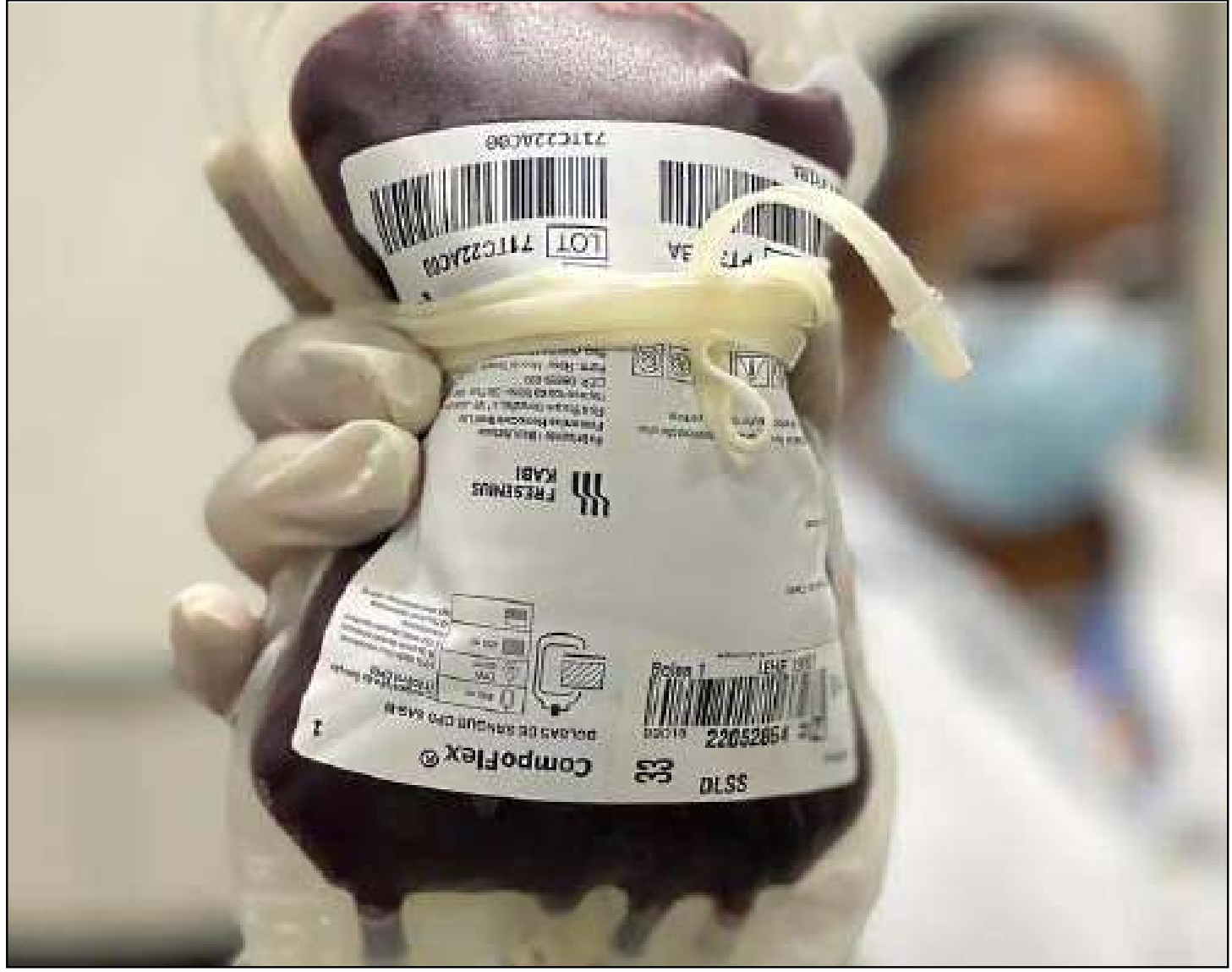
Cada bolsa coletada pode salvar até quatro vidas

A campanha será realizada no primeiro piso do shopping, próximo à loja Clube Melissa, das 10h às 15h, ou até que sejam atingidos 140 atendimentos. O atendimento será feito por ordem de chegada.