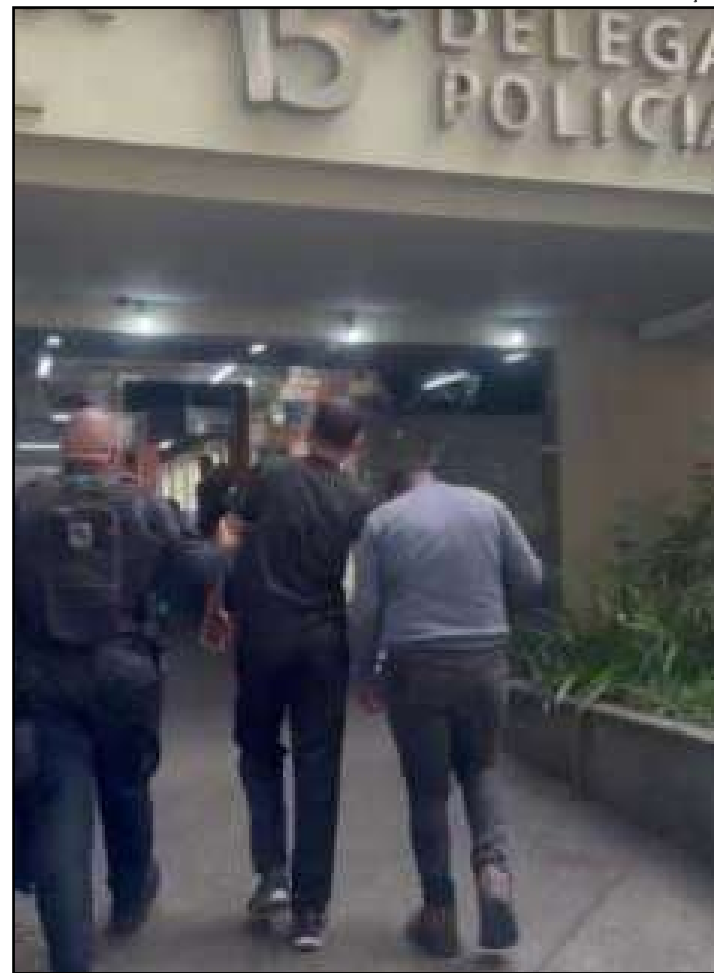
Dupla foi presa com arma e moto roubada

Por volta das 10h40, uma faixa do Túnel de São Conrado estava ocupada no sentido Gávea devido a ocorrência policial.