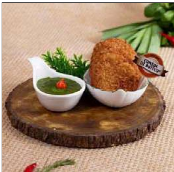
Concurso desafia botecos a criarem petiscos com tema verduras

Neste ano, o tema escolhido para a criação dos pratos é verduras, que servem como base para receitas inéditas preparadas pelos botecos. O preço dos petiscos é padronizado em R$ 40 em todo o país.