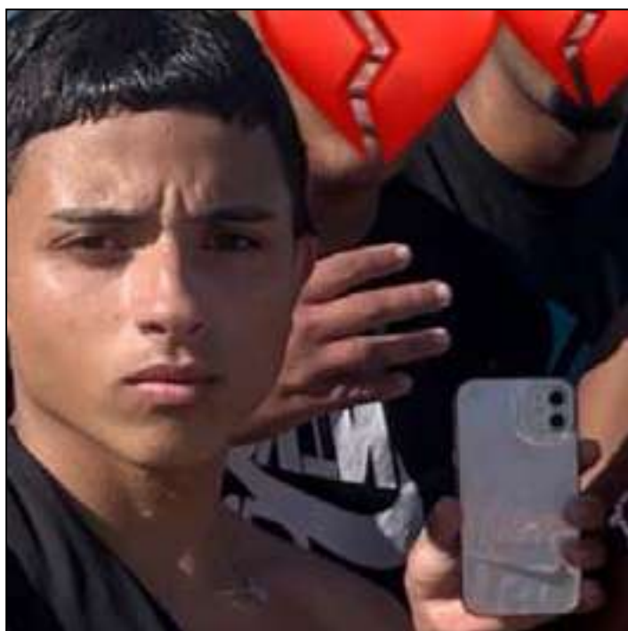
A vítima foi encontrada com as mãos atadas, a boca amordaçada e apresentava diversas perfurações de arma de fogo na localidade conhecida como Chaminé, na região do bairro Geneciano

O episódio ocorre em um cenário de atenção