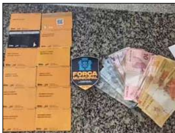
Além dos cartões, havia um celular e R$ 284 em espécie

detido com uma ferramenta R$ 3,5 mil e a máquina foi do tipo maquita avaliada em devolvida ao dono.