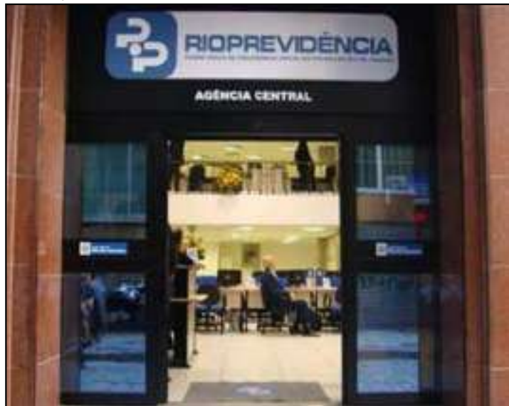
RioPrevidência teria investido valor na compra de letras financeiras emitidas pelo Banco Master

A Polícia Federal intensificou as investigações sobre o direcionamento de quase R$ 1 bilhão do RioPrevidência para a compra de letras financeiras emitidas pelo Banco Master. Revelado pelo jornalista Lauro Jardim, do jornal O Globo, o caso se consolidou como um dos maiores escândalos financeiros da gestão do governador Cláudio Castro, por envolver diretamente a verba destinada ao pagamento de aposentadorias e pensões do funcionalismo público do Estado do Rio de Janeiro. A suspeita central é de que tenha havido irregularidades na escolha da instituição financeira para receber o montante público antes de sua derrocada.