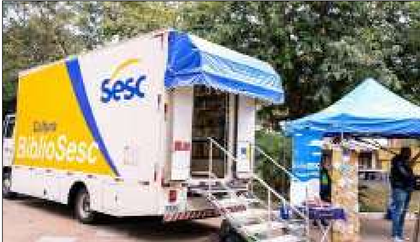
Inauguração terá intervenção poética da Cia Trilhos no dia 27

Para marcar a inauguração, o público poderá acompanhar a intervenção poética “Pescadores de Sonhos”, da Cia Trilhos, com apresentações nos períodos da manhã e da tarde. A ação aposta em uma abordagem lúdica e acolhedora, convidando os participantes a mergulharem em um universo em que palavras e música se