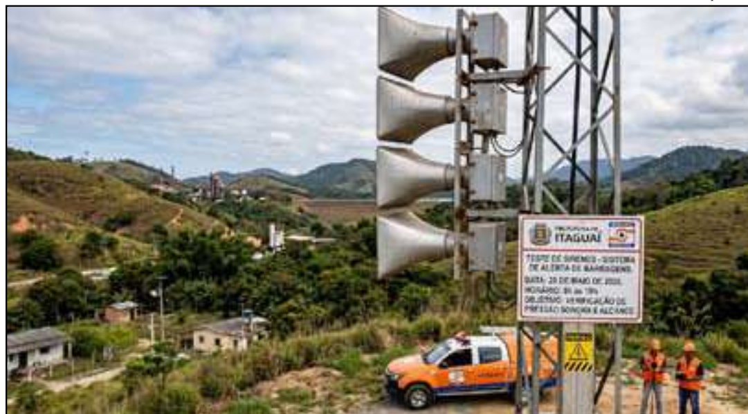
Técnicos da Defesa Civil inspecionam sinais sonoros de alerta da sirenes

ram como a ferramenta mais eficaz de aviso precoce, sendo capazes de despertar populações inteiras de forma simultânea, inclusive durante a noite. Ao emitirem o sinal sonoro, as sirenes ativam instan-