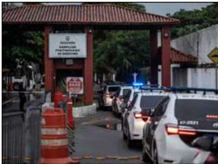
Complexo de Geracino, em Bangu, na Zona Oeste do Rio

De acordo com a Seppen, a prisão ocorreu após troca de informações de inteligência e monitoramento entre policiais penais da Subsecretaria de Inteligência da Seppen e agentes da Delegacia de Roubos e Furtos de Cargas da Baixada Fluminense (DRFC-BF).