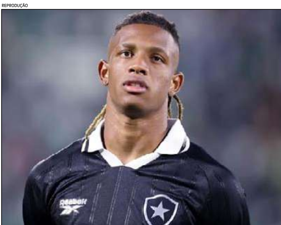
Meio-campista do Botafogo recusou transferência para o futebol russo