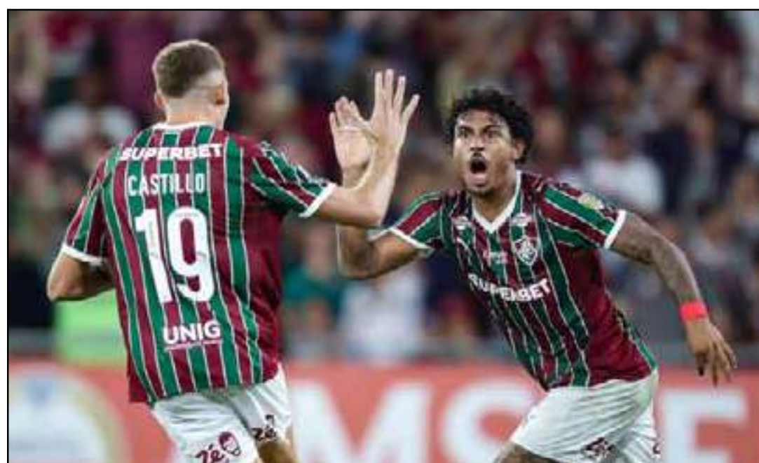
Atacante alcança maior marca de gols pelo clube após quase ser vendido