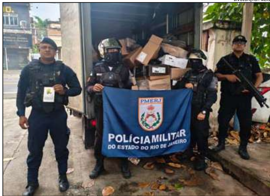
Os policiais do batalhão de Belford Roxo com a carga recuperada

Em depoimento, o motorista detalhou a dinâmica do assalto: ele foi abordado inicialmente por dois criminosos em