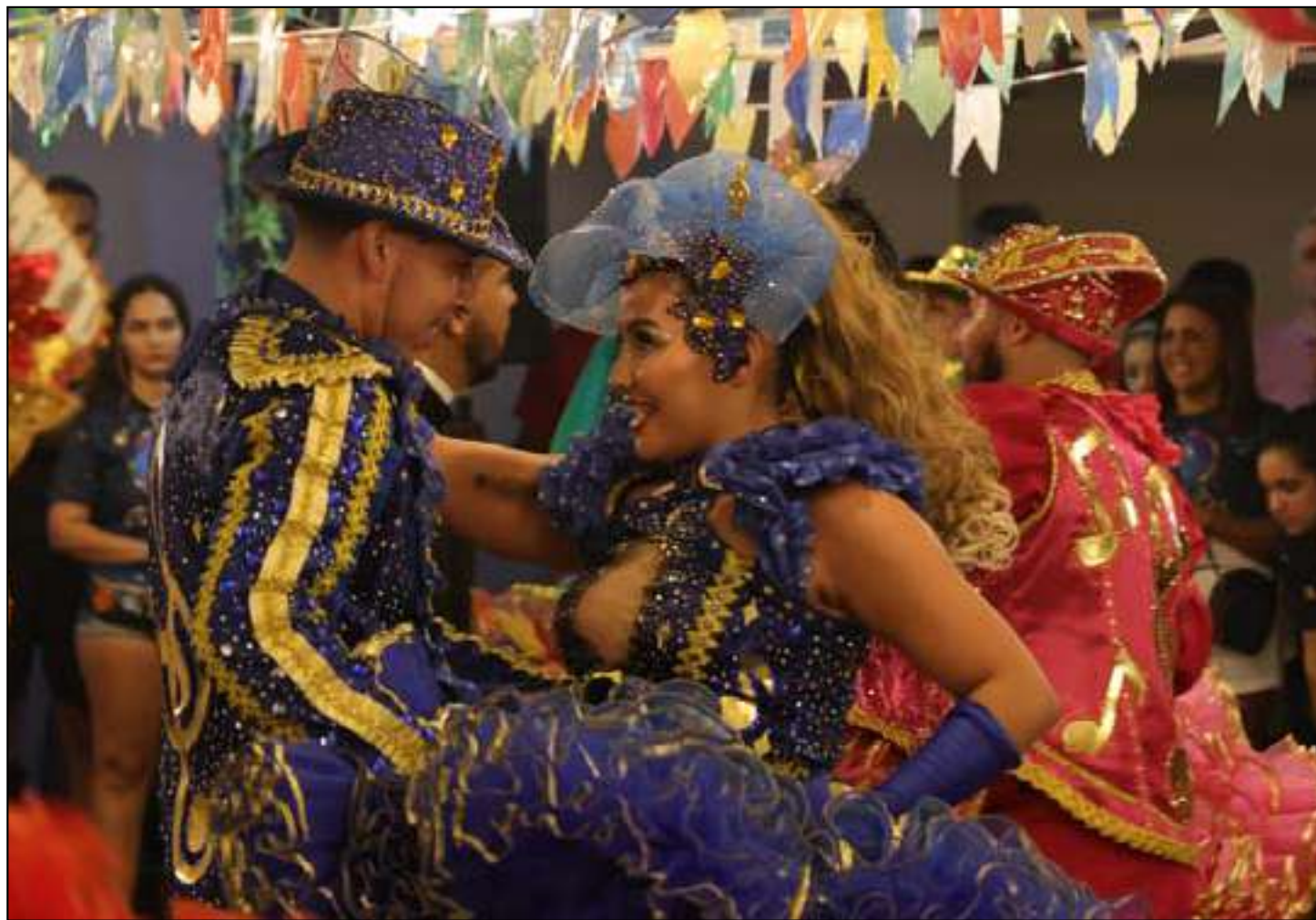
Público poderá aproveitar uma programação inspirada nas festas de São João

vistas estão apresentações de quadrilhas, brincadeiras típicas e shows ao vivo. A pro-