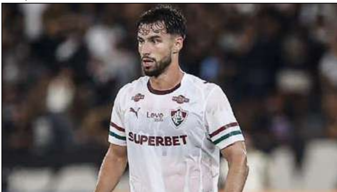
Volante é tratado como um dos principais nomes do elenco