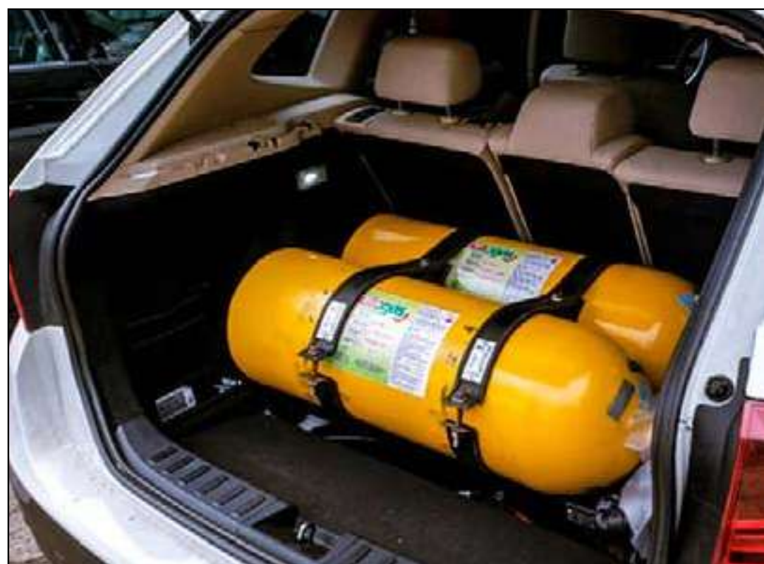
Descontos atingem clientes residenciais, comércio, indústrias e usuários de GNV

Segundo estimativas do setor, o uso do GNV pode representar economia de até 60% em comparação aos gastos com gasolina e etanol, fator que contribui para a alta adesão ao combustível no Estado.