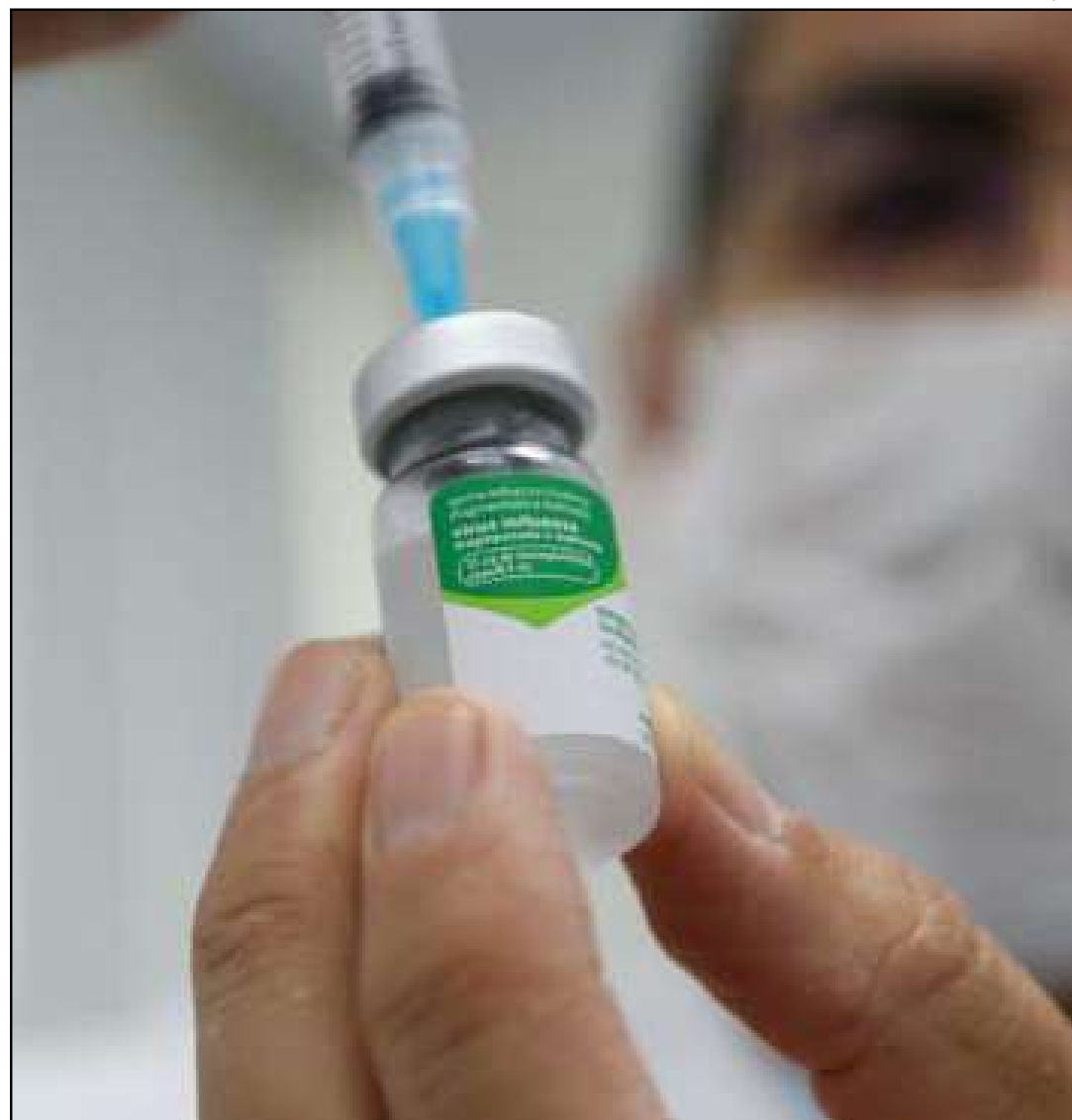
Vacina trivalente oferece proteção contra três cepas do vírus

Para receber a vacina, é necessário apresentar documento de identificação, CPF ou cartão do SUS. No caso das crianças, também é obrigatória a apresentação da caderneta de vacinação.