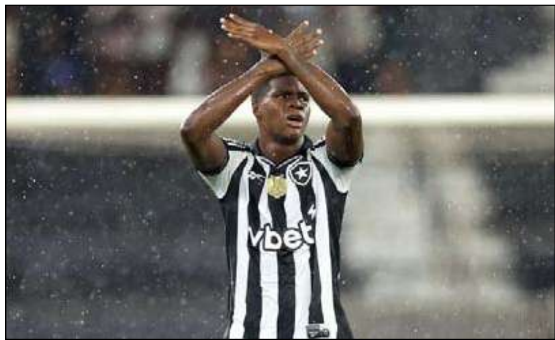
Atacante pode receber proposta milionária na próxima janela

O retorno recente aos gramados também foi celebrado pela torcida e pela comissão técnica. Martinelli voltou a atuar após período afastado por lesão muscular e participou da vitória sobre o Deportivo La Guaira no Maracanã.