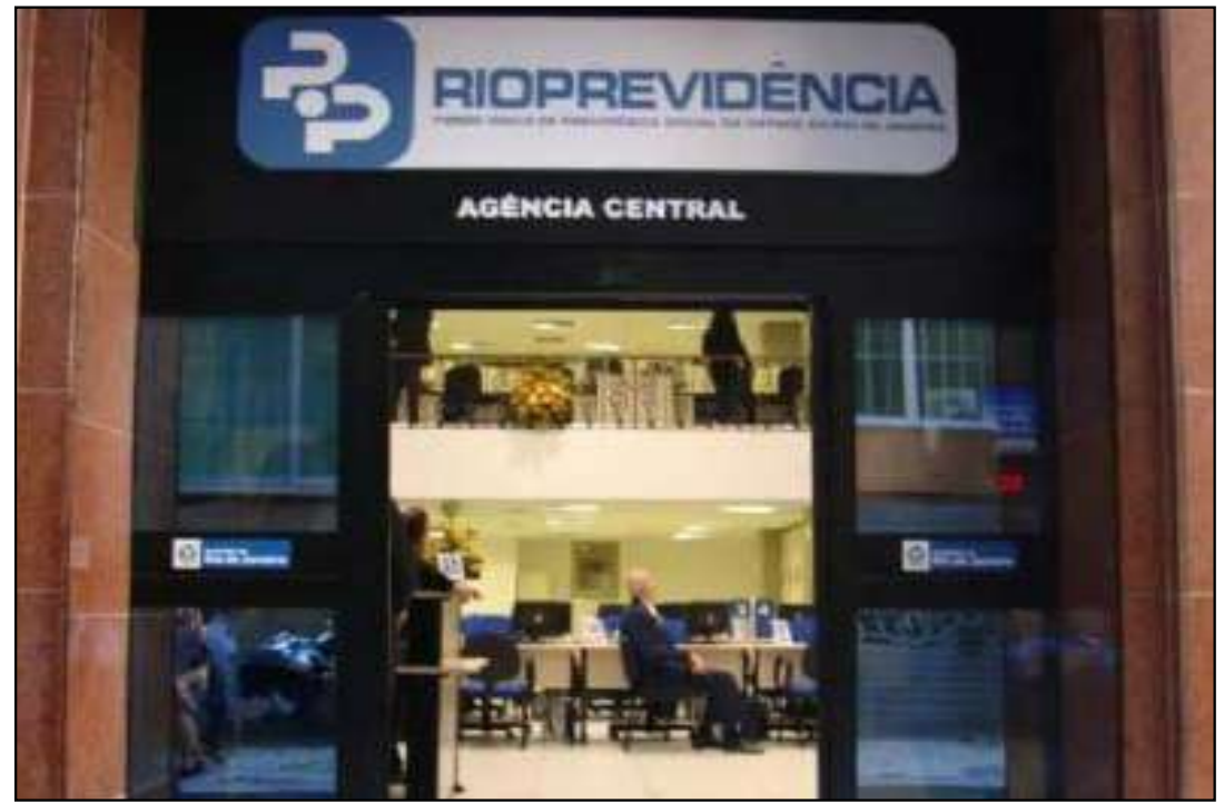
A investigação apura um conjunto de transações financeiras bilhões realizadas pelo Rioprevidência com o Banco Master

Segundo o governador, a estratégia também pode alcançar investidores e pessoas ou empresas que tenham tomado empréstimos junto ao banco. “Depois, nós podemos ir àqueles que são investidores do Master. A procuradoria do Estado procurou ir naqueles que tomaram