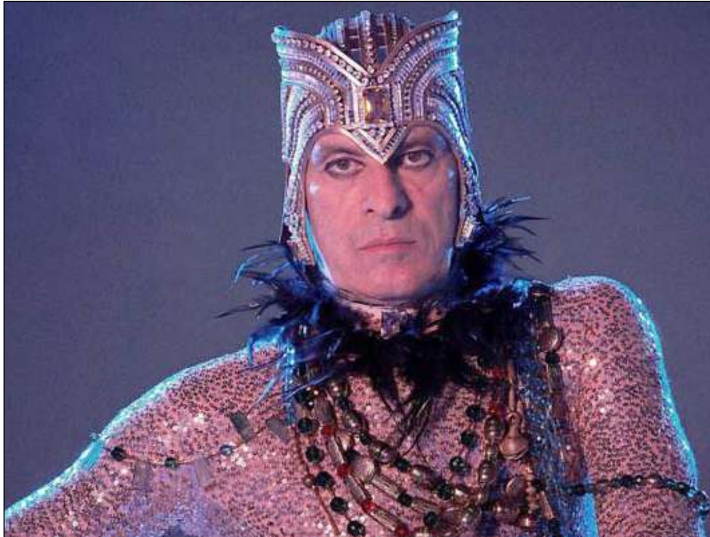
Projeto convida o público a refletir sobre temas recorrentes na obra de Ney