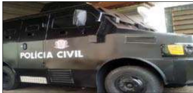
Incidente na Zona Norte causou apenas danos materiais e não deixou feridos

Um blindado da Polícia Civil, popularmente conhecido como “caveirão”, esteve envolvido em um incidente operacional e acabou arrancando o para-choque traseiro de uma viatura da própria corporação.