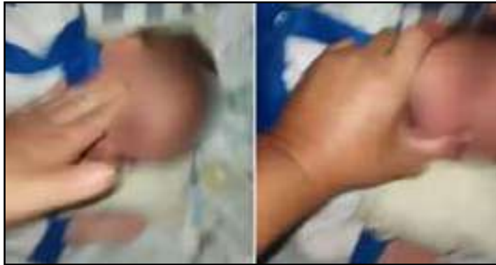
Vídeo mostra mãe agredindo o filho de apenas 5 meses

Uma mulher aparece em um vídeo dando uma série de tapas e apertos no rosto do próprio bebê, de apenas 5 meses, e fazendo ameaças de morte contra ele e outra criança, de 1 ano e 11 meses em São João da Barra, no Norte Fluminense.