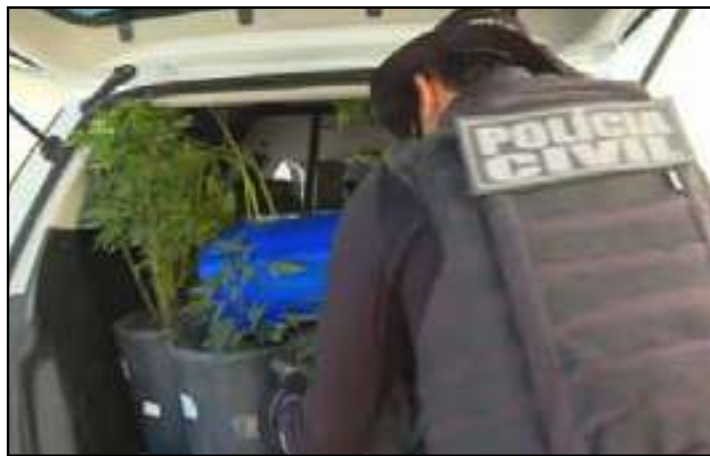
Pés de maconha apreendidos pela polícia em operação no Complexo da Maré