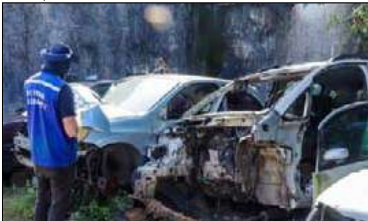
Estabelecimento em Itaguaí operava sem credenciamento e realizava queima ilegal de resíduos

Uma força-tarefa da Operação Desmonte interditou ontem (10) um ferro-velho que operava ilegalmente em Itaguaí, na Região Metropolitana do Rio. A ação foi coordenada pelo Detran RJ para combater irregularidades no comércio de peças usadas.