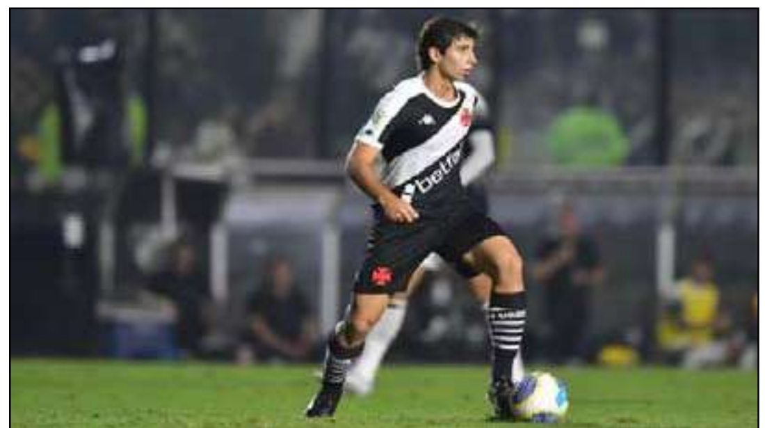
Meio-campista é formado nas categorias de base

A eventual contratação do meio-campista dependerá dos próximos movimentos do mercado e das condições impostas pelo clube italiano, que busca definir o futuro do jogador antes do término de seu contrato.