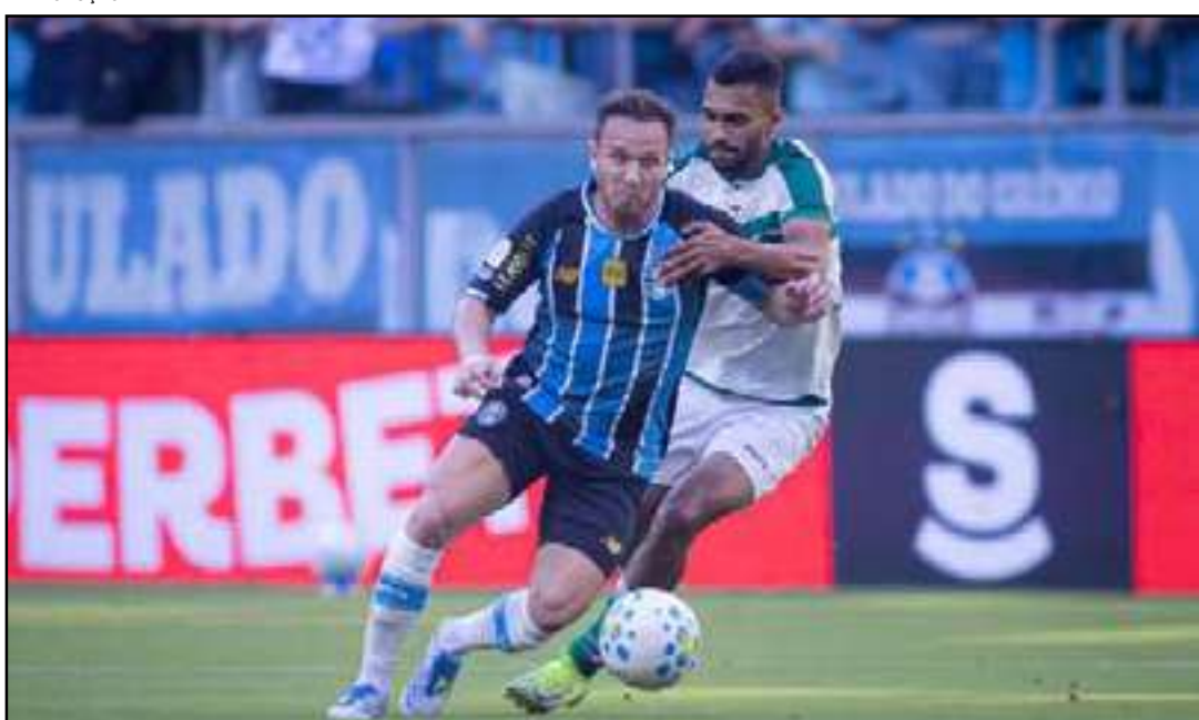
Meia pertence à Juventus e está emprestado ao Grêmio