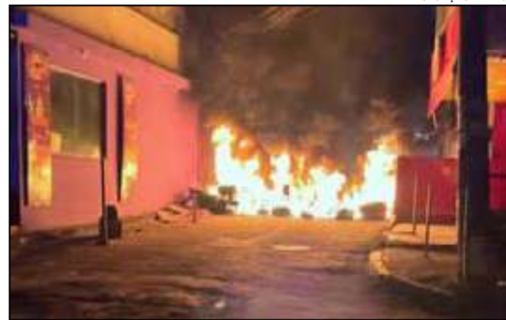
Criminosos colocaram fogos em barricadas no Complexo da Maré para impedir a chegada da polícia

As equipes sofreram ataques a tiros e criminosos queimaram barricadas. Por segurança, escolas e postos