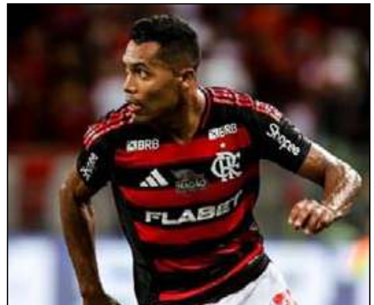
Lateral do Flamengo tem permanência encaminhada até 2027

Contratado pelo Flamengo no segundo semestre de 2024, o lateral acumula 78 partidas, um gol, duas assistências e seis títulos conquistados pelo clube: dois Campeonatos Cariocas, Copa do Brasil, Campeonato Brasileiro, Libertadores e Supercopa. Desde sua chegada, consolidou espaço entre os titulares da equipe.