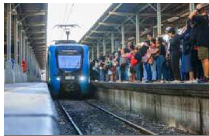
Investimentos incluem aumento de viagens, manutenção e melhorias

Além do aumento da oferta, passageiros passaram a perceber redução no tempo de espera em horários de maior movimento. No ramal Japeri, os trens expressos com destino à Central do Brasil tiveram o intervalo reduzido de 10 para 6 minutos durante o pico da manhã. Já no trecho entre Japeri e Nova Iguaçu, o tempo de espera caiu de 20 para 8 minutos.