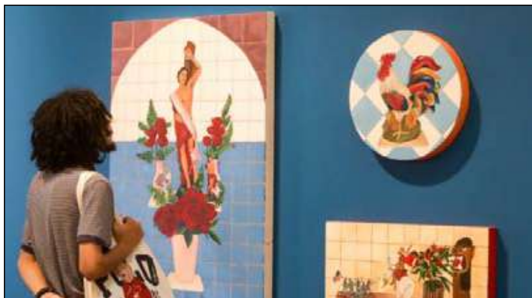
Mostras reúnem obras de artistas fluminenses até 8 de julho

As mostras integram o processo de reestruturação da Casa Brasil e contam com patrocínio da Petrobras e do Ministério da Cultura. O projeto faz parte do reposicionamento do es-