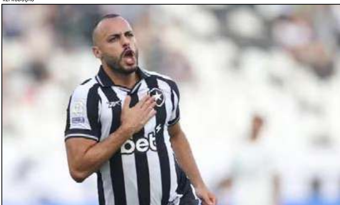
Documento aponta débito superior a R$ 1,28 bilhão

Flamengo teve o nome associado a movimentações no mercado envolvendo um possível interesse no volante colombiano Richard Ríos. Apesar das especulações, o clube optou por outro caminho e aproveitou a pausa no calendário para assegurar a permanência de um jogador formado em casa.