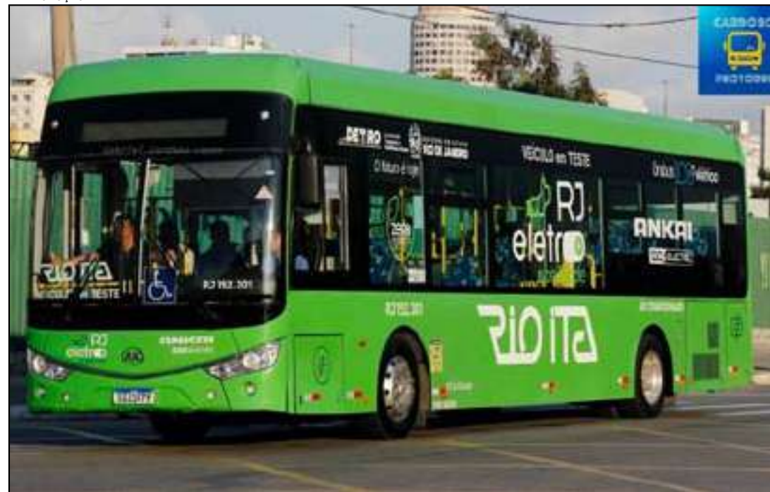
Operação experimental será realizada pela Rio Ita

O transporte intermunicipal do Estado do Rio passará a contar, em caráter experimental, com a circulação de um ônibus totalmente elétrico. A iniciativa será conduzida pela Rio Ita e integra o programa RJ Eletro, desenvolvido pelo Governo do Estado em parceria com o Detran-RJ e empresas operadoras do sistema.