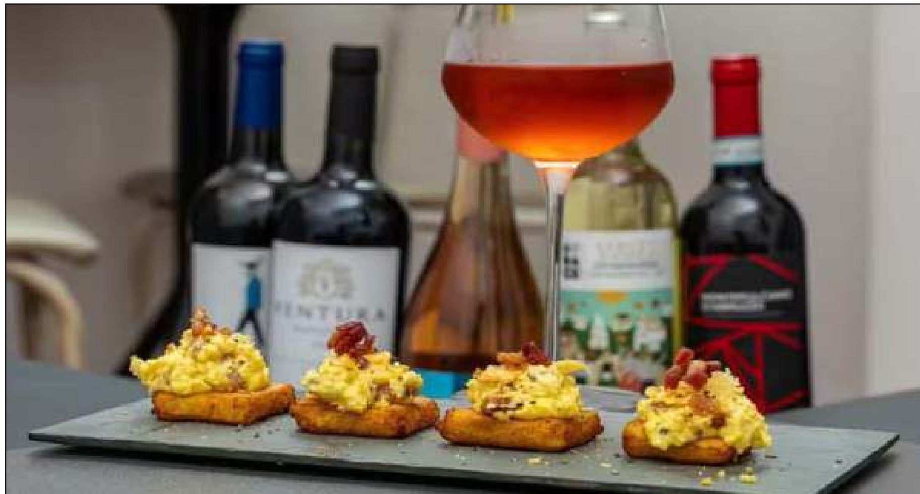
Público pode participar escolhendo o petisco favorito

ros colocados receberão premiação em dinheiro. O vencedor será contemplado com R$ 2 mil, o segundo colocado receberá R$ 1 mil e o terceiro