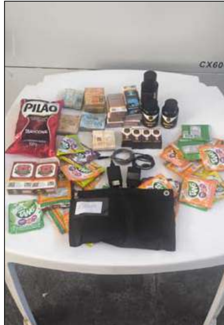
Agentes foram flagrados durante fiscalização