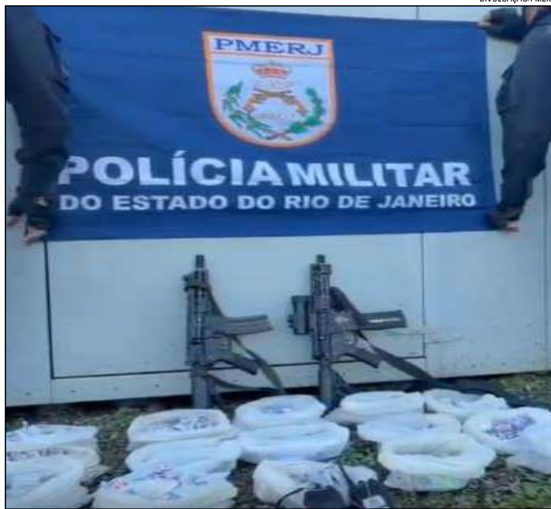
Os PMs apreenderam dois fuzis de alto poder de destruição, além de uma grande quantidade de drogas

Com o criminoso atingido e nos arredores do confronto, os policiais conseguiram apreender o armamento pesado, composto por dois fuzis de alto poder de destruição, além de uma grande quantidade de drogas. De acordo com o Comando do 24º BPM, o quantitativo total do material entorpecente apreendido será contabilizado e divulgado oficialmente pela Polícia Militar. A ocorrência foi encaminhada e apresentada na 50ª DP (Itaguaí), onde o caso foi registrado e as medidas cabíveis foram adotadas pela Polícia Civil.