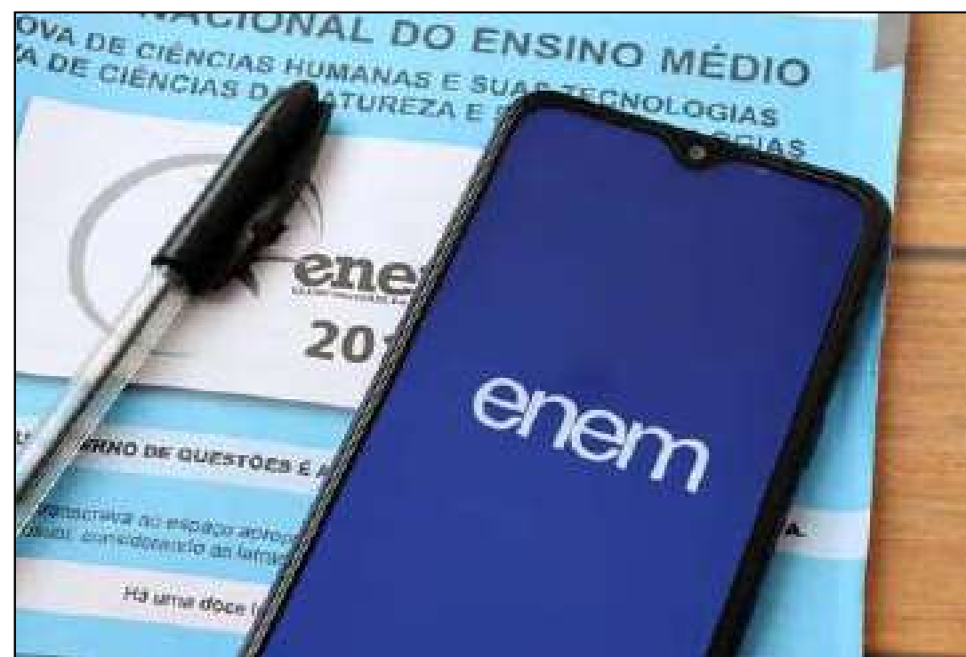
Candidatos inscritos devem quitar valor de R$ 85

Também têm direito à isenção os candidatos que utilizarão os resultados do Enem para obtenção do certificado de conclusão do ensino médio e que estejam inscritos no Cadastro Único para Programas Sociais do Governo Federal (CadÚnico).