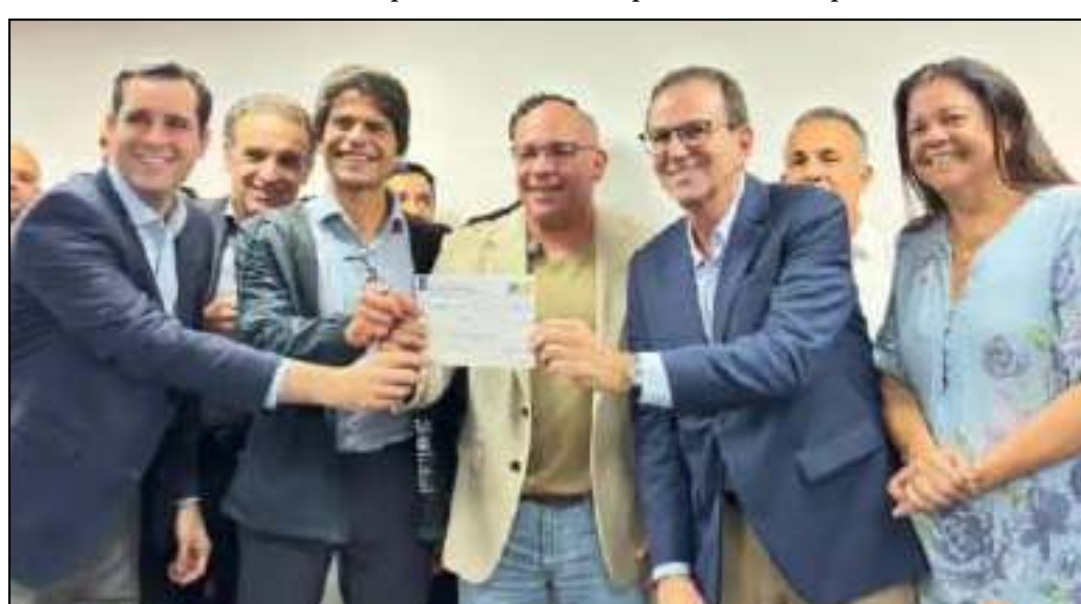
Movimento fortalece a presença do partido na Região dos Lagos

O projeto arquitetônico da nova sede foi desenvolvido pelo escritório americano Diller Scofidio + Renfro, em parceria com o arquiteto brasileiro Índio da Costa. A proposta sempre foi transformar o museu em um novo equipamento cultural de grande porte na orla de Copacabana, com áreas de exposição, cine-teatro, café, restaurante e um cinema a céu aberto no terraço.