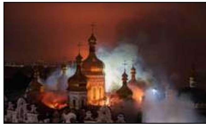
Bombardieiro provocou incêndio em mosteiro reconhecido pela Unesco

Um ataque aéreo de grande escala realizado pela Rússia durante a madrugada de segunda-feira (15) provocou danos ao complexo religioso de Kyiv-Pechersk, em Kiev, e deixou ao menos nove mortos e dezenas de feridos em diferentes regiões da Ucrânia.