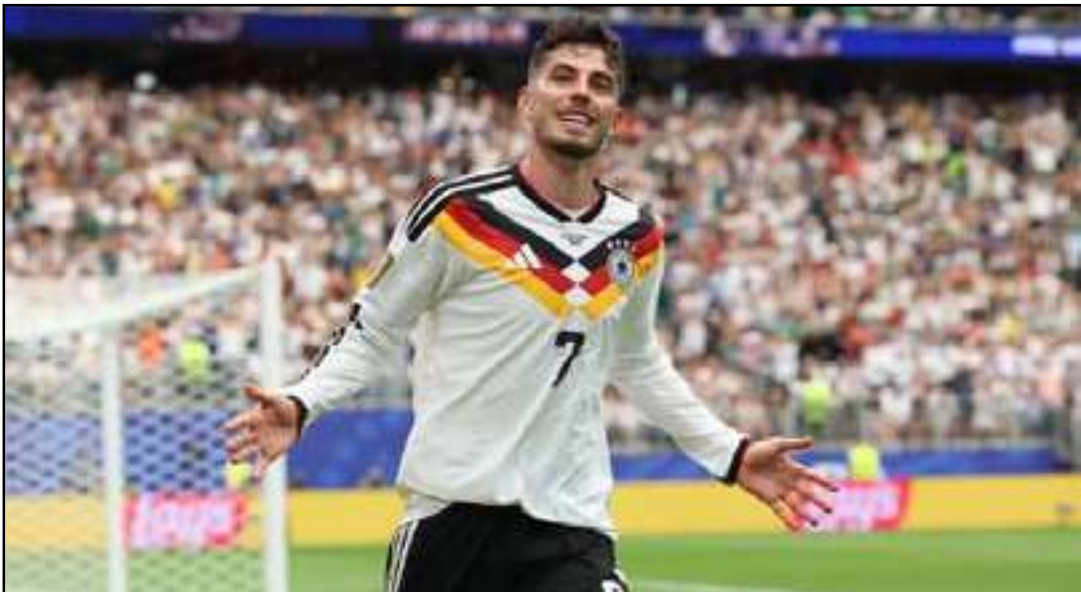
Seleção europeia venceu por 7 a 1 no Grupo E