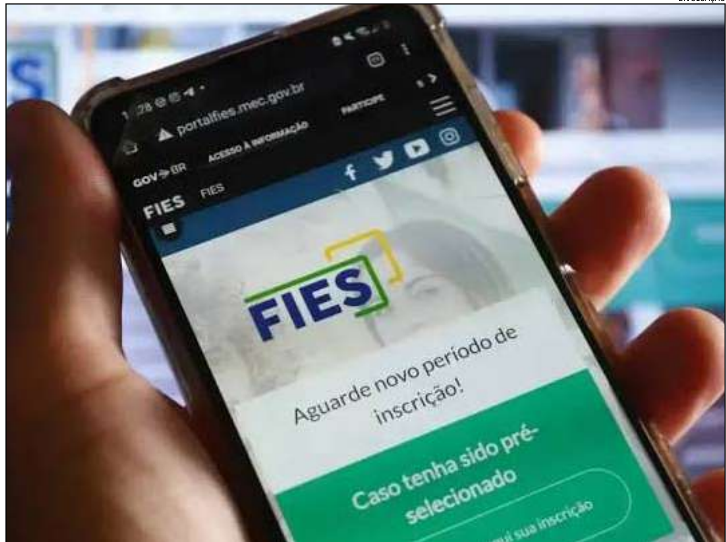
Acordos já resultaram na arrecadação de R$ 283,2 milhões

Também foram contabilizados 5.475 contratos renegociados na faixa que prevê descontos de até 99%. Já a modalidade para es-