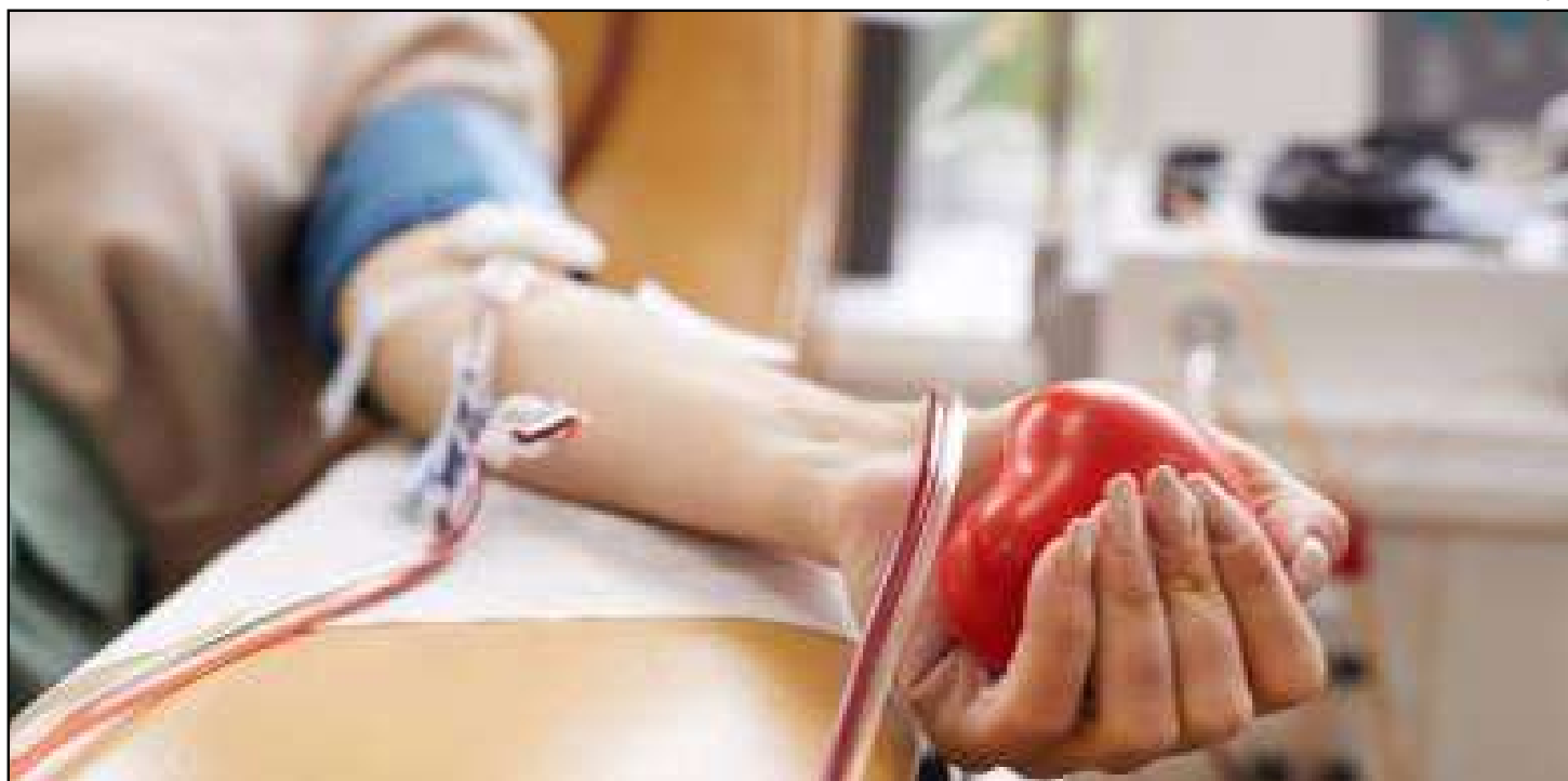
Proposta reconhece o esforço dos voluntários e incentiva a participação