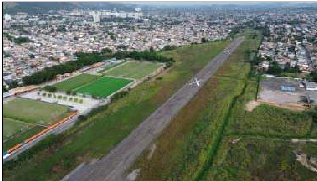
Antigo Aeroclube de Nova Iguaçu pode se transformar em um parque de 400 mil m 2 em área reivindicada por moradores da Baixada Fluminense

O parlamentar salientou que a abertura do parque traria transformações profundas para o cotidiano dos moradores. "Convivo com essa cobrança de familiares e conhecidos há bastante tempo e compreendo perfeitamente o valor dessa