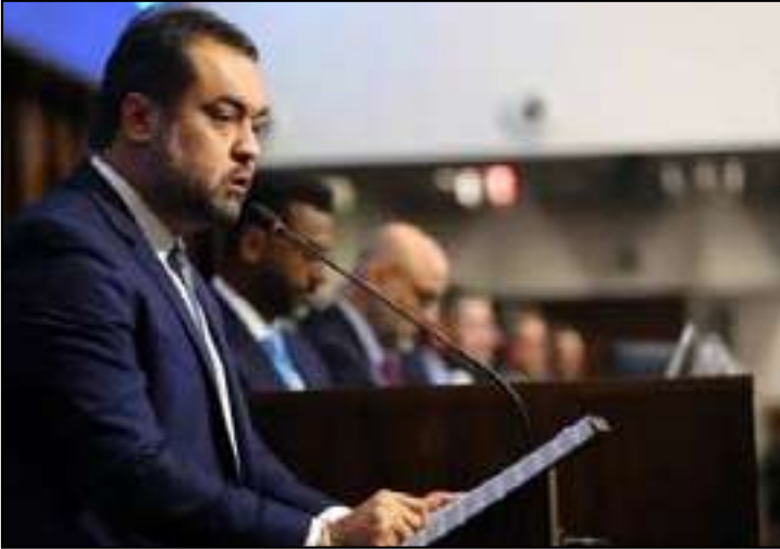
Despesas incluem passagens aéreas, diárias e seguro-viagem do ex-governador Cláudio Castro

A gestão de Cláudio Castro (PL) gastou mais de R$ 12 milhões com viagens internacionais entre 2022 e março de 2026. O valor inclui despesas com passagens aéreas, diárias e seguro-viagem do então governador do Rio de Janeiro e das comitivas que o acompanharam em missões oficiais ao exterior.