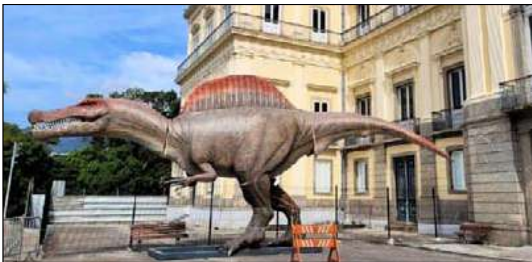
Exemplar de Oxalaia quilombensis ficará em frente ao palácio

Com cinco metros de altura e 15 metros de comprimento, o modelo foi doado pelo Parque Terra dos Dinos, localizado em Miguel Pereira, e integra a programação comemorativa pelos 208 anos do Museu