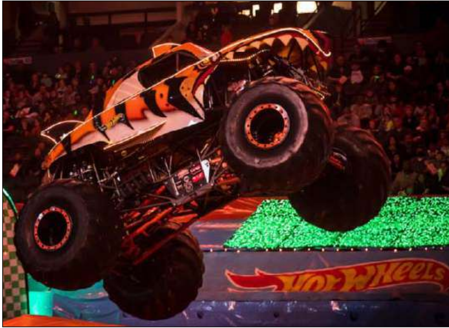
Espetáculo chega ao país após o sucesso internacional

A nova turnê reúne alguns dos personagens mais conhecidos pelas fãs da franquia, entre eles Mega Wrex, Tiger Shark, Gunkster, Bone Shaker, Bigfoot e Skelosaurus. A edição brasileira também marcará a estreia do Rhinomite,