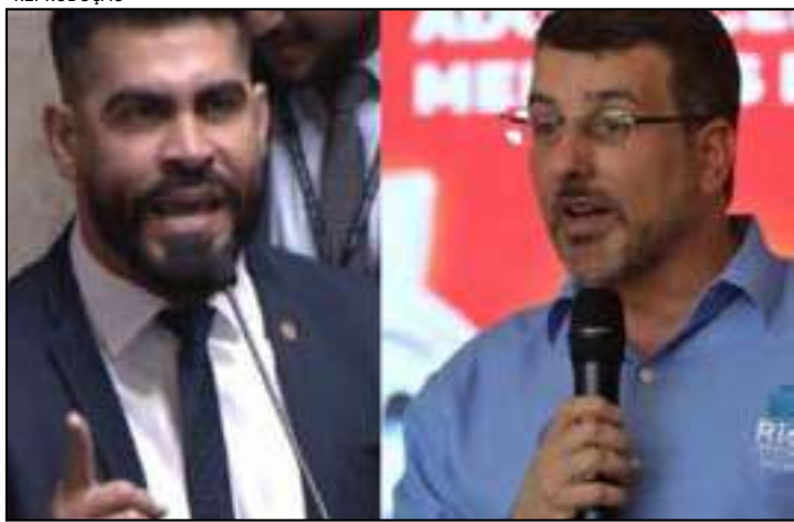
Vereador Marcelo Diniz faz ataque homofóbico contra Daniel Soranz

Durante a sessão ontem (9) na Câmara Municipal do Rio, o vereador Marcelo Diniz (PSD) evidenciou novas fraturas na base aliada ao disparar duras críticas contra o deputado federal e ex-secretário municipal de Saúde, Daniel Soranz (PSD). Ambos integram o mesmo partido e disputam uma vaga no Congresso Nacional. Diniz acusou Soranz de manter o controle sobre a Secretaria de Saúde mesmo após deixar o cargo em março, alegando uso político da máquina pública para fins eleitorais, além de apontar