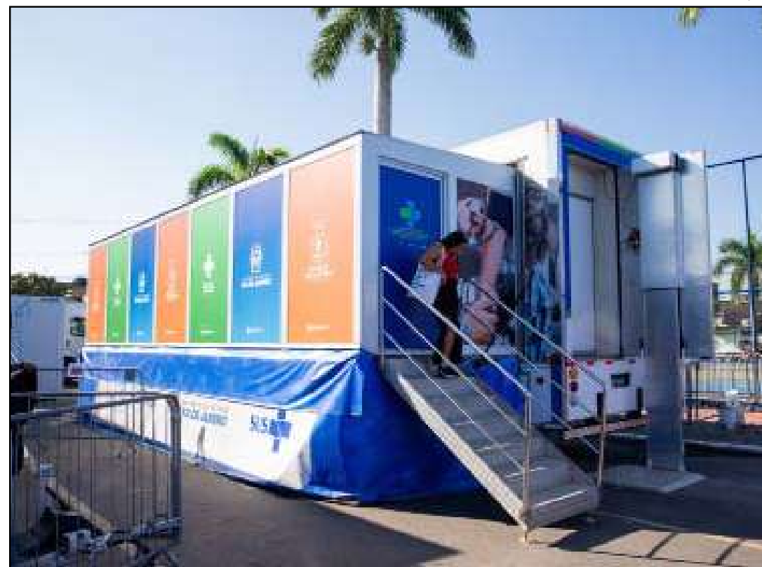
Iniciativa concentra em um único espaço diversos serviços municipais

A iniciativa concentra em um único espaço diversos serviços municipais, com o objetivo de facilitar o acesso da população a atendimentos essenciais. Os moradores podem contar com serviços de assistência social, emissão de documentos, orientação jurídica, inscrição e atualização em programas sociais, além de ações voltadas à proteção animal, como castração e microchipagem. Na área da saúde, a carreta Chegaram os Especialistas amplia a oferta de consultas e atendimentos especializados, contribuindo para descentralizar os serviços e