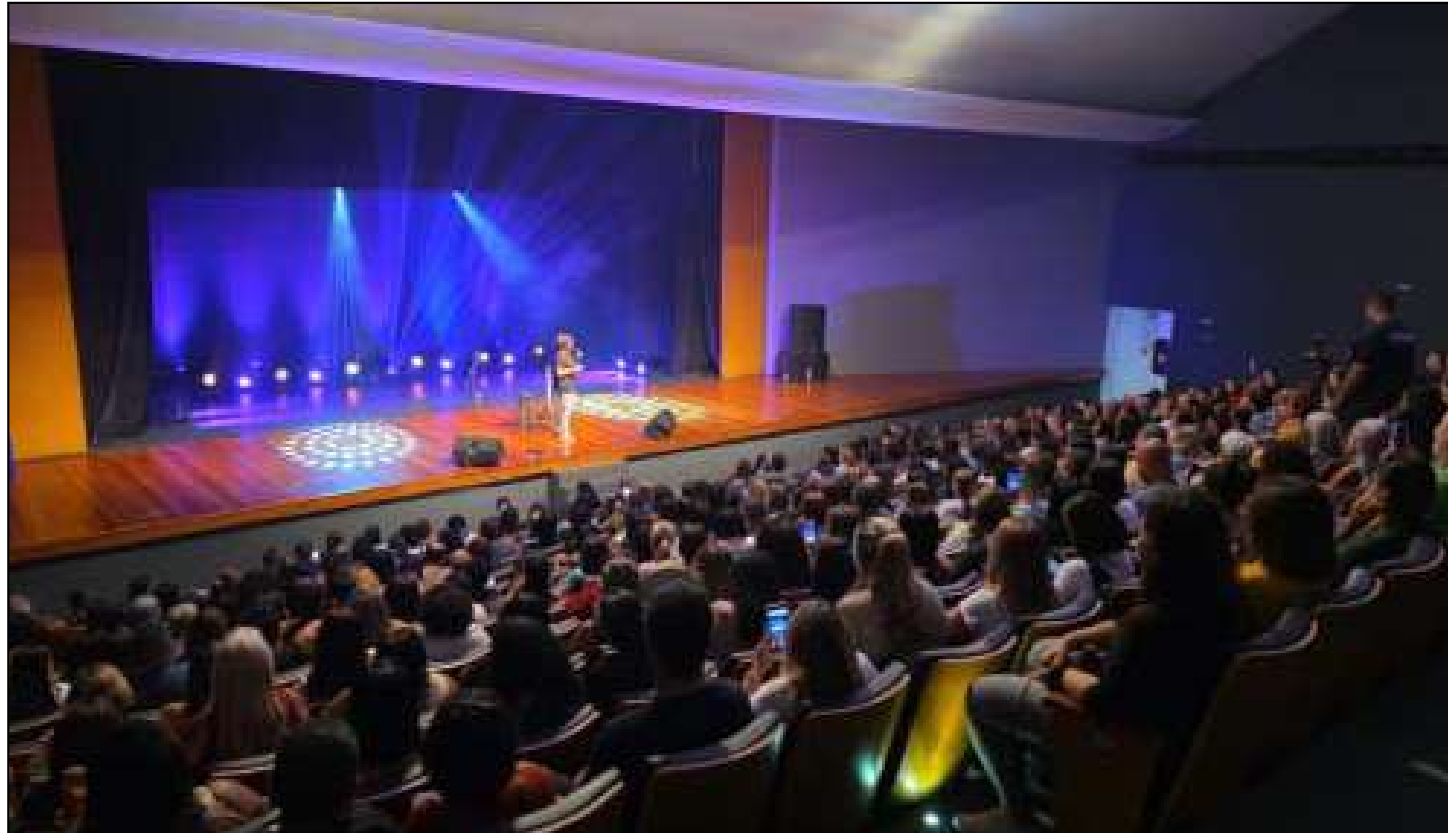
Casa já prepara uma agenda repleta de eventos para os próximos meses

A programação de junho começa com o espetáculo de humor “Clube dos Canalhas”,