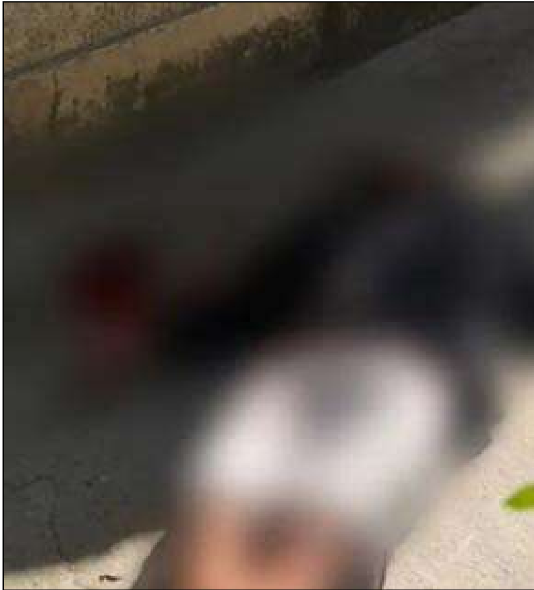
Vítima foi morta a tiros por criminosos em três motos

Um homem de 40 anos identificado pelo apelido de Chumbinho foi assassinado a tiros na manhã de ontem (9) no Largo da Preguiça, em Curicica, Zona Sudoeste do Rio. O crime ocorreu próximo a um campo de futebol da região.