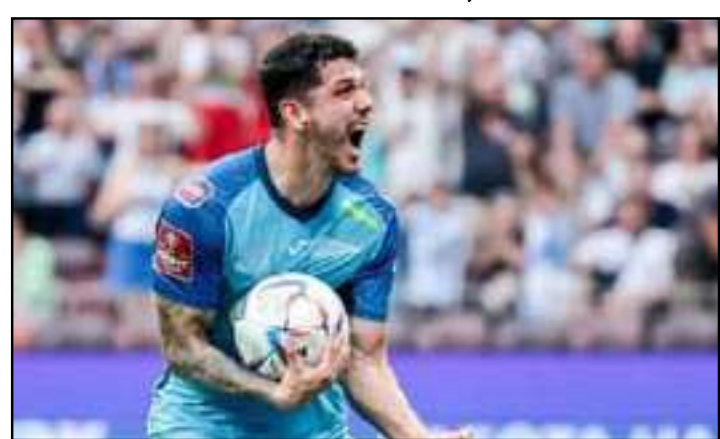
Zagueiro do Zenit mantém conversas com o clube carioca

As condições impostas pelos russos são consideradas o principal obstáculo para a conclusão do negócio neste momento. Apesar das dificuldades, o Fluminense aposta no bom relacionamento construído entre os clubes nos últimos anos para avançar nas negociações. As conversas devem continuar nas próximas semanas, período considerado decisivo para definir se o defensor retornará ao futebol brasileiro ou seguirá sua trajetória no exterior.