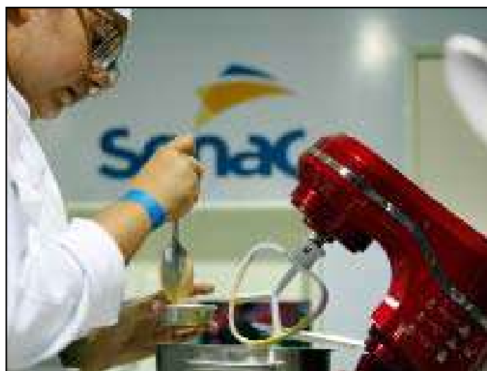
Atividades acontecem nos dias 12 e 13 de junho

Na quinta-feira (12), das 18h às 21h, será