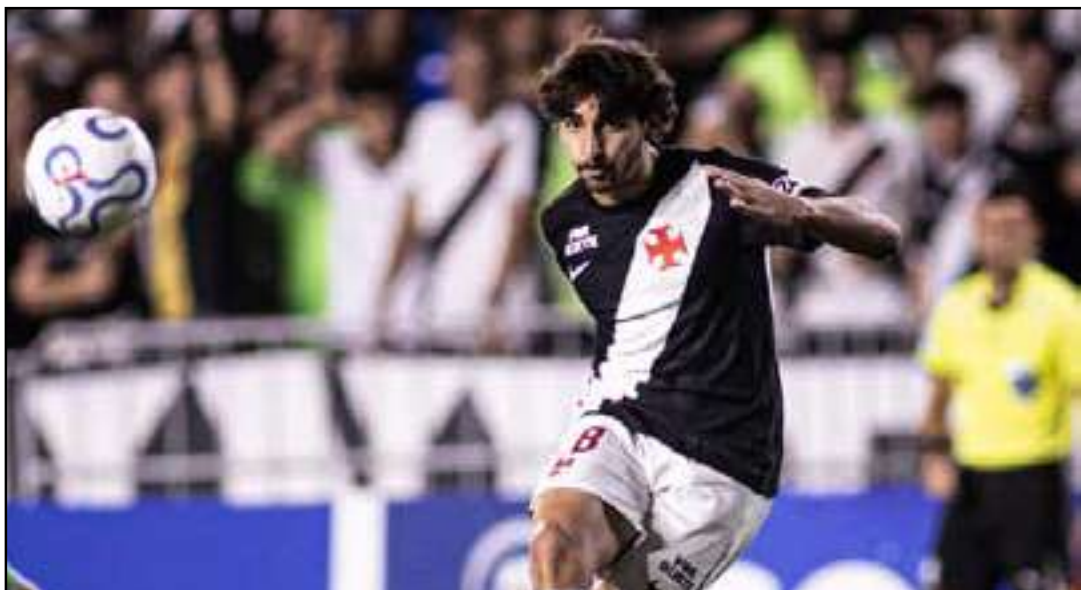
Meio-campista deve ganhar mais espaço no elenco principal

Na atual temporada, o lateral-esquerdo acumula quatro assistências em 32 partidas disputadas, todas como titular. O desempenho consistente também lhe garantiu presença na pré-lista elaborada pelo técnico Carlo Ancelotti para a Copa do Mundo, embora o atleta não tenha sido incluído na convocação final.