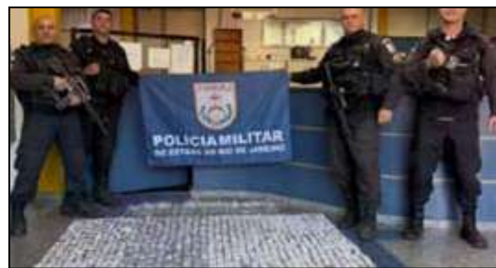
PM encontrou grande variedade de entorpecentes escondidos em área de mata na cidade

Todo o material foi levado à delegacia da região para registro da ocorrência. Ninguém foi preso até o momento.