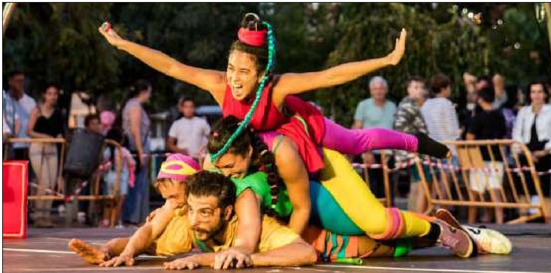
Coletivo já levou seus espetáculos para mais de 15 estados brasileiros

zação, as oficinas para adultos terão vagas reservadas para pessoas trans e em situação de vulnerabilidade social. Pessoas trans também