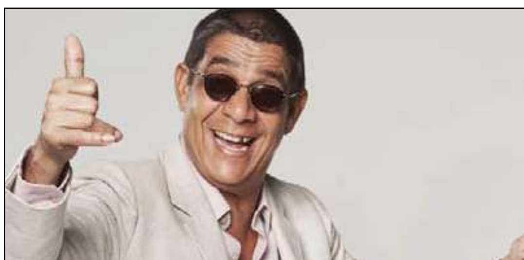
PL destaca a contribuição do sambista para a cultura de Xerém

Segundo a justificativa do projeto, a homenagem reconhece a contribuição de Zeca Pagodinho para a cultura brasileira e sua forte relação com Duque de Caxias, especialmente com o distrito de Xerém, onde o artista reside há anos. O texto