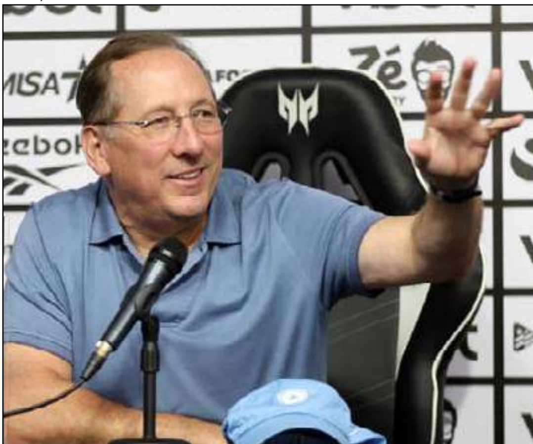
Nova punição impede registro de jogadores até que débito seja quitado