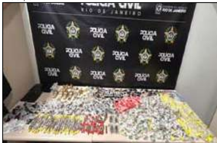
A polícia apreendeu 281 tabletes de maconha e skank, 12 unidades de haxixe, 512 pinos de cocaína e 290 pedras de crack

Dois homens foram presos e um adolescente apreendido durante operação da Polinter que fechou um depósito de drogas em um casarão na Travessa Mosqueira, na Lapa, Centro do Rio de Janeiro. No imóvel, agentes encontraram mais de mil porções de entorpecentes prontas para distribuição.