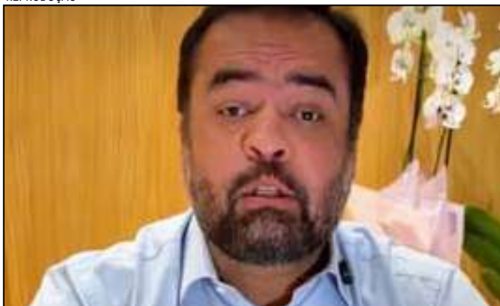
Contas do ex-governador Cláudio Castro mostram "distorções generalizadas dos valores"

O Tribunal de Contas do Estado do Rio (TCE-RJ) rejeitou na tarde de ontem (1º) as contas de 2025 do governo do ex-governador Cláudio Castro por 3 votos a 1. O relatório segue para a Alerj e os deputados darão a palavra final sobre sua aprovação ou não.