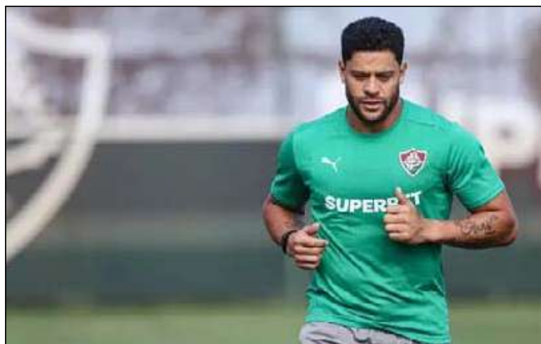
Atacante já participa dos treinamentos e recebe elogios dos companheiros